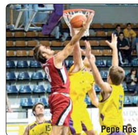
FASE FINAL ASCENS (al millor de 2)

intensitat, forts de cap i cames, el colomencs van rebolcar al Salle Reus -parcial 15-35-. Coronada la seva actuació, els visitants van pagar el seu sobreestorg, van flaquejar i van acabar cedint en un marcador que deixa l'eliminàtòria més que oberta. • Segrestada l'alternança al marcador al llarg de 30 minuts, cohibit qualsevol tipus d'atac capaç de provocar una mínima renda, semblava que Ramon Llull i UBSA acceptessin la incertesa de manera perllongada. Però quan tot apuntava que el joc seguiria la tònica de l'equilibri, els locals van trencar el gel amb un parcial d'11-0, flexa enverinada al cor adriànic. Lluny d'amagar-se i acabar condemnats, els visitants van agafar aire i, en cinc minuts, van remuntar la contesa. Digne colofó a un matx amb molt en joc.