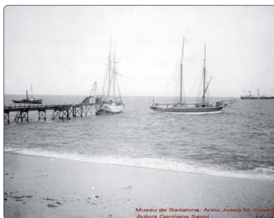
Museu de Badalona. Arxiu Josep M. Cuyàs. Autors Germans Sayol

fonos i col·leccions d'empreses, entitats i institucions, així com documents personals, professionals i familiars. En conjunt, el Museu de Badalona disposa de més de 1.000 metres lineals de documents. La visita guiada a l'Arxiu Històric de la Ciutat serà gratuïta. Cal fer reserva prèvia a les mateixes instal·lacions del Museu de Badalona o bé trucant per telèfon ja que les places són limitades.