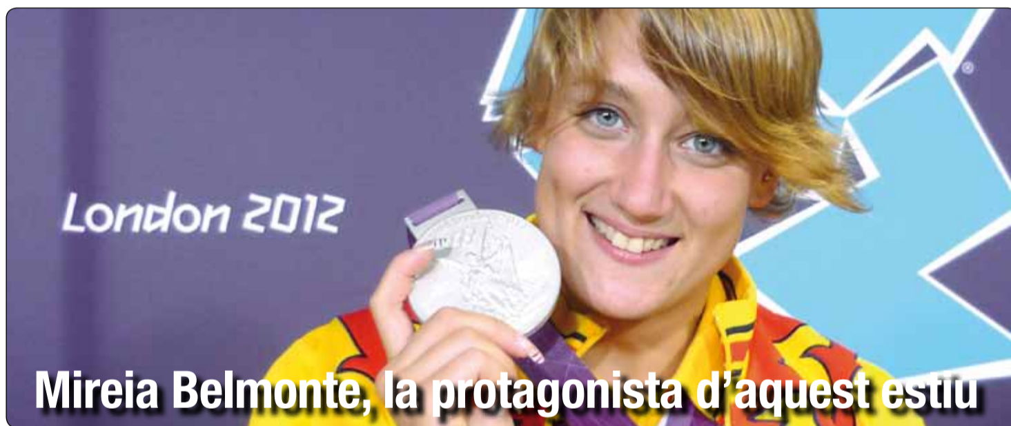
Mireia Belmonte, la protagonista d'aquest estiu