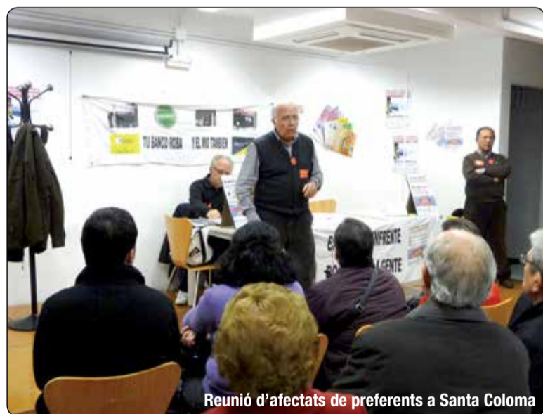
Reunión d'afectats de preferents a Santa Coloma

Tenemos un equipo de dos personas destinado casi exclusivamente a los casos bancarios, sobre todo, relacionados con la adquisición de participaciones preferentes y la deuda subordinada. Es uno de los departamentos que más casos recibe en la