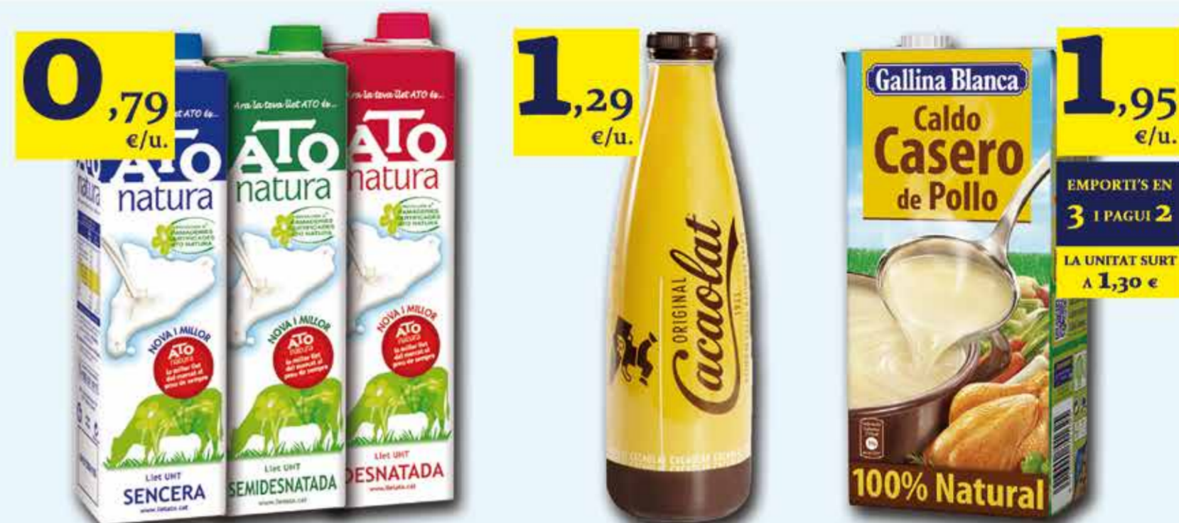
Llet ATO Natura brick 1 Lt (sense nata, semi o desnatada)