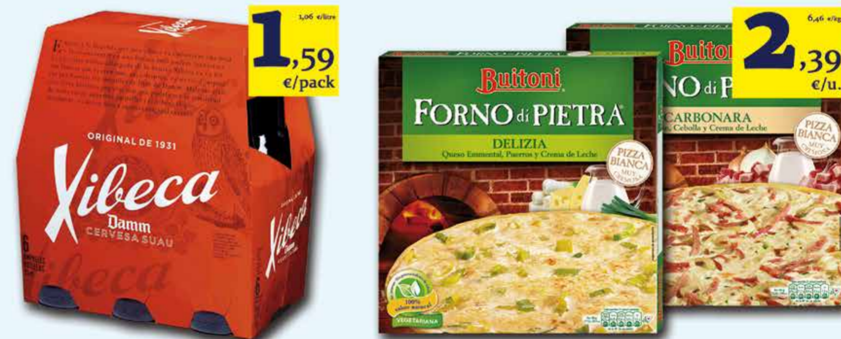
Cervesa XIBECA - DAMM 25 cl pack-6 u