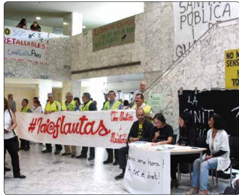
Departament de Salut. A més, afegeixen, si el pacient no respon a la trucada amb la que se li ha d'atorgar hora, passa al final d'aquesta

L'Agora ciutadana de Badalona, de la qual forma part la Plataforma Can Ruti diu Prou, ha engegat aquesta setmana la campanya "No marxis sense hora, hi tens tot el dret", una iniciativa impulsada a diferents localitats que té com a objectiu manifestar una "realitat adulterada" a través de la manipulació de les dades referents a les llistes d'espera de la sanitat catalana. Els impulsors de la campanya expliquen que, molts cops, els pacients surten dels hospitals o CAPs sabent que necessiten una visita o intervenció però sense que se'ls hagi donat cita perquè el temps d'espera és massa ampli i han d'esperar una trucada del centre per concretar-la. Aquests usuaris són inclosos, diuen, dins d'una "llista d'espera prèvia" que no es pren com a referència a l'hora de donar les dades oficials i que només són comptabilitzats un cop reben dia i hora, fet que es pot arribar a demorar setmanes. En resum, afirmen que existeix molta més gent a l'espera de ser atesa que la que en realitat declara el