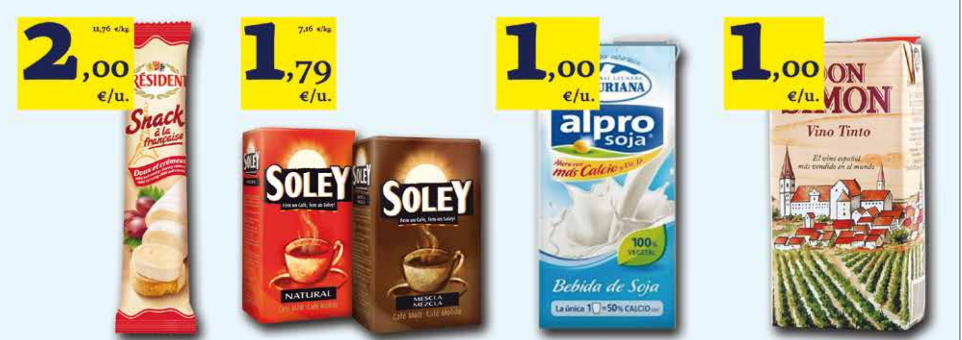
Formatge PRESIDENT rulo Snacking bric 170 g | Cafè SOLEY molt (mescla o natural) 250 g | Beguda de soja brick 1 L ALPRO Asturiana | Vi DON SIMON brick 1 Lt (negre, blanc o rosat)