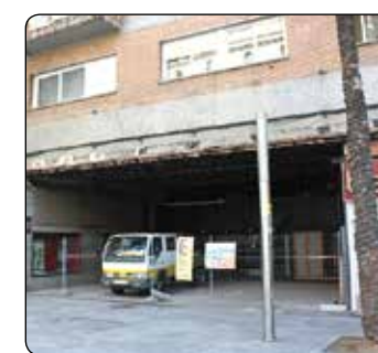
dels antics Picarol. La galeria de la plaça de la Vila donaria entrada a una zona comercial i independent del gimnàs, d'uns 1.500 metres quadrats.

Ha passat molt de temps des del tancament dels Cinemes Picarol, al darrer suspir del 2008, i no va ser fins fa uns dies que van començar les obres de remodelació que convertiran les instal·lacions en un centre esportiu. Les enormes lletres de l'entrada ja han estat retirades i els treballs s'allargaran durant tot el 2014. Serà a finals d'any quan, segons està previst, el grup de gimnasos Metropolitan obri les seves portes a Badalona. Encara que l'empresa no ha confirmat la disposició de les instal·lacions, l'entrada del nou centre seria pel carrer Sant Miquel, on estava situada la sortida d'emergència