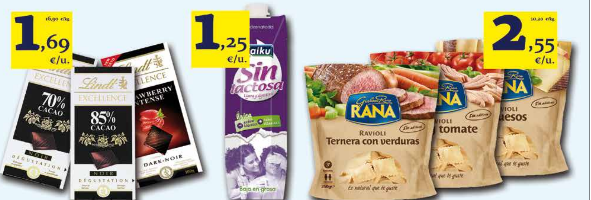
Xocolata negra LINDT Excellence 100 g (diversos sabors) | Llet KAIKU brick 1 L sense lactosa semi | Pasta fresca RANA 250 g (diversos sabors)