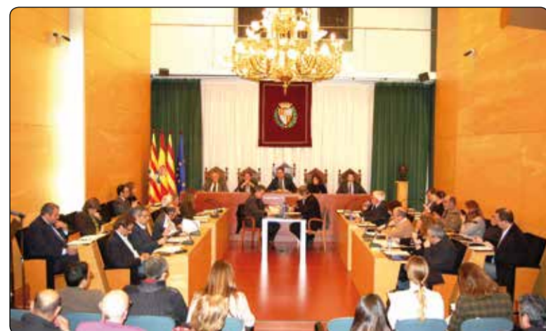
Tots els grups municipals del Ple van votar aprovar aquesta setmana una mo-