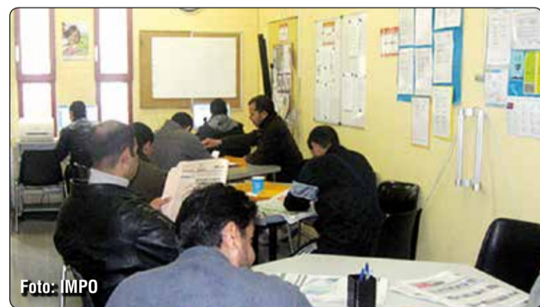
El Ple de l'Ajuntament de Badalona va aprovar la setmana passada la recepció d'un subvenció atorgada pel Servei de l'Ocupació de Catalunya, per un import de 403.324 euros i destinada al "Projecte de dinamització laboral i promoció de l'ocupació en els territoris acollits a la Llei de Barris a Badalona - Pla d'Execució

2013". L'Institut Municipal de Promoció de l'Ocupació (IMPO) serà l'encarregat d'executar les accions previstes: un pla d'ocupació que donarà feina a jornada completa i durant sis mesos a 19 persones, a més d'acompanyar, assessorar i preparar per al món laboral a unes 300 més.