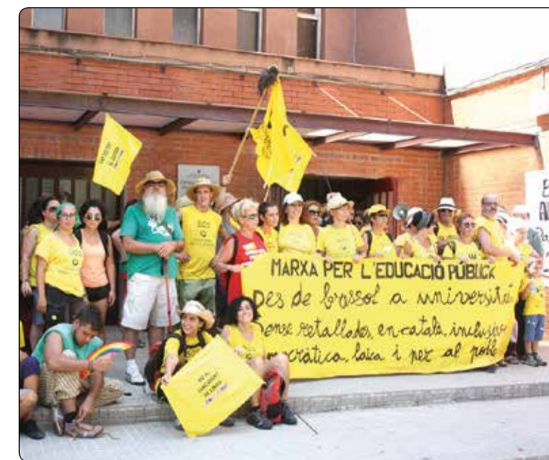
El Baldiri, cara de la lluita educativa

Per segon any consecutiu, la comunitat educativa catalana comença el curs amb molta força i en peu de guerra. Durant tota la setmana passada, l'Assemblea Grog, la plataforma que reivindica un ensenyament públic sense retallades, gratuït i en català, va organitzar la segona marxa per l'educació pública. El dia 23, la manifestació va arrencar a la ciutat de Girona, des d'on va iniciar un viatge a peu fins a Barcelona. Més de 100 quilòmetres i 40 activitats repartides en vuit etapes i passant per ciutats com ara Blanes, Arenys de Mar, Mataró i El Masnou. La darrera parada abans d'entrar a la capital catalana, dissabte, va ser Badalona, on la Marxa Educativa va arribar poc abans del migdia, a través de la platja de la Barca Maria. L'escola Baldiri Reixac va fer de punt d'atipellament i va acollir el centenar de persones que havia sortit de El Masnou de bon matí. El pati del centre va servir de menjador, en el qual tothom va gaudir d'un àpat i a on es van dur a terme uns parlaments abans de continuar la caminada cap a Barcelona. L'elecció del Baldiri com a punt d'aturada de la marxa no és pas fortuït, i és que l'escola de Llefia-La Salut va ser la cara de la lluita educativa a Badalona durant moltes setmanes abans de finalitzar el curs.