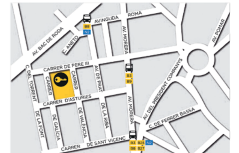
C/ Pere III, 45. Badalona