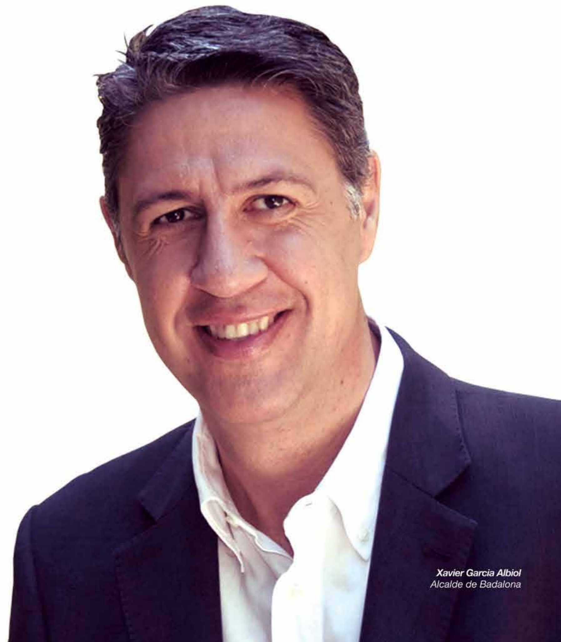
Xavier Garcia Albiol Alcalde de Badalona