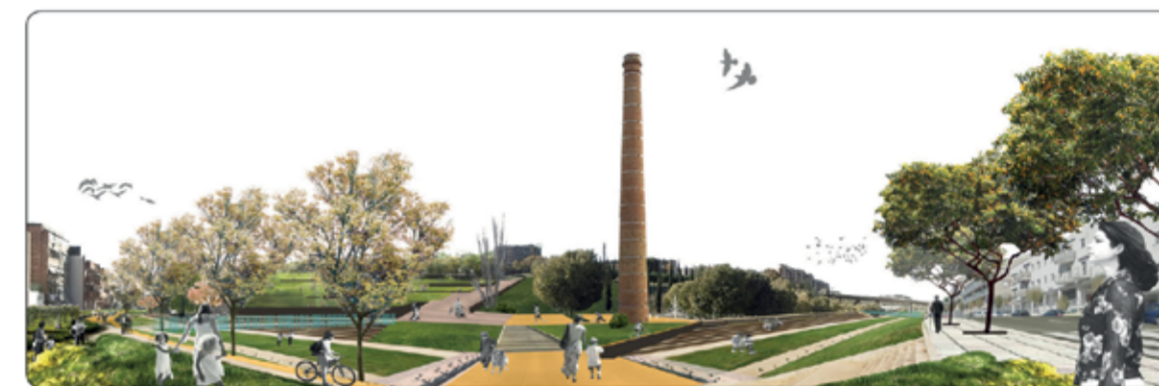
El projecte Arqua

'Passatges Metropolitans' és un concurs d'idees impulsat per l'Àrea Metropolitana de Barcelona (AMB), el passat mes d'octubre de 2014, en associació amb l'Institut pour la Ville en Mouvement (IVM), i s'emmarca dins el programa internacional 'Passatges, espai de transició per la ciutat del segle XXI'. Amb aquesta iniciativa, l'AMB buscava talent en les noves generacions i poder recollir propostes de microintervenció a l'entorn urbà que aportin a nivell metropolità; amb una mirada fresca, innovadora i, sobretot, amb el ciutadà com a protagonista.