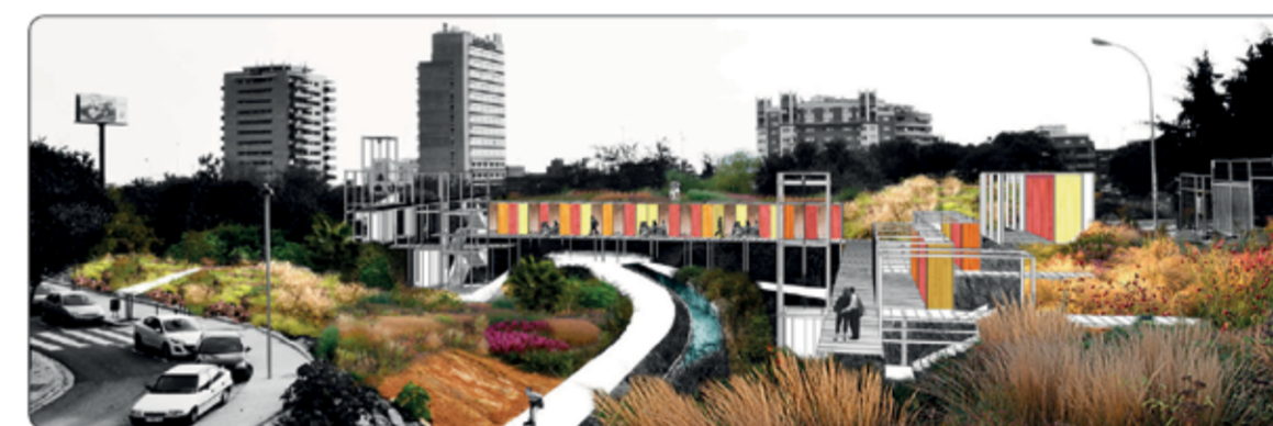
El projecte Paisatge Infraestructural