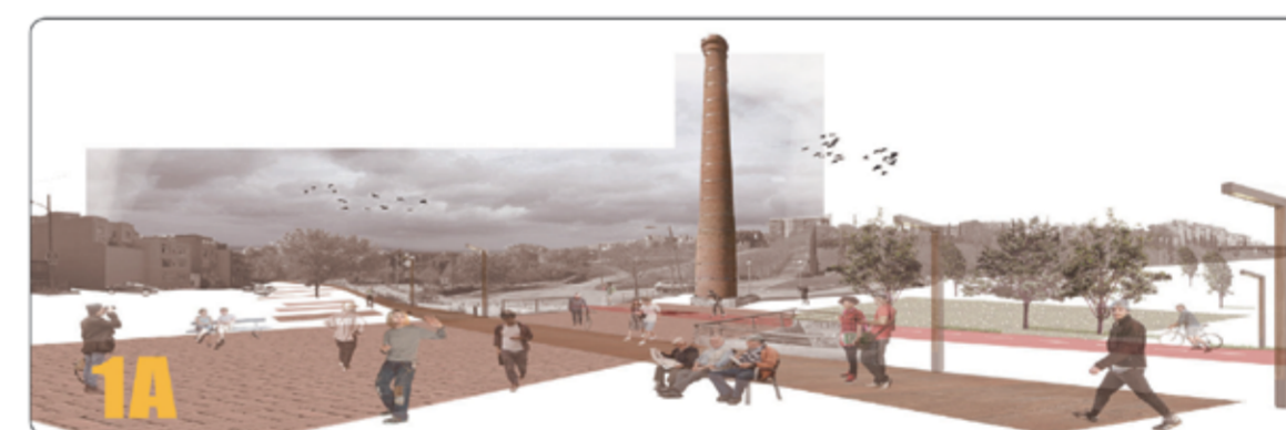
El projecte Unbreaking Badalona

■ L'AMB busca talent en les noves generacions i configurar un catàleg de reflexions i estratègies a tenir en compte per a futures actuacions