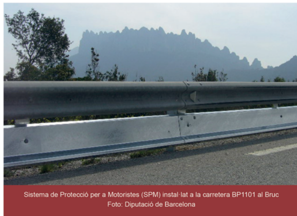
Sistema de Protecció per a Motoristes (SPM) instal·lat a la carretera BP1101 al Bruc