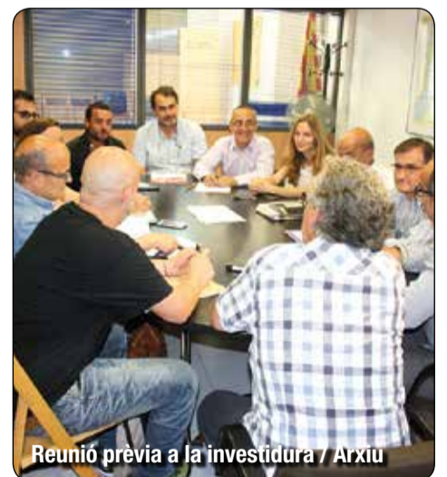
Reunió prèvia a la investidura

Guanyem BDN, ERC i ICV-EUiA no accepten l'entrada del PSC al govern després de la investidura