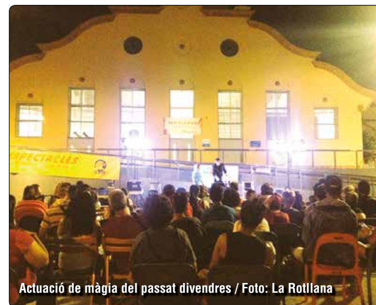
Actuació de màgia del passat divendres

Des de finals de juny, la Rotllana va traslladar part de la seva activitat a l'Escorxador de La Salut, l'espai municipal en el que desenvolupen l'Estiu a la Plaça, una iniciativa de lleure a l'aire lliure que programa un ampli ventall d'activitats durant tota la setmana i per a tots els públics. Si el passat divendres l'entitat donava la campanada amb la Nit Màgica, amb una actuació