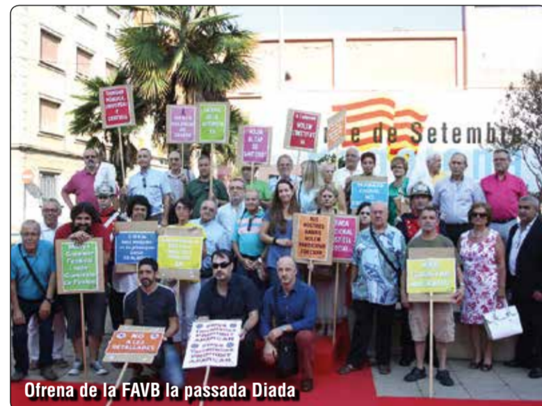
Ofrena de la FAVB la passada Diada

12h. Diada castellera, amb colles d'Esplugues i Sant Vicenç dels Horts