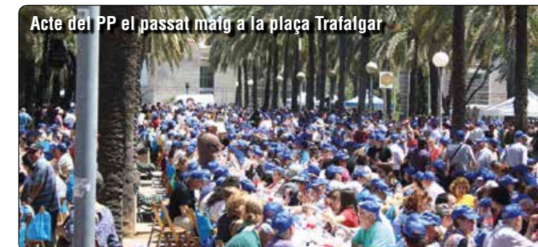
Acte del PP el passat maig a la plaça Trafalgar

Des d'avui i fins divendres, els partits continuaran amb grans mítings de campanya