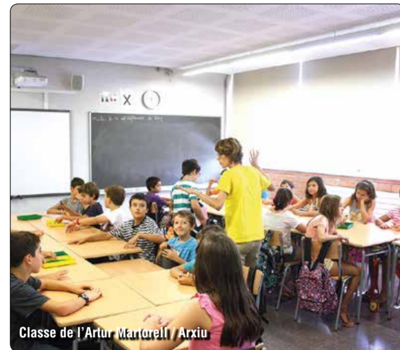
Classe de l'Artur Martorell

línia, afirmen les AMPA. En pocs anys, més d'un centenar d'infants que acabaran l'etapa de Primària en uns barris on no hi ha instituts públics. I és que, al marge de les Escoles Minguella, concertada, Canyadó, Casagemes i Manresà, tres barris amb una població total de més d'11.000 habitants, no disposen de cap centre més. Els IES de referència per als veïns i veïnes d'aquesta part nord del terme municipal són el Pompeu Fabra i l'Isaac Albéniz, situats a la frontera entre Morera i Bufalà, per sobre de l'autopista. Tot i que no són a tocar, es tracta dels dos instituts més propers a la zona educativa 6, però Artur Martorell i Lola