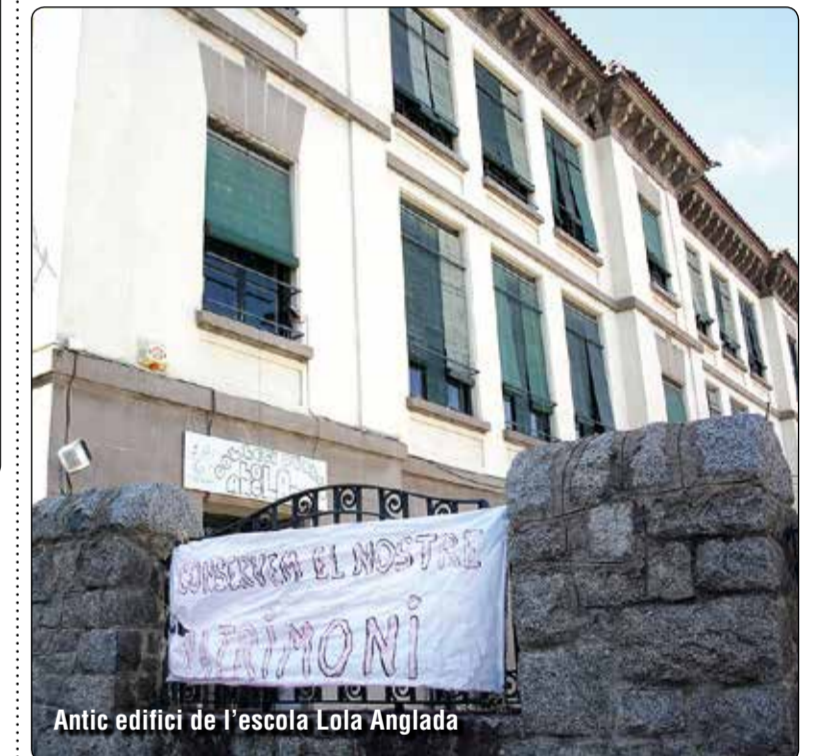
Antic edifici de l'escola Lola Anglada

AMPAs i entitats veïnals volen que es rehabiliti i sigui un nou institut