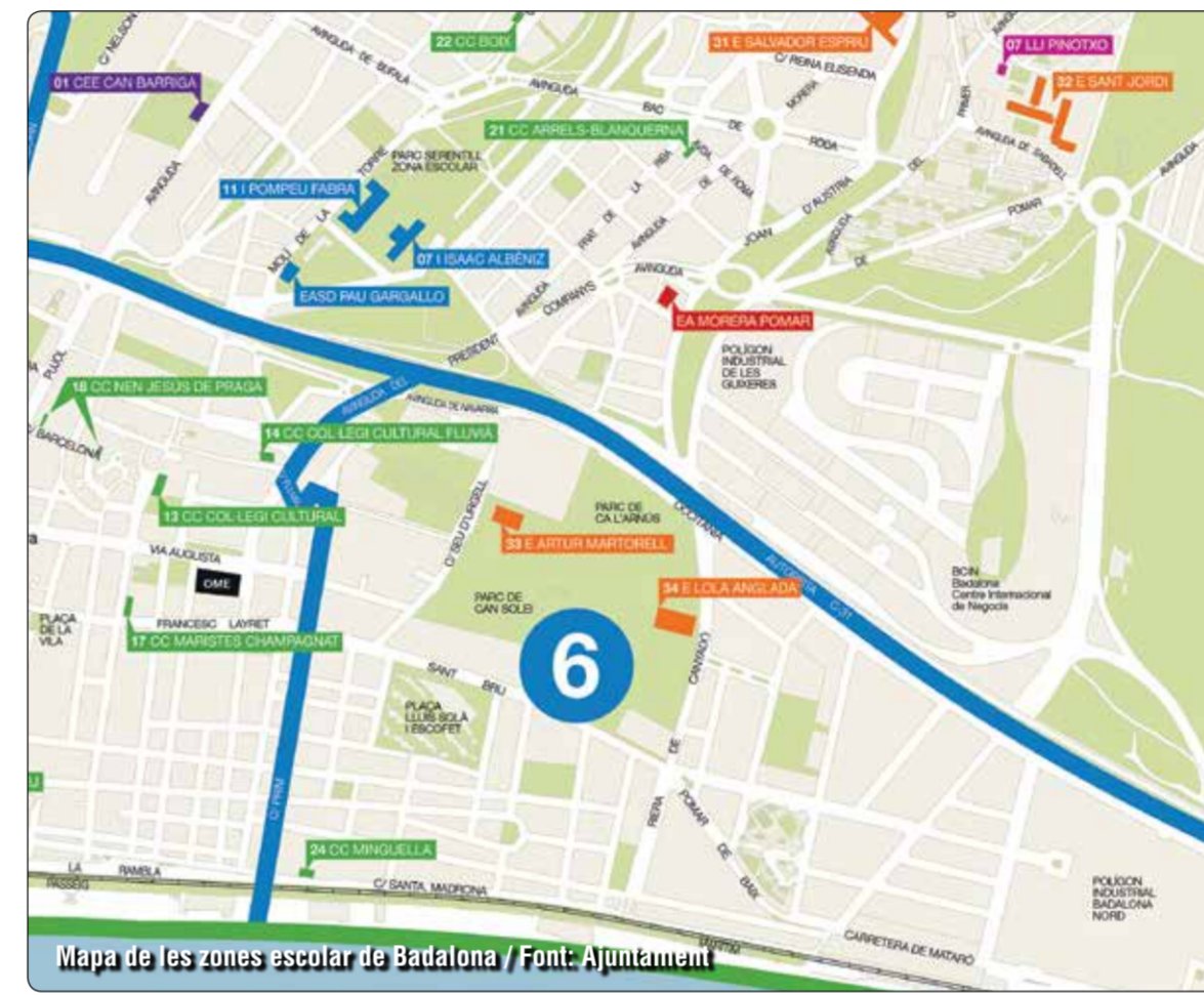
Mapa de les zones escolars de Badalona

■ Educació afirma que mancarà una trentena de places a Pompeu i Albéniz