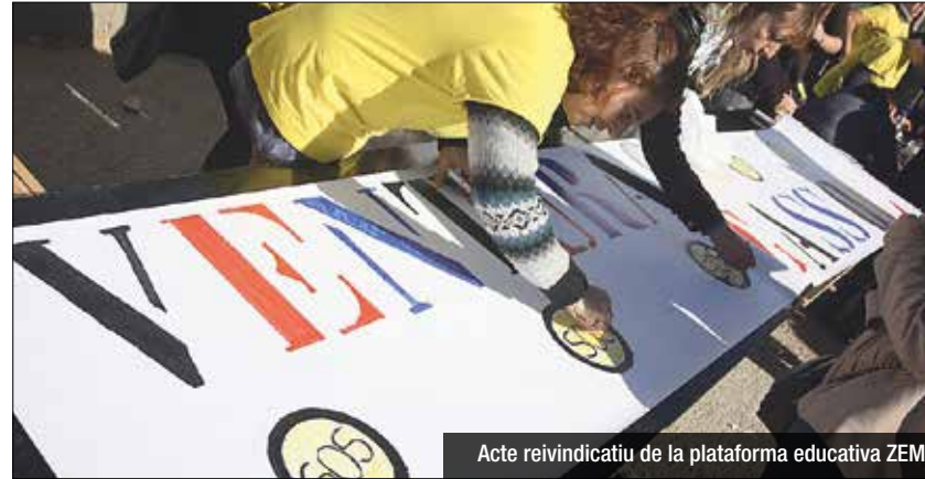
Acte reivindicatiu de la plataforma educativa ZEM

La Generalitat obre la licitació del projecte executiu per valor de 326.000 euros