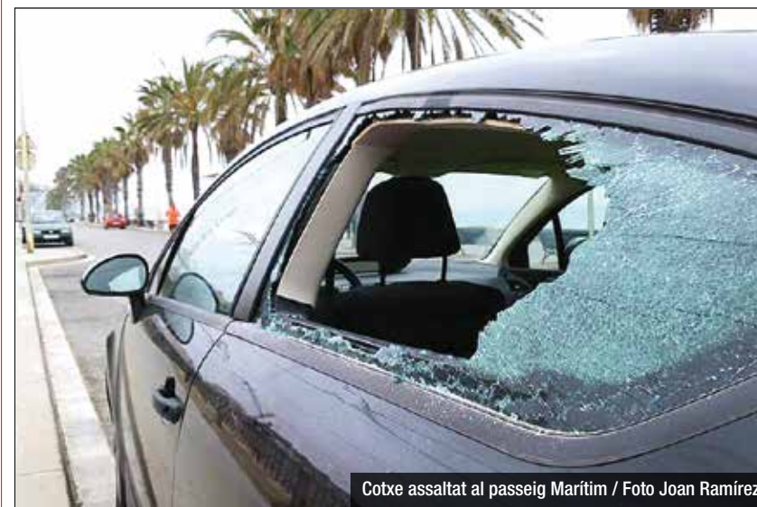
Cotxe assaltat al passeig Marítim

Onada de robatoris la matinada de dilluns a dimarts al passeig Marítim, al tram més proper a la riera Canyadó, a l'alçada de Santa Madrona i passat la riera, a la banda de la platja del Cristall. La notícia ha començat a saltar a les xarxes socials, on els veïns han fet difusió de les fotografies. Fonts municipals van confirmar que la Guàrdia Urbana va poder identificar 15