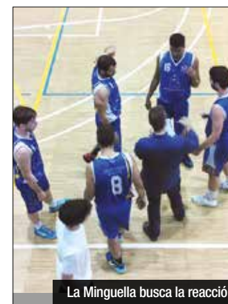
La Minguella busca la reacció

A Primera, el Badalonès ja és líder de grup