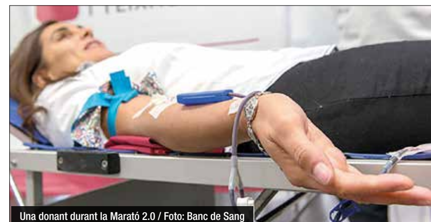
Una donant durant la Marató 2.0

L'estat de les reserves de sang a Catalunya està a un nivell de normalitat, amb més d'11.000 unitats de sang, que equival a les necessitats dels hospitals per a uns 11 dies.