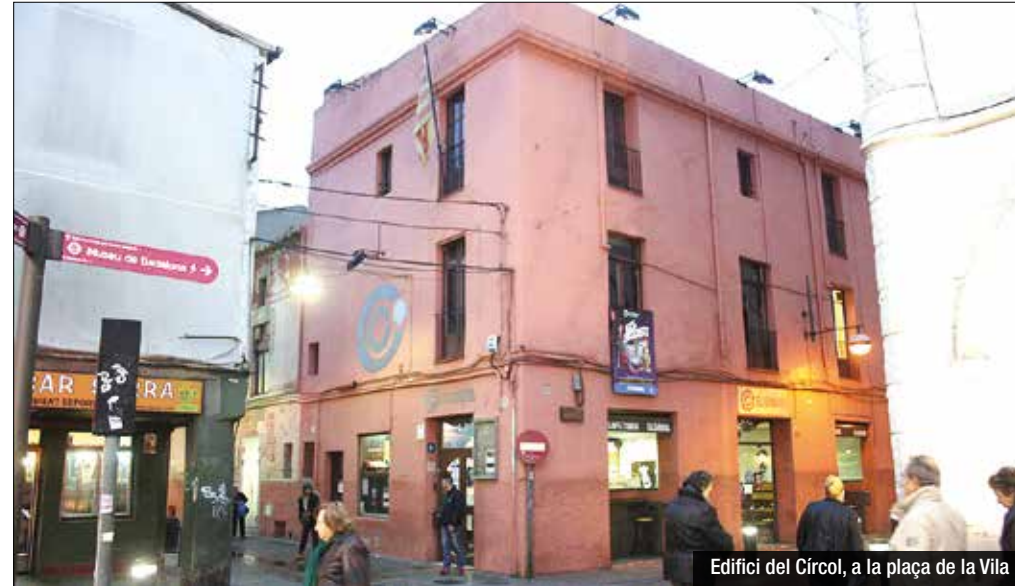
Edifici del Círcol, a la plaça de la Vila

L'Ajuntament de Badalona ha guanyat un any de temps per mirar de trobar una solució per a la situació del Círcol, la seu de la qual es troba en el punt de mira d'una immobilitària des de fa uns mesos. El Ple municipal ha aprovat una suspensió de llicències d'un any a un sector de la plaça de la Vila que inclou la finca de l'entitat, cosa que impedirà qualsevol obra o canvi d'activitat. La parcel·la afectada per la fórmula abraça la confluència entre els carrers Sant Anastasi i Francesc Layret i una dotzena de propietaris. Es tracta d'un sector, explica el govern municipal, fora d'alineació i amb un pla especial de desenvolupament que té més de 25 anys i que no ha servit per desbloquejar l'espai. "El consistori té la intenció de promoure un planejament que buscarà millorar urbanísticament la plaça de la Vila, ampliant les voreres i buscant una solució de conjunt i de qualitat". L'altre objectiu perseguit, segons l'executiu, és