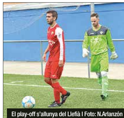
El play-off s'allunya del Llefia

Per últim, a la Quarta Catalana, el duel principal del cap de setmana en clau badalonina finalitzaria sense gols. El Pere Gol (40), co-líder del grup VI, marxaria del camp del tercer classificat amb un empat valuós. L'Atlètic Masnou