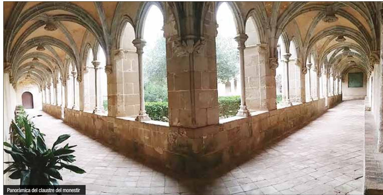
Panoràmica del claustre del monestir