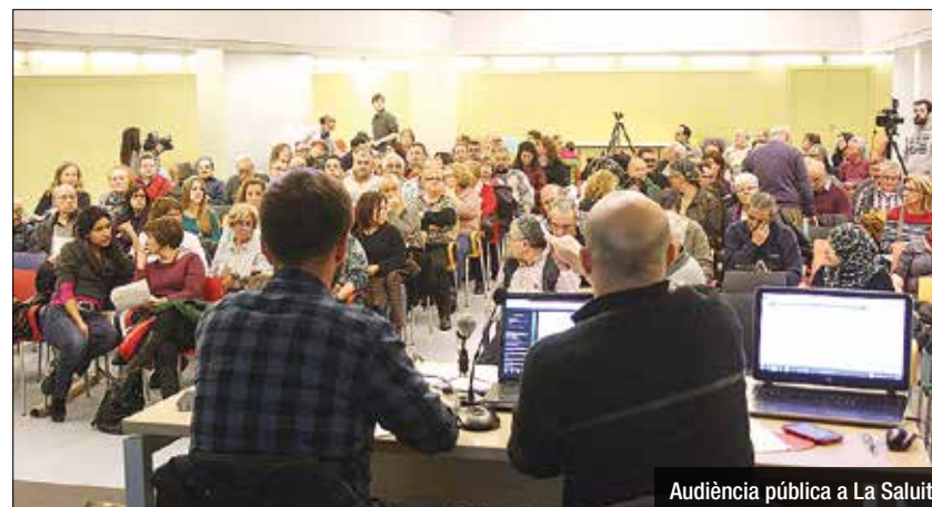
Audiència pública a La Salut

3.730 persones, un 2,07% del cens, ha votat en què invertir 500.000 euros