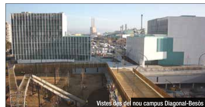
Vistes des del nou campus Diagonal-Besòs