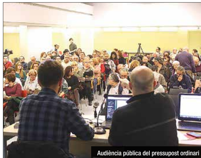
Audiència pública del pressupost ordinari

El pressupost d'inversions de l'Ajuntament de Badalona podria girar entorn als 30 milions d'euros, segons fonts del govern municipal. Aquesta seria la quantitat aproximada que el Consistori "espera demanar a crèdit per a possibles inversions", la xifra que la situació financera "permet per aquest mandat". Tot plegat seria una aproximació tècnica que no està ni molt menys tancada i que ni tan sols s'ha començat a negociar amb la resta de forces, amb les que encara s'està debatent l'aprovació del pressupost ordinari. En qualsevol cas, això sí, tot apunta a que la quantitat serà superior al darrer annex d'inversions, presentat pel PP, que pujava fins als 18 milions. A dia d'avui, els diferents departaments del Consistori estan acabant de realitzar les seves peticions per saber quines són les necessitats