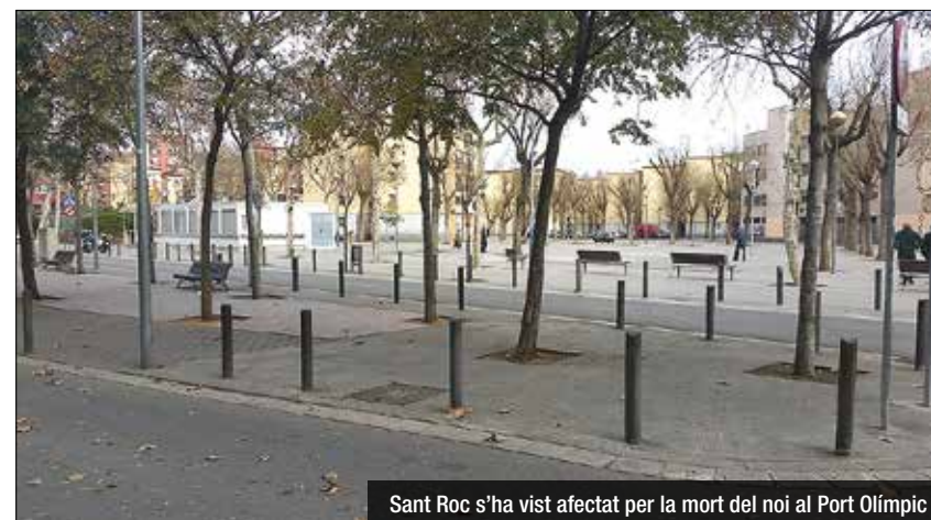
Sant Roc s'ha vist afectat per la mort del noi al Port Olímpic

Sigui com sigui, Pedro Pacheco, ex-alcalde de Jerez de la Frontera, que el 1985 va sentenciar que "la justícia es un cachondeo" (frase que va provocar molta urticària i va pagar amb una condemna d'inhabilitació). Potser avui Pacheco s'atreveria a dir molt més que això. Potser diria que la justícia és una estafa o com a mínim una presa de pèl. Potser diria que de justícia n'hi ha. Però, d'obligat compliment, només pel segment mitjà de la població. El que paga impostos, té càrregues de tota mena, passa la ITV escrupolosament i declara tot el que guanya. Potser pensaria que els de dalt, les classes benestants, la burgesia, la monarquia, altres privilegiats, i els de baix, per raons culturals, coincideixen alhora de passar-se-la per l'aixella o per l'arc del Triomf.