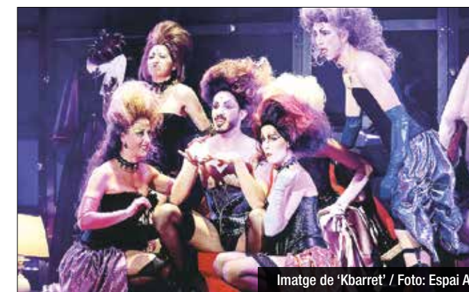
Imatge de 'Kbarret'

i Acció Culturals del Departament de Cultura de la Generalitat de Catalunya, coordinat per la Federació d'Ateneus de Catalunya i amb la col·laboració del Moviment Corral Català, la Federació de Grups amateurs de Teatre de Catalunya, la Federació Catalana de Societats Musicals i l'Agrupament d'Esbaris Dansaires.