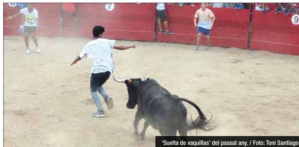
'Suelta de vaquillas' del passat any. / Foto: Toni Santiago

Govern i veïns arriben a un acord per no tornar a celebrar la polèmica festa