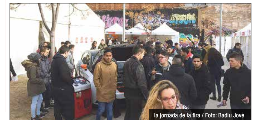
1a jornada de la fira

'Human Library', un espai on professionals explicaran directament als estudiants en què consisteix el seu ofici, què s'ha d'estudiar per arribar a treballar en aquesta feina, a on es poden cursar aquests estudis, etc... La 'Human Library' funcionarà els dos dies a l'Espai Carpa i els professionals s'agrupen per sectors. Hi haurà professionals del món tecnològic, del món socio-lingüístic i educatiu, del món de l'art i la comunicació, del món de la ciència i la salut i del món empresarial i jurídic.