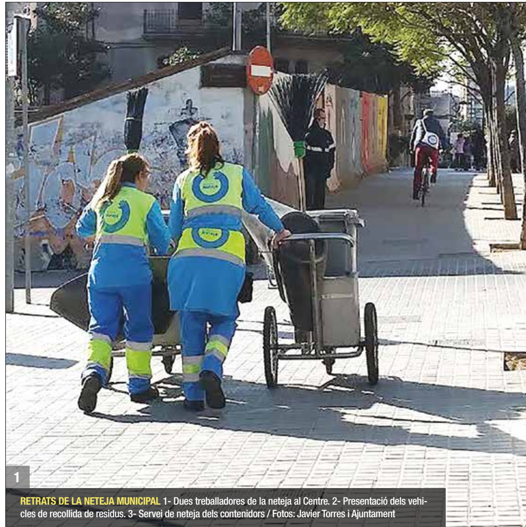
RETRATS DE LA NETEJA MUNICIPAL 1- Dues treballadores de la neteja al Centre. 2- Presentació dels vehicles de recollida de residus. 3- Servei de neteja dels contenidors

La remunicipalització de diferents serveis públics era una de les promeses electorals del principal partit del govern, Guanyem Badalona, i una fita gens senzilla d'assolir. L'aprovació de la nova llei de racionalització de les administracions locals (RSAL), de fet, impedeix les remunicipalitzacions, per això el regidor d'Espais Públics, Javi López, insisteix en utilitzar l'expressió "aproximar el servei a l'Ajuntament". Els