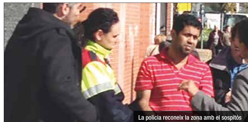
La policia reconeix la zona amb el sospitós

dos es van trobar, el condemnat va colpejar la veïna de Santa Coloma i la va estrangular. Poc després, va enterrar el seu cadàver i va tornar al pis de la família, des d'on el marit de la víctima va denunciar la desaparició de la dona. El cos no va ser trobat fins al mes d'abril, en avançat estat de descomposició. Durant la instrucció, els mesos previs a la troballa del cos, es va poder veure la policia recorrent alguns carrers de Montgalà i Fondo amb l'home detingut per reconstruir els fets.