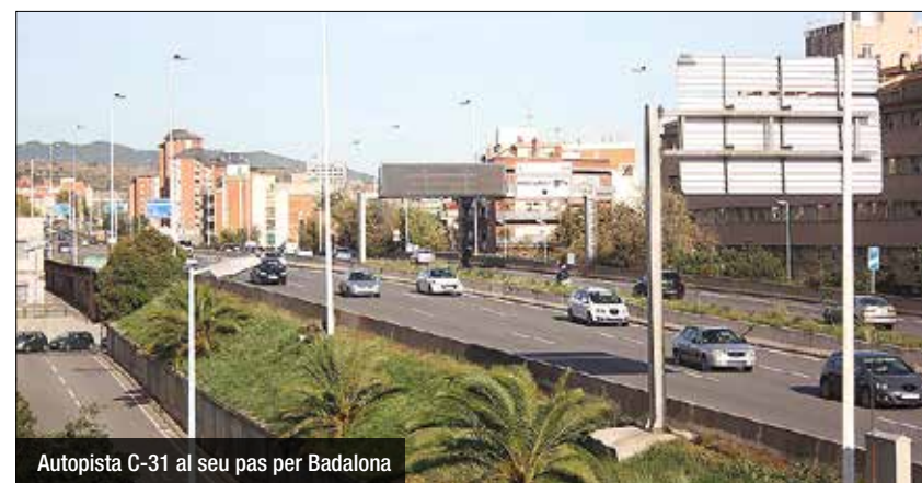
Autopista C-31 al seu pas per Badalona

Els Mossos d'Esquadra van detenir fa uns dies una dona de 36 anys, veïna de Barcelona, per conduir sota els efectes de l'alcohol i sense haver obtingut mai el permís. Els fets van succeir a la C-31, al seu pas per Badalona, on va haver-hi un accident de trànsit entre dos vehicles que va acabar amb danys materials tant als vehicles implicats com a la via. La conductora, en un primer moment, va facilitar unes dades personals a la policia que no corresponien amb la seva identitat a