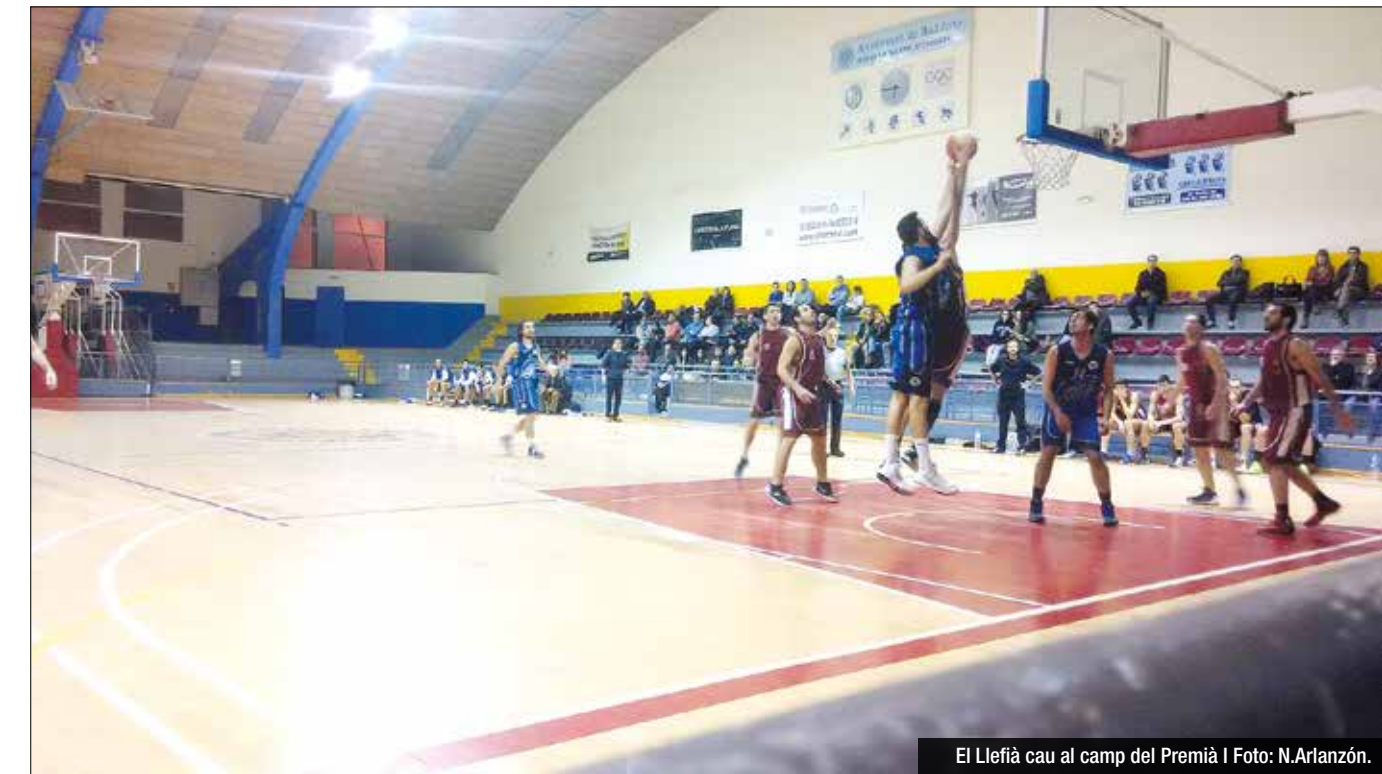
El Llefia cau al camp del Premià

La Minguella torna a perdre contra un Boet superior