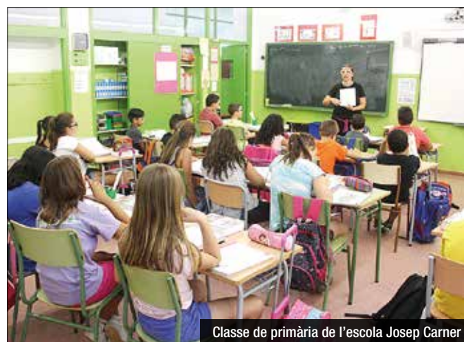
Classe de primària de l'escola Josep Carner

La mesura s'adopta als centres d'alta complexitat