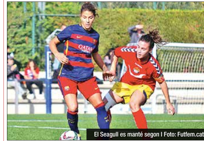
El Seagull es manté segon

El CE Seagull visita el Ruiz Casado buscant trencar la clara millora del Santgra