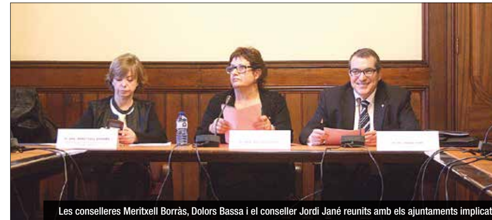
Les conselleres Meritxell Borràs, Dolors Bassa i el conseller Jordi Jané reunits amb els ajuntaments implicats

"El moment requereix discreció". Eren les primeres paraules de la consellera d'Afers Socials i Família, Dolors Bassa, aquest dimecres després de la primera reunió oficial entre la Generalitat i diferents ajuntaments, entre ells Badalona, per tractar la situació al barri de Sant Roc i La Mina derivada d'un enfrontament entre clans gitanos. Com explicava el Diari de Badalona la passada setmana, desenes de famílies del barri badaloní, i almenys 300 a La Mina, haurien marxat per precaució amb l'objectiu d'evitar possibles represàlies per l'assassinat d'un jove al Port Olímpic, a finals de gener.