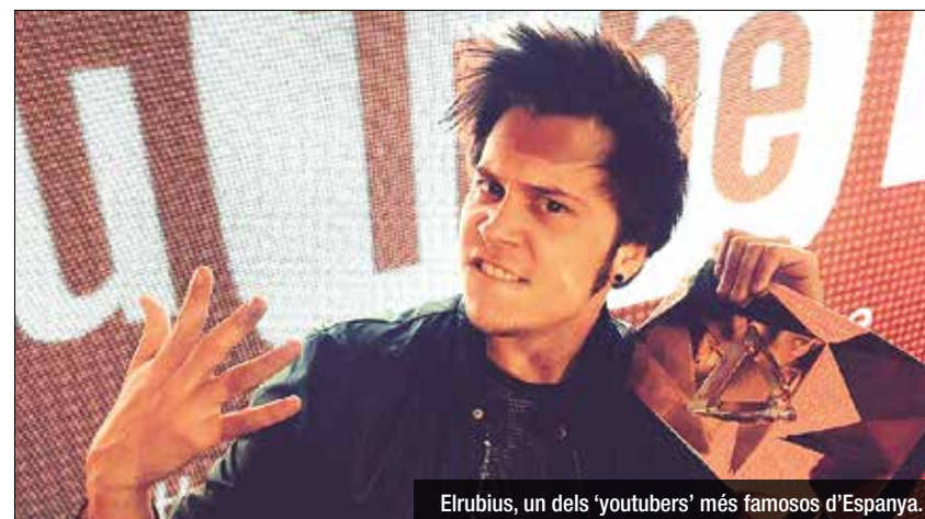
Elrubius, un dels 'youtubers' més famosos d'Espanya.

Jo també ho penso, i mentre em miro el melic Elrubius acumula 16'5 milions de seguidors al seu canal de Youtube. El badaloní Leulogio té uns 600.000. Els podem continuar deixant de banda, obviat-los, mofant-nos... Però penseu que d'aquí 30 anys no quedarà ningú que llegeixi diaris com aquest.