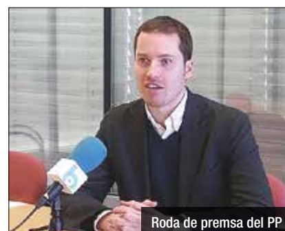
Roda de premsa del PP

Els 'populars' assenyalen diferents nomenaments per haver estat realitzats "a dit"