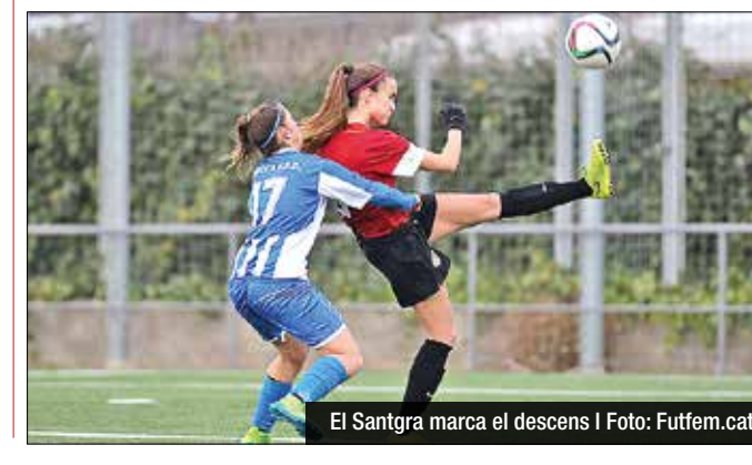
El Santgra marca el descens

genera moltes ocasions, però no està encertat de cara a porteria. A vegades, el futbol té això. Segurament, a l'inici de la lliga no vam tenir una superioritat tan clara per guanyar tants partits, i ara que estem fent moltes coses per sumar victòries no les estem aconseguint", destacava l'entrenador del Seagull. Mantenint la calma i la confiança en el treball que les ha dut fins a la segona plaça del campionat, les jugadores badalonines esperen trencar amb els fantasmes dels mals resultats aquest diumenge. Les gavines han de visitar el Municipal José Luiz Ruiz Casado (12:30h), fortalesa d'un històric com el CE Sant Gabriel. Després d'una trajectòria irregular i de l'arribada de Carlos Romero a la banqueta, el Santgra és l'equip que marca la permanència, amb només punt punt d'avantatge vers el descens (17). Les adrienesques, que ja van caure contra el Seagull en la primera volta (1-0), només han encaixat una derrota en els darrers sis duels. Tot i així, les blaves necessiten punts i diumenge sortiran a reivindicar-se.