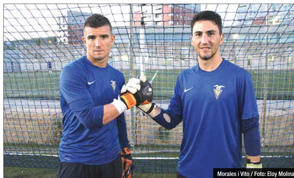
Morales i Vito

sigui, Manolo González confia plenament en aquest porter, fins al punt d'apostar que, com a mínim, acabarà jugant a segona divisió.