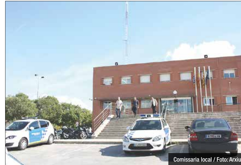
Comissaria local

criminal, segons ha publicat aquesta setmana la revista Interviu. El Consistori assegura haver estat notificat arran de la detenció i avança que se li obrirà un expedient sancionador per estudiar les mesures a prendre en base