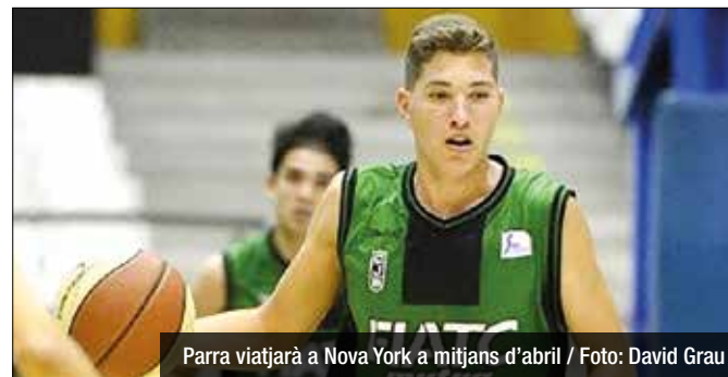
Parra viatjarà a Nova York a mitjans d'abril

El pivot del planter del FIATC Joventut, entre els deu millors d'Europa