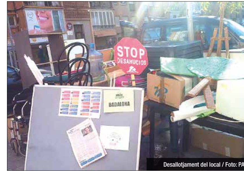
Desallotjament del local

El govern ha tancat l'expedient i l'entitat ja hi ha pogut tornar