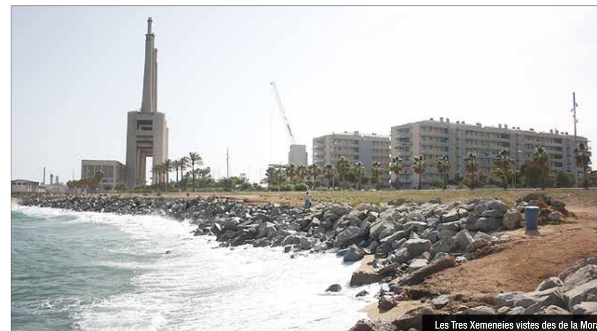
Les Tres Xemeneies vistes des de la Mora

70 representants adrianencs i 30 badalonins participen en tres jornades de debat