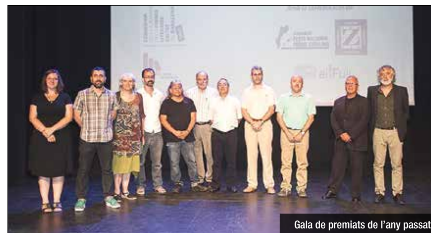
Gala de premiats de l'any passat

L'Ajuntament de Badalona, en col·laboració amb la llibreria El Full i les entitats Festa Nacional dels Països Catalans i Amics del Teatre Zorrilla, ha convocat els premis literaris Ciutat de Badalona 2016. Es tracta del 25è premi Ciutat de Badalona de Narrativa – 29è premi Països Catalans Solstici d'Estiu; el 16è premi Betúlia de Poesia – Memorial Carme Guasch; el 18è premi Ciutat de Badalona de Narrativa Juvenil i el 9è premi de Teatre Breu In-