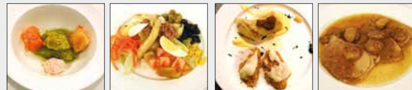
1r plat Texturitzat Amanida variada

gran en infeccions respiratòries. Amb el nostre projecte "El menjar un plaer... La Texturització" hem volgut donar a conèixer la importància que té la dieta per a tota persona i tot i patir una patologia concreta no cal privar-la d'aquest plaer. Els menús texturitzats proporcionats per Brofarquina, estan basats en els menús normals i consten de primer plat, segon plat i postres amb un emplatat específic.