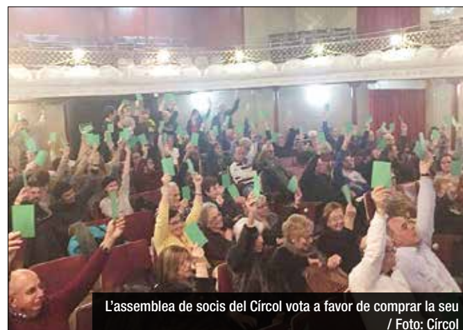
L'assemblea de socis del Círcol vota a favor de comprar la seu

El pas que pretén donar el Círcol és històric. I no serà senzill. L'entitat ha de reunir en unes setmanes prop d'un milió, la major part del qual provindrà de crèdits bancaris. S'han demanat 800.000 euros, que les entitats financeres, previ anàlisi, han d'atorgar o no —o no al 100%, almenys—. La resta provindrà de la tresoreria reservada per a casos de puntual necessitat i de les quotes extraordinàries de la majoria dels socis, ja que alguns casos, com ara els menors, no n'hauran d'abonar. D'altra banda, el Círcol ha obert la possibilitat d'acceptar donacions particulars dels seus membres que seran retornades en un període de dos anys. Tan bon punt es conegui la resposta afirmativa dels bancs,