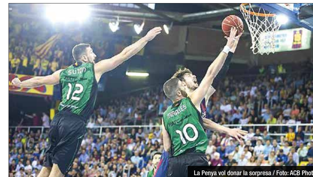
La Penya vol donar la sorpresa

Sigui quina sigui la diferència pressupostària entre els dos clubs, un Penya-Barça sempre genera una gran expectació. Després de recuperar el camí del triomf davant el Baloncesto Sevilla (89-83), el FIATC Joventut es prepara per repetir jornada actuant com a local, tot i que en aquesta ocasió l'equip de Salva Maldonado haurà de rebre un rival de màxima entitat. Onzena (9/13) i amb un ba-