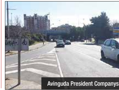
Avinguda President Companys

Un motorista va morir el passat cap de setmana en un accident que va tenir lloc la nit de divendres. Pràcticament arribats a la mitjanit, un home de 39 anys va caure a l'avinguda President Companys, a l'alçada de la incorporació a l'autopista C-31. La persona afectada va restar inconscient i les tres unitats del Servei d'Emergències Mèdiques de la Generalitat no van poder res per salvar la seva vida. Es tracta del primer accident mortal que es produeix aquest 2016 a la xarxa de carrers de Badalona. Fa unes setmanes, una noia, també motorista, va morir després d'un incident de trànsit a la pròpia C-31, al seu pas per Badalona.