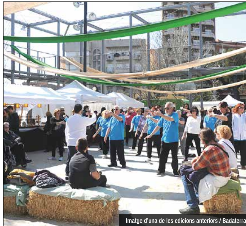
Imatge d'una de les edicions anteriors