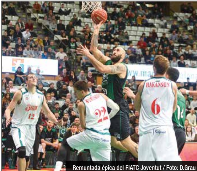
Remuntada èpica del FIATC Joventut