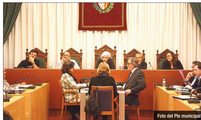
Foto del Ple municipal

de forma presencial als consells de districte i sectorials, per tal de recollir propostes i modificar el text inicial. Totes les idees s'hauran de validar durant el juliol i l'agost per part dels tècnics. Un cop comprovada la seva viabilitat, s'inclouran per llançar una proposta concreta a l'octubre i presentar-la al Ple i al Consell de Ciutat el novembre.