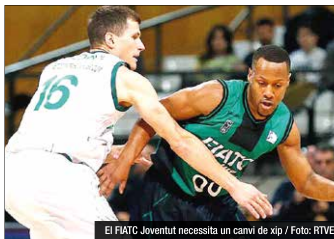
El FIATC Joventut necessita un canvi de xip