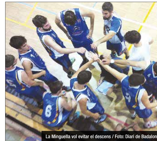
La Minguella vol evitar el descens

A 6 jornades per acabar la fase regular els equips es preparen per assolir objectius