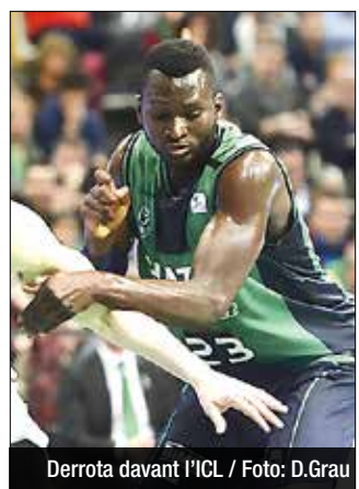
Derrota davant l'ICL

situar-se a sis punts, la regularitat exhibida per la tripleta formada per Musli (18 de valoració), Foster (15) i Auda (16) li donaria la victòria al bloc d'Ibon Navarro.