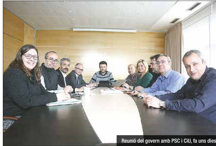
Reunió del govern amb PSC i CiU, fa uns dies

Iniciades les converses per arribar a acords abans de l'aprovació definitiva