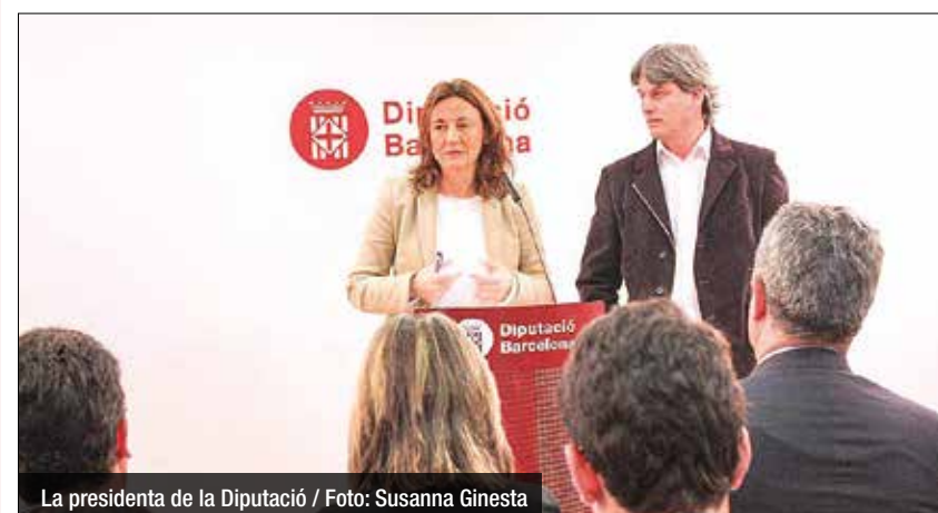
La presidenta de la Diputació