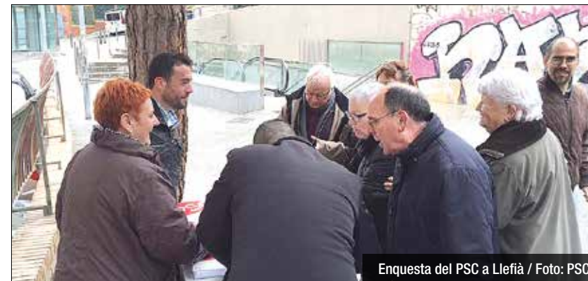
Enquesta del PSC a Llefià

Encara que els resultats no es faran públics fins d'aquí una setmana, després de presentar-los entre la militància, les sensacions inicials són positives i desprenen diferents aspectes, apunten fonts del partit. D'una banda, la escassa rebuda de l'opció de la moció de censura a certs barris de la ciutat on la força d'Albiol a les municipals era molt destacada; de l'altra, la utilitat que, diuen, ha tingut la iniciativa per tal de donar a conèixer a algunes zones el nou equip al capdavant del