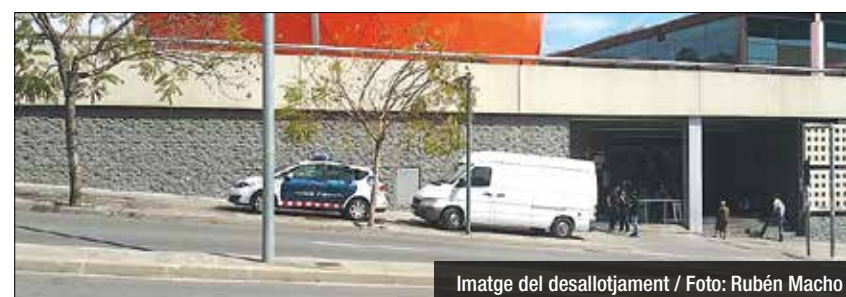
Imatge del desallotjament

El Màgic Badalona va haver de ser desallotjat el passat dimarts al matí pels Mossos d'Esquadra després que treballadores del centre trobessin un paquet sospitós a l'interior dels lavabos. Diferents dotacions de la policia catalana van posar en marxa el protocol d'actuació habitual davant d'un cas d'aquesta tipologia, en el que es troba un objecte potencialment perillós per a les