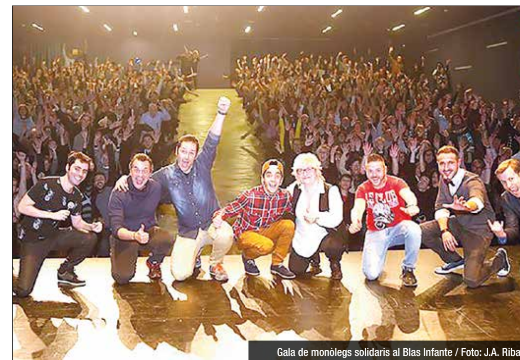
Gala de monòlegs solidaris al Blas Infante