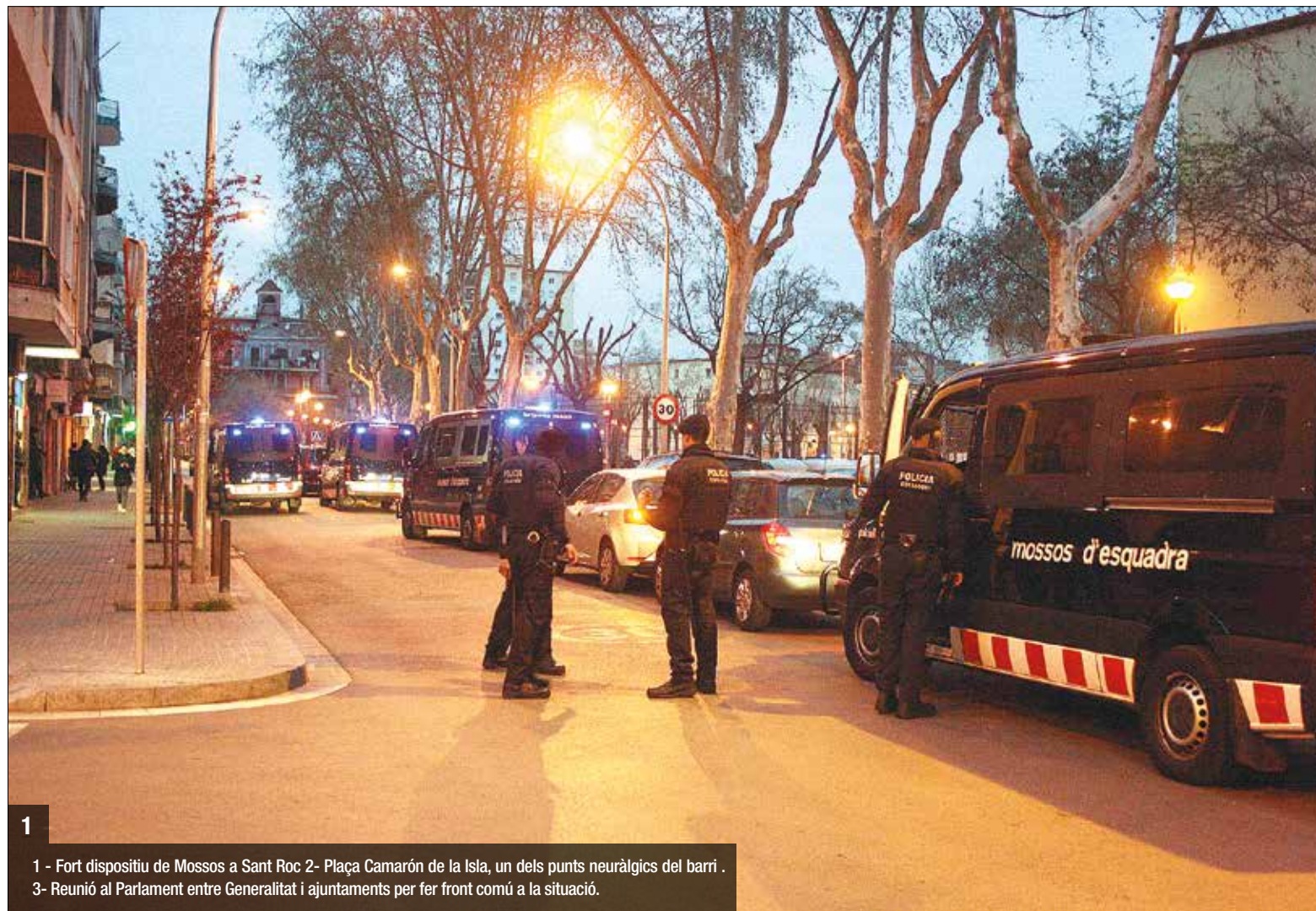
1 - Fort dispositiu de Mossos a Sant Roc 2- Plaça Camarón de la Isla, un dels punts neuràlgics del barri. 3- Reunió al Parlament entre Generalitat i ajuntaments per fer front comú a la situació.

neguit i la incertesa, encara que en tot moment es tracta de familiars llunyanos, cosins de segona generació, com a màxim. "Estem en perill però ja portem quasi dos mesos fora de casa, dormint en cotxes, pisos 'patada' buits, passant gana... volem quedar-nos", lamentava el cap de setmana del seu retorn una de les persones que va haver de marxar i que el passat dia 20 posava en comú la seva indignació amb prop de 100 veïns i afectats més. Centenars de persones porten setmanes vivint lluny de Sant Roc i La Mina, sense recursos i ajudes, sense sostre propi, amb menors que no han pogut anar a escola; han hagut de deixar de costat els seus negocis sobtadament i han perdut llocs de treball.