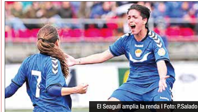
El Seagull amplia la renda