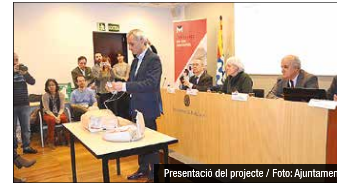
Presentació del projecte

Badalona ha impulsat un pla per convertir-se en una ciutat cardioprottegida, amb un total de 26 farmàcies equipades amb desfibril·ladors automàtics distribuïdes estratègicament per tots els districtes. Es tracta d'una iniciativa públic-privada, engegada per l'Ajuntament, l'Associació Barcelona Salut (ABS) i la farmacèutica Grupo Menarini, una de les principals empreses amb seu a la ciutat. Els aparells repartits pels 26 establiments són