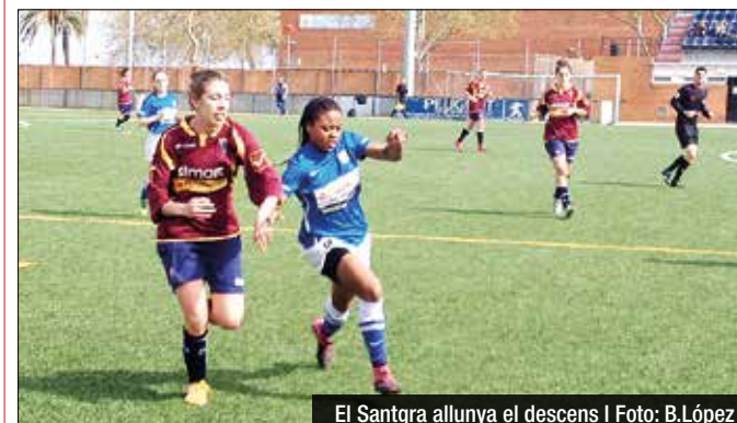
El Santgra allunya el descens