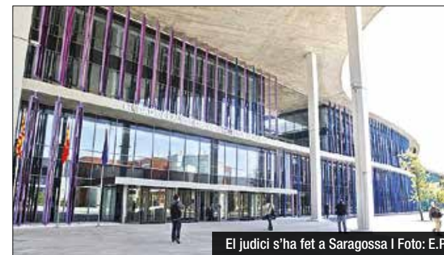
El judici s'ha fet a Saragossa