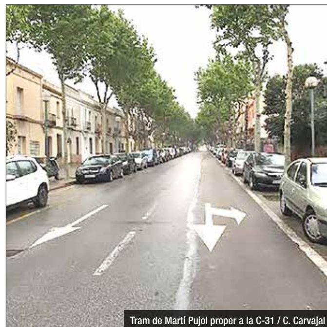
Tram de Martí Pujol proper a la C-31 / C. Carvajal

l'avinguda Martí Pujol, a tocar amb l'autopista i Ca l'Andal. En aquest punt, on els cotxes aparquen a qualsevol racó, fa temps que es reivindica un pas de vianants per travessar tot el sector.