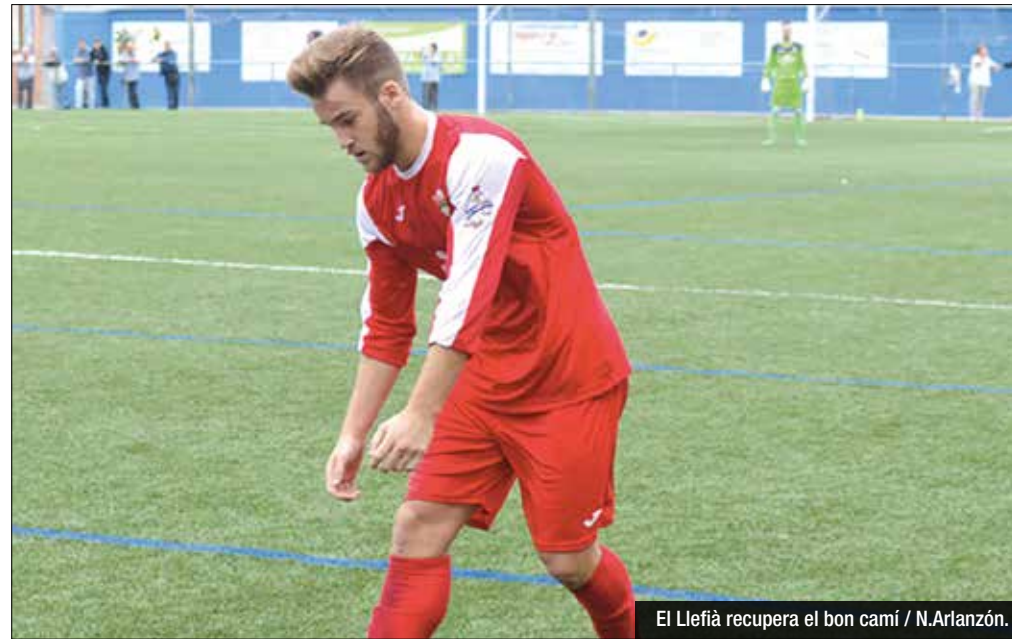
El Llefià recupera el bon camí / N.Arlanzón.

Doble triomf badaloní al grup II de Segona Catalana