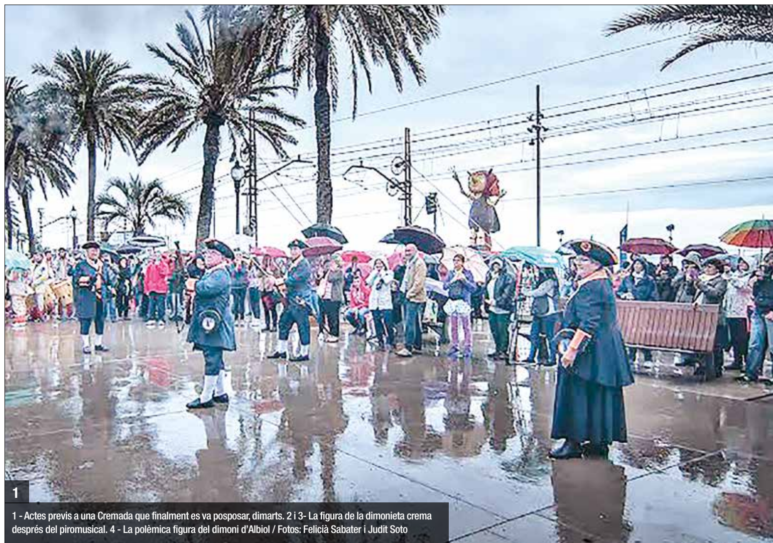
1 - Actes previs a una Cremada que finalment es va posposar, dimarts. 2 i 3 - La figura de la dimonieta crema després del piromusical. 4 - La polèmica figura del dimoni d'Albiol

Amb motiu de les festes, i sobretot la nit de la Cremada, TUSGSAL havia habilitat un servei especial que reforçava les línies d'autobús que connecten el Centre amb aquells barris als que no arriba el metro. Tant a l'anada com a la tornada de l'acte central de les Festes de Maig, el servei va ser reeixit i efectiu i diferents ciutadans van mostrar la seva satisfacció a les xarxes socials.