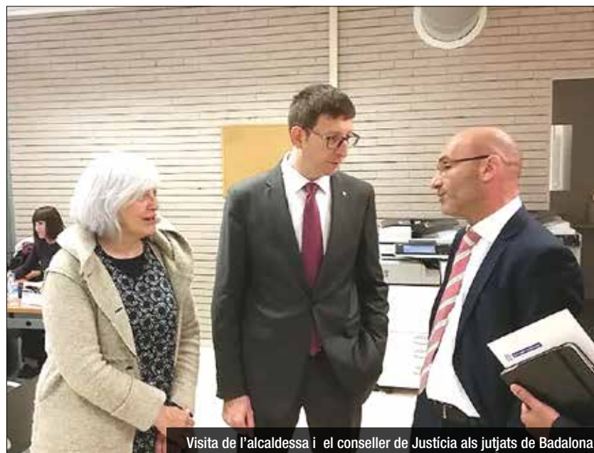
Visita de l'alcalde i el conseller de Justícia als jutjats de Badalona

"A més, a finals de 2016 començaran les obres per condicionar l'edifici dels jutjats de Prim amb una inversió addicional d'1.900.000 euros i que serviran per renovar la climatització de l'edifici i les mesures de seguretat, així com per millorar les condicions de treball del personal i els nivells de comoditat dels usuaris de l'edifici. En total s'hauran invertit a Badalona en dos anys un total de 2.600.000 euros", ha afegit.