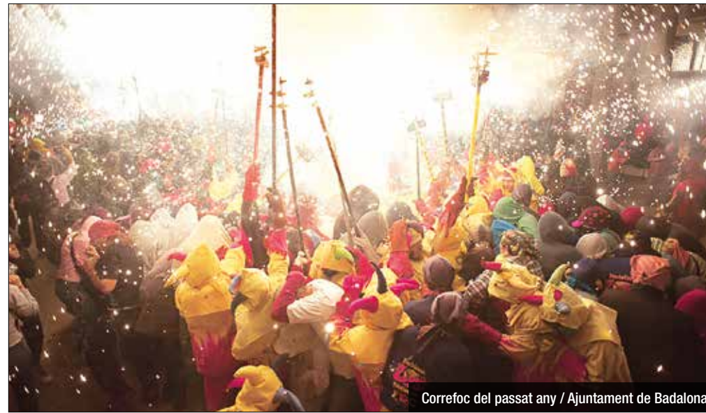
Correfoc del passat any / Ajuntament de Badalona

Coordinat pels Diables de Badalona, hi participaran Badalona Bèsties de Foc, Bufons del Foc, Kapaoltis de Llefià i Ball de Diables d'Igualada.