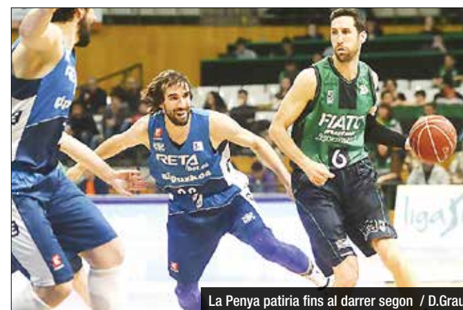
La Peña patiria fins al darrer segon

Llompert (5), Jordi Grimau (21), Landry (21), Vrkic (11), Doblas (10) - cinc inicial- Agbelese (8), Soluade (-), Otegui (6), Maiza (4) i Oroz (2).