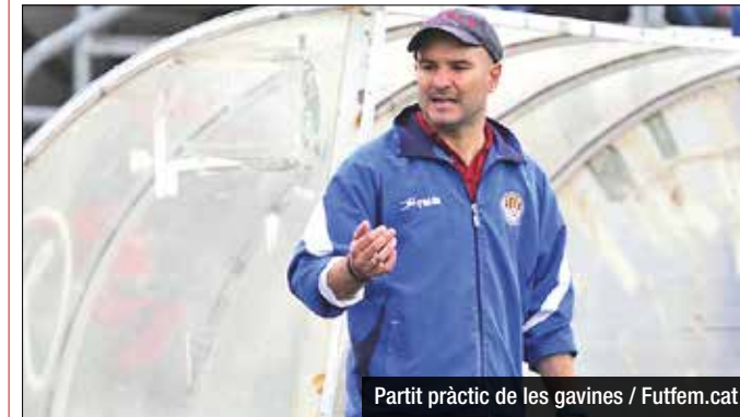
Partit pràctic de les gavines