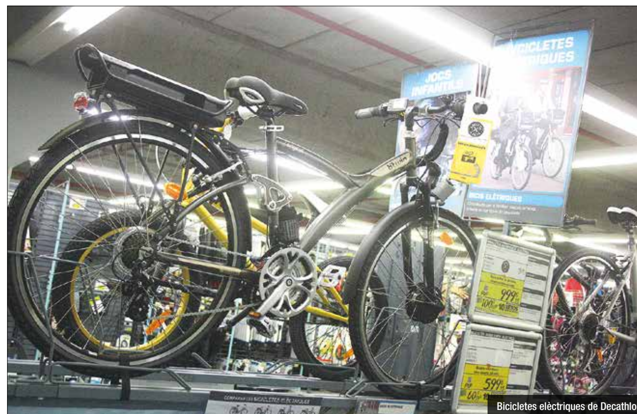
Bicicletes elèctriques de Decathlon

L'entitat supramunicipal ofereix 250€ a les primeres 1.000 compres a la metròpolis