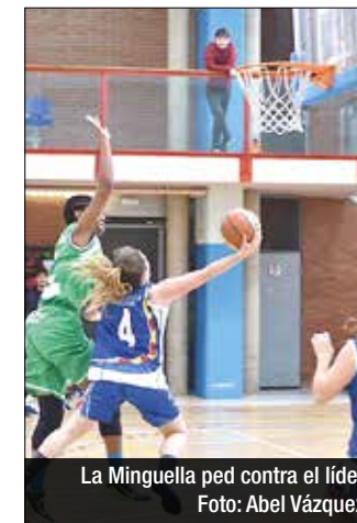
La Minguella ped contra el líder

En categories femenines es juga aquest cap de setmana l'últim partit de la fase regular