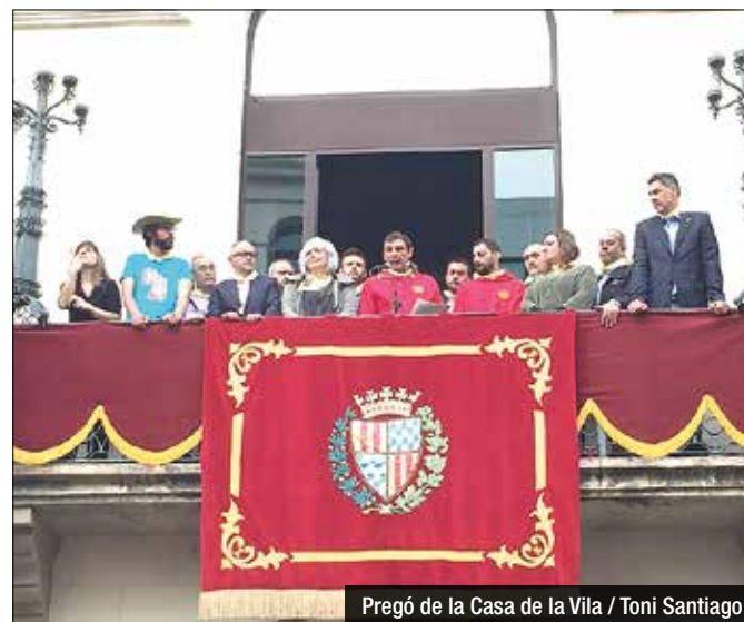
Pregó de la Casa de la Vila / Toni Santiago

La plaça de la Vila va viure moments de solidaritat amb llargs i intensos aplaudiments en suport als refugiats i als socorristes que s'hi juguen la vida, i no missatges de protestes ciutadanes com altres ocasions. També, la plaça va rebre menys afluència respecte anys anteriors, però tot i així es van congrega centenars i centenars de veïns per gaudir del primer de les Festes de Maig. Al discurs de Proactiva Open Arms li van seguir actes festius com el ball de Miquellets, el pilar de 4 dels Micacos posant el mocador a Sant Anastasi, les danses de Maig de l'Esbart Sant Jordi i el concert d'Always Drinking Marching Band que va fer ballar a tota la plaça i encetar la Nit del Mono pels carrers del Progrés, del Centre i Casagemes.