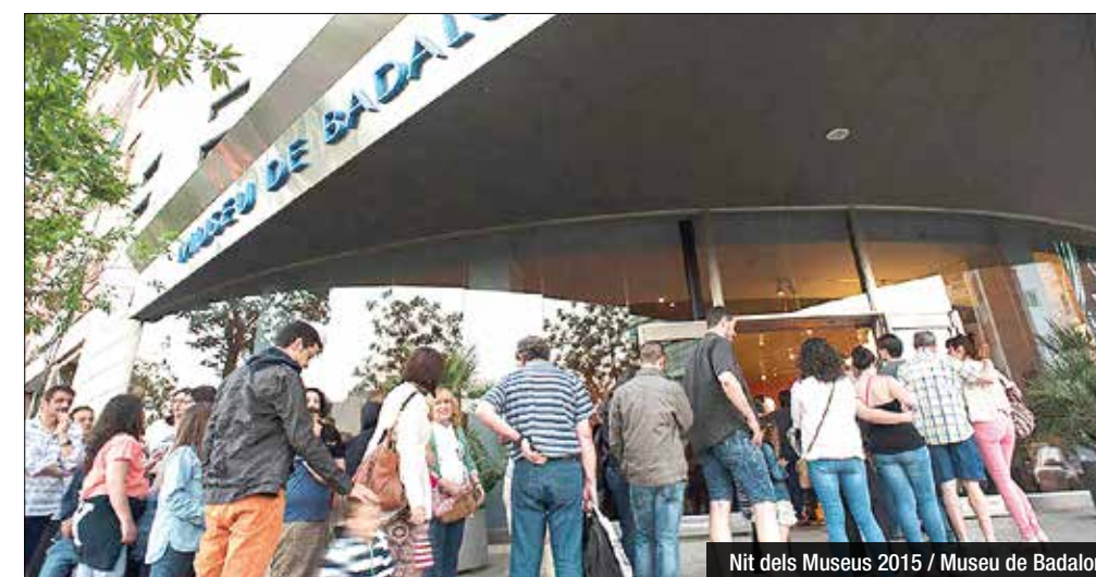
Nit dels Museus 2015 / Museu de Badalona

El Museu obrirà dissabte fins a la 1 de la matinada