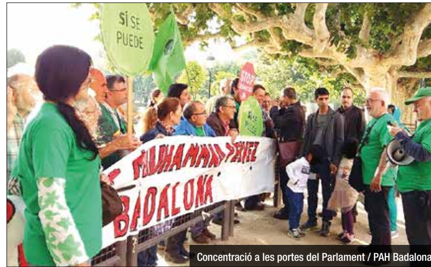
Concentració a les portes del Parlament