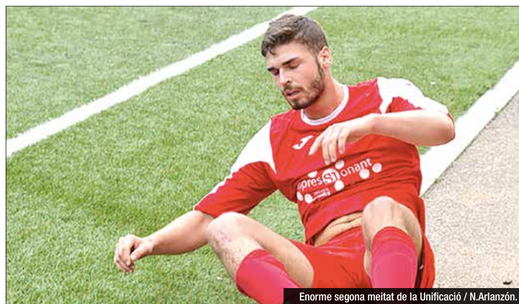
Enorme segona meitat de la Unificació / N.Arlanzón.

Cap de setmana rodó al grup II de Segona Catalana