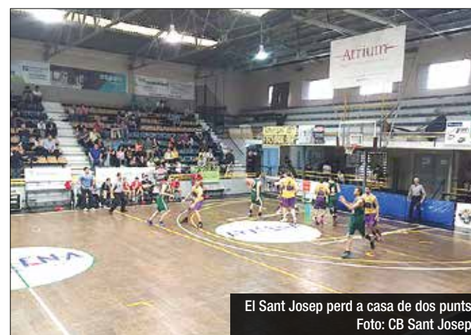
El Sant Josep perd a casa de dos punts

A Segona, l'Ademar ha de remuntar 12 punts i el Llefià ha de guanyar els dos partits