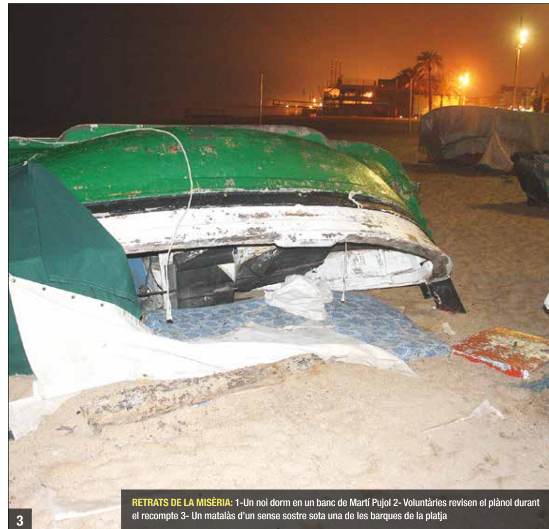
RETRATS DE LA MISÈRIA: 1-Un noi dorm en un banc de Martí Pujol 2-Voluntàries revisen el plànol durant el recompte 3- Un matalàs d'un sense sostre sota una de les barques de la platja