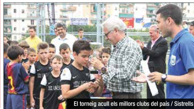
El torneig acull els millors clubs del país

futbolístiques amb altres entitats com el CF Sistrells, equip organitzador, el Bon Pastor, el Mercantil, el Vilanova, el Jàbac Terrassa, el Tecsoccer, el Can Tries, el Bufalà, el Sant Andreu, el Terrassa, el Poma, el Reus, l'Horta, el Getafe, el Pere Gol, el Bonaire, el Granollers i el Martinenc. La competició, presentada de forma oficial a la botiga Benitosports de la Maquinista, es jugarà al camp de Sistrells i consistirà d'una fase de grups classificatòria per la ronda de vuitens.