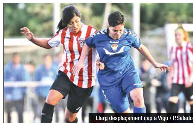
Llarg desplaçament cap a Vigo

de Vigo, escenari que compta amb una tribuna coberta per a prop de 500 localitats. La tornada es disputarà a Montigalà el 5 de juny. Cal destacar que el FPR El Olivo ha estat el gran dominador del seu grup, sumant 65 punts de 72 possibles (21 triomfs, 2 empats i 1 derrota). Les gallegues, a més, han marcat 113 gols a la lliga i a casa acrediten una mitjana de 5.5 dianes per partit. El viatge, però, és el que més preocupa Ferrón.