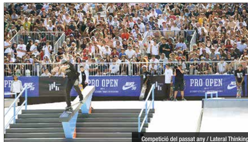
Competició del passat any / Lateral Thinking

disciplina. La European Series, per la seva banda, ofereix a skaters professionals i amateurs una plataforma de competició a quatre ciutats europees. L'esdeveniment es podrà veure en streaming al web www.streetleague.com i per les cadenes de televisió nord-americanes FS1 i FOX Sports GO. Les següents parades del NIKE SB SLS World Tour seran Munich (2 juliol), New Jersey (28 agost) i la final, el Nike SB Super Crown World Championship, a Los Angeles (2 octubre).