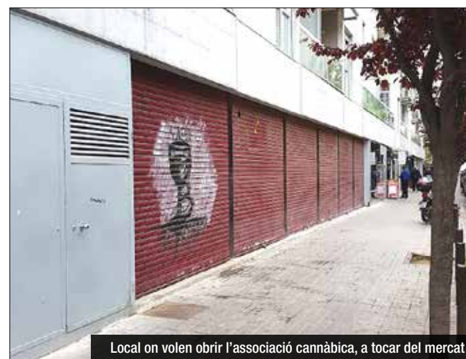
Local on volen obrir l'associació cannàbica, a tocar del mercat