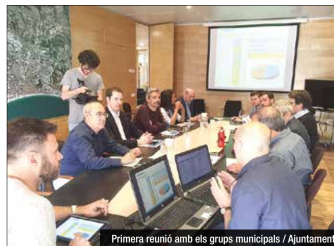
Primera reunió amb els grups municipals

El govern de Badalona invertirà prop de 50 milions d'euros en actuacions de tota mena arreu de la ciutat fins a final de mandat, l'any 2019. Aquesta serà la gran xifra del pressupost d'inversions per als propers tres cursos, que es podrà amassar en base als crèdits bancaris que demanarà l'Ajuntament, uns 30 milions, i les aportacions de les institucions supramunicipals, bàsicament AMB i Diputació de Barcelona. L'executiu ha presentat aquest dimarts la primera fase d'aquesta injecció de recursos, sota el nom de 'Pla Recupera', que destinarà 18 milions a la reparació i rehabilitació de l'espai públic de la ciutat. Es tracta d'aquelles actuacions, més d'una vuitantena, de caire urgent i necessari que no deixen lloc a la participació, com poden ser la recuperació de carrers, plaers, enllumenat o renovació del