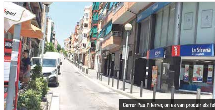
Carrer Pau Piferrer, on es van produir els fets

El veí de La Salut va ser portat a urgències