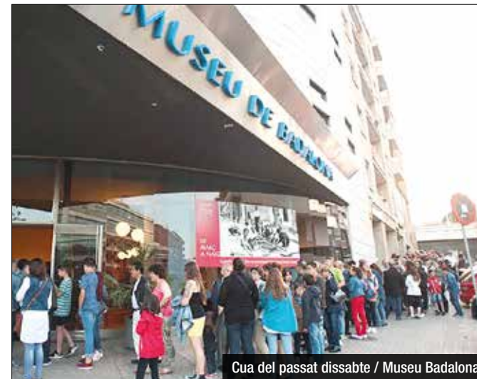
Cua del passat dissabte / Museu Badalona

5.700 persones van visitar aquest dissabte 21 el Museu de Badalona durant la Nit dels Museus, que va començar a les 19 hores i es va allargar fins a la 1 de la matinada. La major part dels visitants eren de Badalona, tot i que també n'hi van haver que procedien de Barcelona i d'altres poblacions del Barcelonès, el Maresme i el Vallès. Les xifres definitives de visitants mostren que aquest any han passat pel Museu de Badalona durant la Nit dels Museus un total de 1.700 persones més que les que ho van fer l'any passat durant la mateixa ocasió. Durant la jornada de portes obertes, el públic va poder veure de manera gratuïta tots els espais museïtzats. En diferents punts del jaciment romà, els visitants es van trobar ambientacions amb personatges que recreaven alguns aspectes de la vida quotidiana a Baetulo.