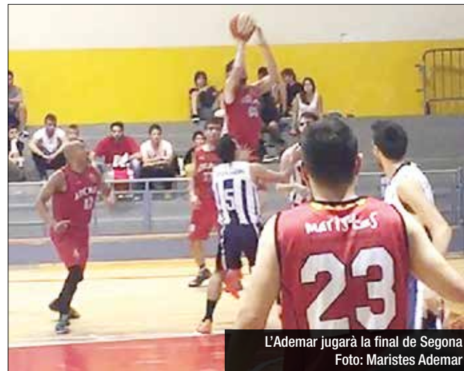
L'Ademar jugarà la final de Segona

El Badalonès haurà de remuntar 18 punts i l'Ademar jugarà la Final de Segona