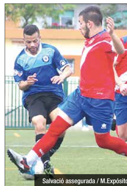
Salvació assegurada

El campió avança a la Copa (6-3) Per últim, a la Copa Catalunya Amateur, l'AE La Salut Pere Gol debutaria amb èxit en l'última competició de la temporada. Els verds