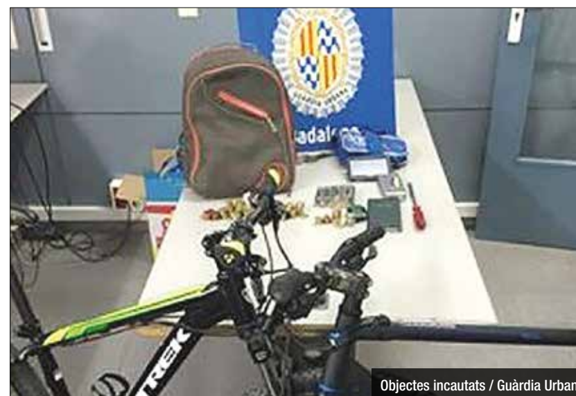
Objectes incautats / Guàrdia Urbana

en monedes, presumptament sostrets de l'interior de vehicles, així com dues bicicletes de les quals no han pogut acreditar la seva procedència. S'investiga si els detinguts podrien tenir relació amb un augment de robatoris en vehicles, en concret en taxis, ocorreguts en els últims dies en altres pàrquings propers al lloc dels fets. Dos agents de Guàrdia Urbana van resultar ferits lleus, atès que els presumptes lladres es van resistir.