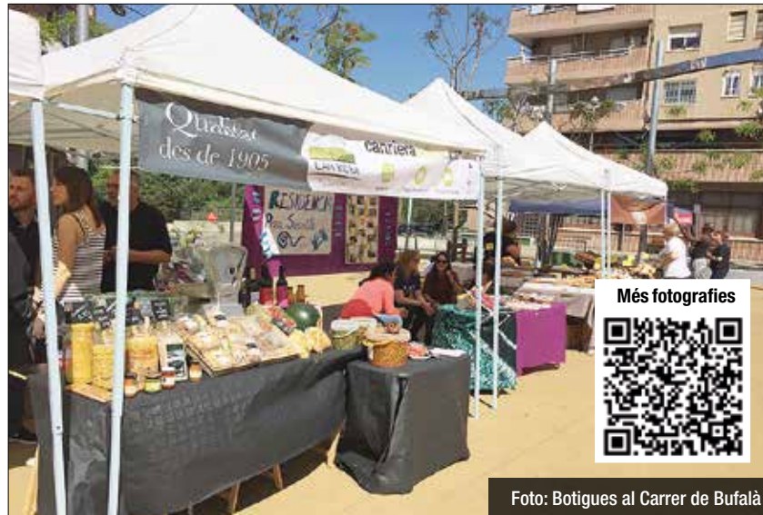
Foto: Botigues al Carrer de Bufalà

D'altra banda, aquest divendres, 28 de maig, el barri de Montigalà enceten les seves festes, que enguany arriben a la 22a edició de la mà de l'associació de veïns. La coral Mas Gopel serà l'encarregada de donar el tret d'inici des del parc de les Muntanyetes a les 9 del vespre. Les activitats esportives, com el 19è Torneig de Petanca -9h-, la 3a Pedalada Popular -9.30h- i la Caminada Popular -11h-, centren la programació del dissabte. Mentre que el dinar -14h-, la gimcana -17h- i el fi de festa amb samba -18.30h-, posara el punt final a les festes de Montigalà el diumenge 29 de maig.