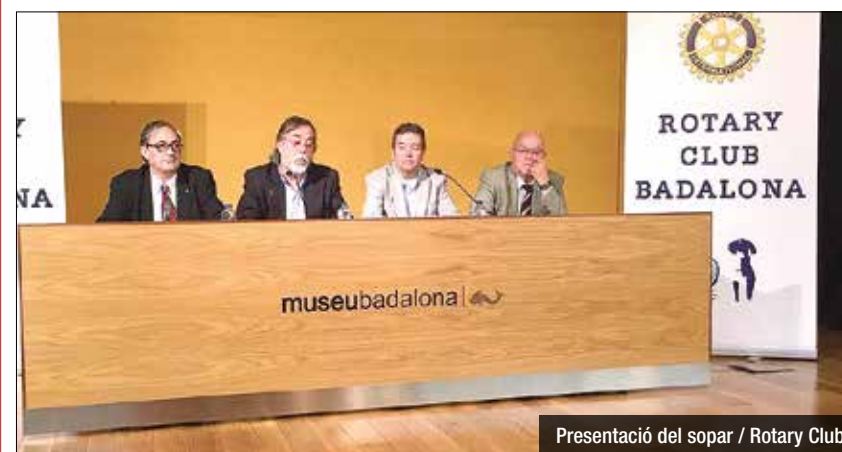
Presentació del sopar / Rotary Club

El sopar de Paul Harris d'enguany, un esdeveniment organitzat pel Rotary Club de Badalona, destinarà la seva recaptació a la investigació de l'Institut de Recerca contra la Leucèmia Josep Carreras, al campus Germans Trias i Pujol de Badalona. Cada any, recordem, l'entitat impulsa aquesta cita solidària que té per objectiu, a més d'enfortir els lligams del propi club, ajudar a una iniciativa solidària. Aquest 2016, el projecte escollit és la creació de la col·lecció de mos-