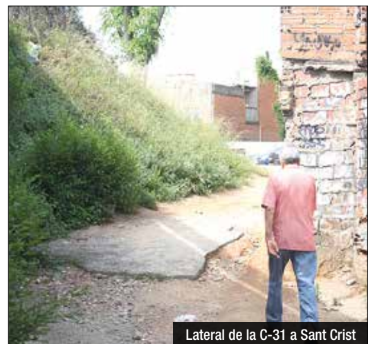
Lateral de la C-31 a Sant Crist