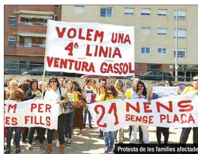
Protesta de les famílies afectades