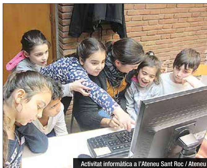
Activitat informàtica a l'Ateneu Sant Roc / Ateneu

comunicat. La manca d'una connexió estable i de velocitat mitjanament significativa és essencial per a alguns projectes socials com els que duu a terme la Fundació Ateneu Sant Roc, que forma els veïns en l'ús d'ordinadors i noves tecnologies i ofereix aules d'estudi