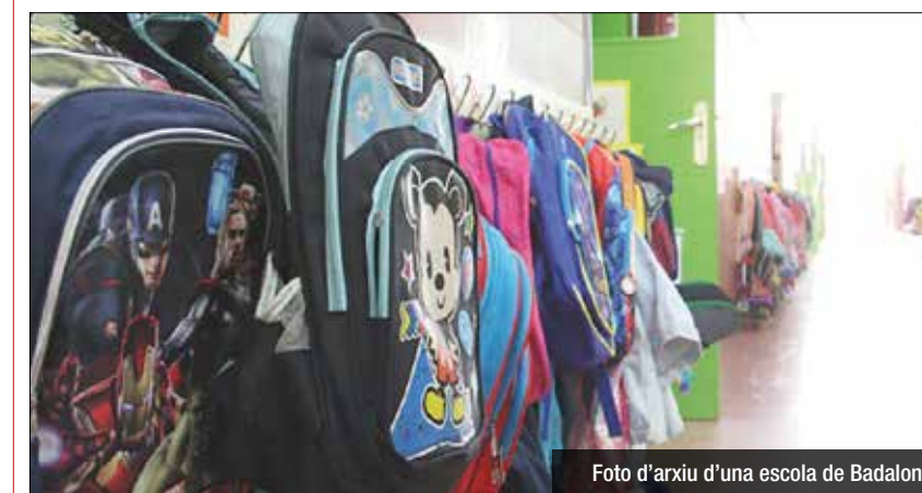
Foto d'arxiu d'una escola de Badalona

la menor després de detectar un canvi en la seva conducta al col·legi. Els pares van posar en coneixement de la Guàrdia Urbana tota la informació facilitada pel col·legi. A partir d'aquest moment es va iniciar la investigació per part de la Policia Local i es va instruir el corresponent atestat policial, que es va remetre al Jutjat informant de totes les circumstàncies que envoltaven el cas. Finalment, el Jutjat d'Instrucció de Guàrdia ha decretat la presó provisional de l'autor, que s'enfronta a una petició per part del Ministeri Fiscal de 12 anys de presó.