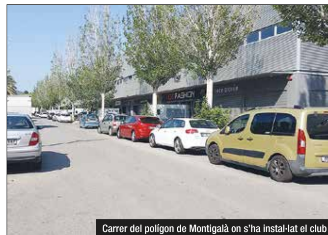
Carrer del polígon de Montigalà on s'ha instal·lat el club

Morning ubicava la seva seu a Vilassar, d'on va haver de marxar. De fet, aquest diumenge celebren el seu primer aniversari amb una festa especial. Pel que fa a les sessions, afirmen que es tracta d'una associació privada i tancada al públic on només poden accedir socis. En aquest sentit, asseguren ser curiosos amb els sorolls i la