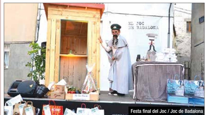
Festa final del Joc / Joc de Badalona

al Joc, -i fins i tot gent que no ha jugat-, també s'apunten a la pregunta-gimcana que sol acabar en algun espai públic de la ciutat, pels volts de la una, amb un cremat i coca pels assistents. El divendres, 10 de juny, la plaça de la Constitució acollirà una nova edició de la festa final del Joc de Badalona amb l'entrega de premis. Aquest any el guanyador s'endurà un viatge a Roma genètica de Viatges Aeroclub.