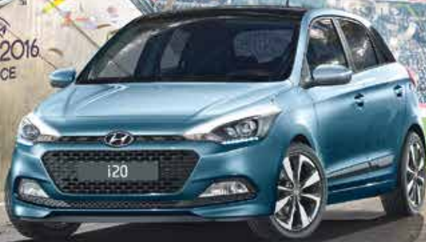
Sèrie GO! i20