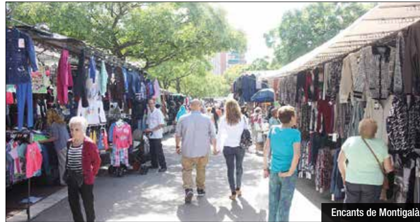
Encants de Montgalà