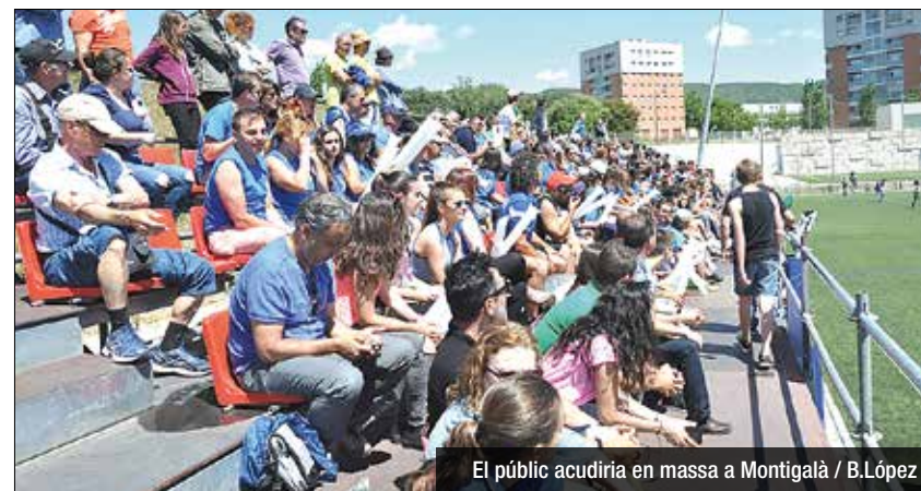
El públic acudiria en massa a Montigalà