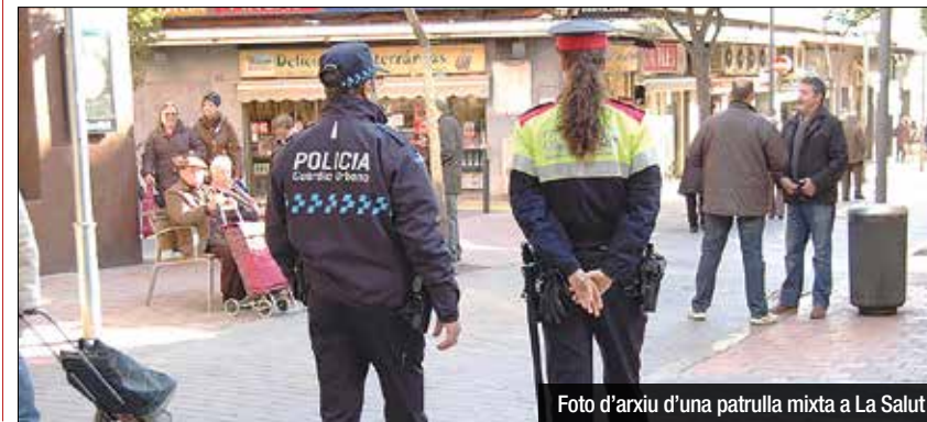
Foto d'arxiu d'una patrulla mixta a La Salut

al barri, una acció que també es durà a terme des de la pròpia Guàrdia Urbana. El reforç, que, segons fonts municipals, ja és una realitat aquests dies, es materialitza a través de la iniciativa Tandem entre tots dos cossos. Al marge de la suma d'efectius, els cossos policials, que després de la denúncia del veí agredit ja investiguen el cas, duren a terme altres iniciatives per garantir la seguretat i la convivència al barri. A nivell urbanístic, d'altra banda, l'Ajuntament ja ha renovat i canviat tot l'enllumenat dels carrer Pau Piferrer que no funcionaven.