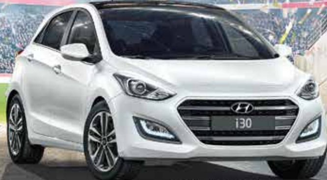
Sèrie GO! i30