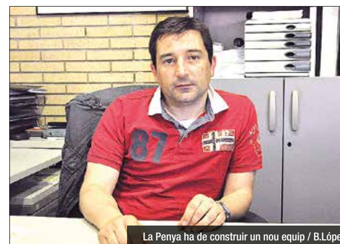
La Penya ha de construir un nou equip

Al director esportiu del FIATC Joventut li espera un estiu mogut i amb molts fronts oberts