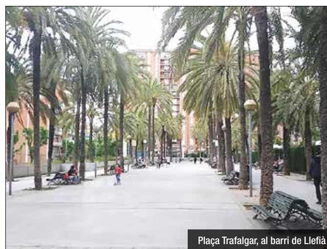
Plaça Trafalgar, al barri de Llefià

terme a través d'Internet, a la pàgina web de l'associació ( http://llefia.org/blog/avvsantantoni/ ), així com de forma presencial. Existeixen quatre punts físics on qualsevol veí pot recollir una enquesta, omplir-la i tornar-la amb la seva opinió, com són el centre cívic de la Torre Mena, la seu veïnal de Sant Antoni, el club de petanca de Trafalgar i un comerç de Pérez Galdós —a la web hi podreu trobar horaris i direccions—. No obstant, la iniciativa, que fins ara ha recollit més de 200 opinions en unes dues setmanes, s'intensificarà amb motiu de les festes del barri i de les celebracions escolars de final de curs. Les entitats implicades faran un treball de camp més extensiu i enquestaran veïns i veïnes a peu de carrer mateix. En un barri d'uns 15.000 habitants, el segon més poblat del municipi per darrera de La Salut,