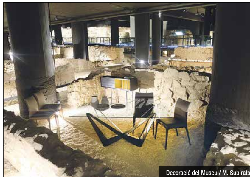
Decoració del Museu / M. Subirats

La mostra ofereix un tastet de la propera edició en un escenari únic i original