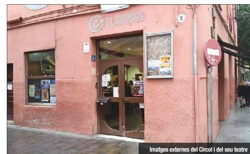
Imatges externes del Círcol i del seu teatre