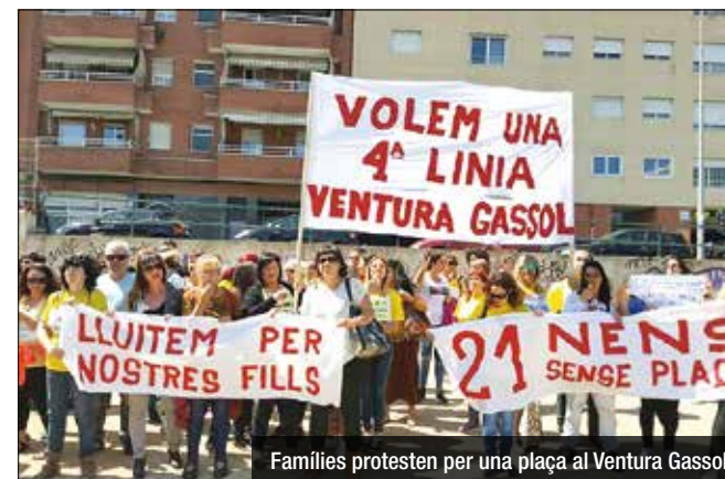
Famílies protesten per una plaça al Ventura Gassol

El barri de Lloreda disposarà el proper curs d'una línia més d'Educació Secundària Obligatoria del que la Generalitat va preveure després de tancar el procés de preinscripció. Serà l'institut Pau Casals el centre al que s'afegirà un grup més per tal de donar cobertura a les peticions de totes les famílies de la zona. No obstant, no es tractarà pas d'una suma global, ja que es des-