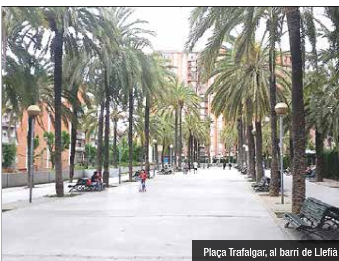
Plaça Trafalgar, al barri de Llefià

càrrec de dues empreses dedicades a experiències similars. Alcaldessa i regidors insisteixen en destacar que es tracta d'una de les consultes d'inversions obertes a la ciutadania més grans de Catalunya.