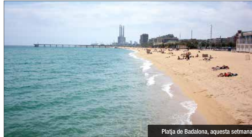
Platja de Badalona, aquesta setmana

platja de l'Estació, d'un espai totalment adaptat i accessible per a qualsevol persona amb diversitat funcional. Enguany, també s'han instal·lat un nou mòdul de lavabo a la platja del Coco, un nou mòdul de lavabo-vestidor a la platja del Pont d'en Botifarreta i la instal·lació de nova senyalització a les platges. D'altra banda, a partir d'aquest dissabte, com cada any, els animals de companyia estaran prohibits portar-los a la platja i la pesca no es podrà practicar entre les 8 i les 20h i de 2 a 5 de la matinada a totes les platges. Durant la temporada de bany, al voltant d'1.500.000 persones utilitzen les platges de Badalona.