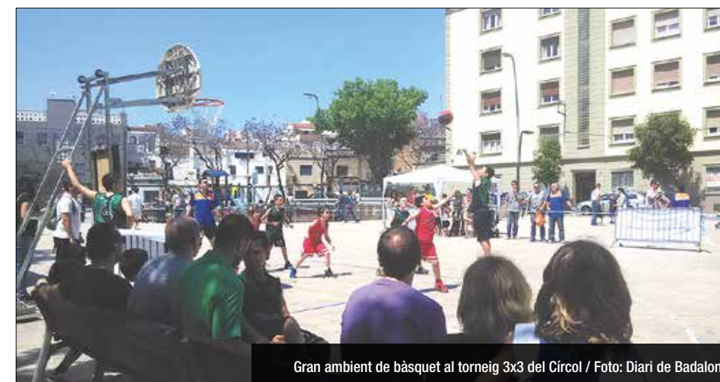
Gran ambient de bàsquet al torneig 3x3 del Círcol

El torneig es vol consolidar com una cita habitual al final de cada temporada