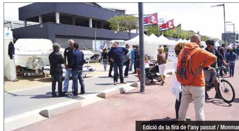
Edició de la fira de l'any passat

d'estands de participació activa. És a dir, s'han organitzat una sèrie de "Reptes" en què és "reptarà" el visitant a realitzar una determinada activitat a l'aigua o en sec, alguna manualitat o qualsevol altre tipus de prova pràctica o mental. Entre els visitants que hagin realitzat tots o algun dels reptes suggerits pels estands, es sortejaran diferents premis que es donaran a conèixer el diumenge 12 de juny, just abans de la clausura del certamen. Paral·lelament, la Fira Inicia't acollirà al seu recinte l'àmplia oferta que actualment hi ha al mercat pel que fa a sortides professionals nàutiques. A més la fira comptarà amb diverses demostracions i tallers pràctics de nusos, de meteorologia, fusteria nàutica, primers auxilis o pesca esportiva, entre d'altres.