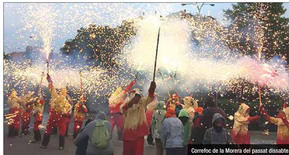
Correfoc de la Morera del passat dissabte

així la sardinada i la revetlla del divendres, la trobada de puntaires pel dissabte i la pella popular i les actuacions musicals del diumenge.