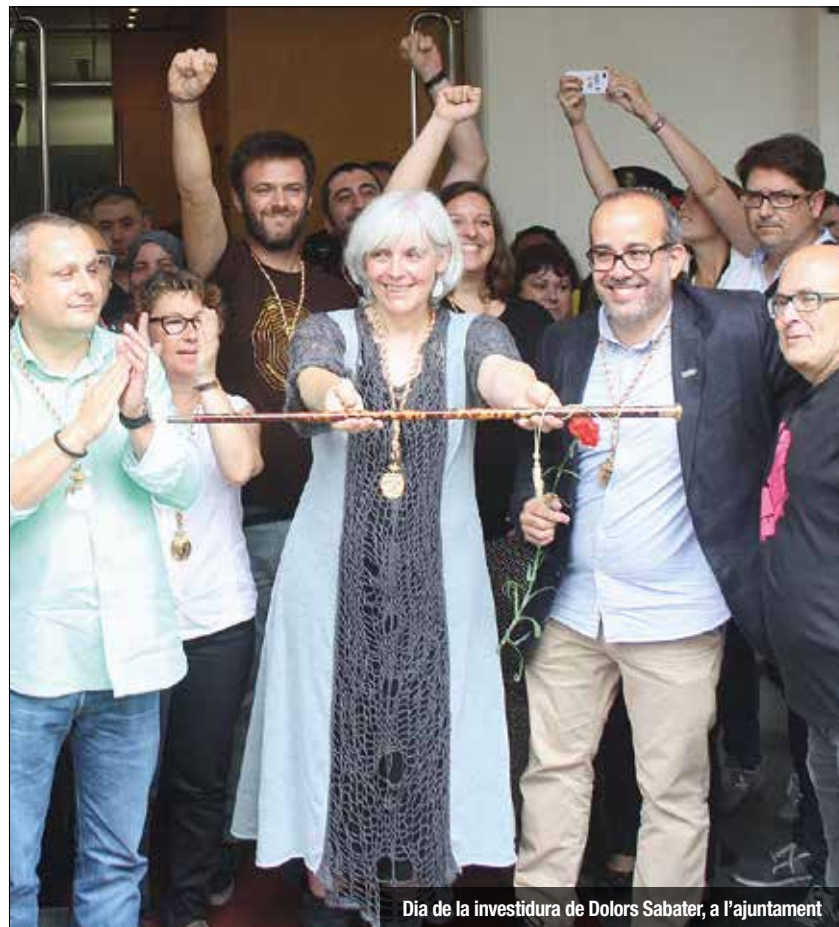
Dia de la investidura de Dolors Sabater, a l'ajuntament

mesos, l'actual executiu ha protagonitzat alts, baixos, polèmiques, enfrontaments i moments molt simbòlics. Des de l'aprovació definitiva dels pressupostos al Ple -i la inicial per Junta de Govern a través de l'RSAL- fins a la controvertida dissolució de la Omega, passant pel final de les 'vaquillas' de Llefià, les tensions amb el Badalona pels retards del nou estadi, l'obertura de la participació o les nombroses 'picabaralles' a les xarxes socials, de vegades protagonitzades per membres de govern o propers al mateix. Reunions, trobades i complicitats teixides amb les localitats veïnes, a l'AMB, a Catalunya i a l'Estat. 12 mesos de mesures complertes i no complertes i de reptes pendents d'un govern que va crear moltes expectatives a les que no ha pogut donar resposta. Almenys de moment.