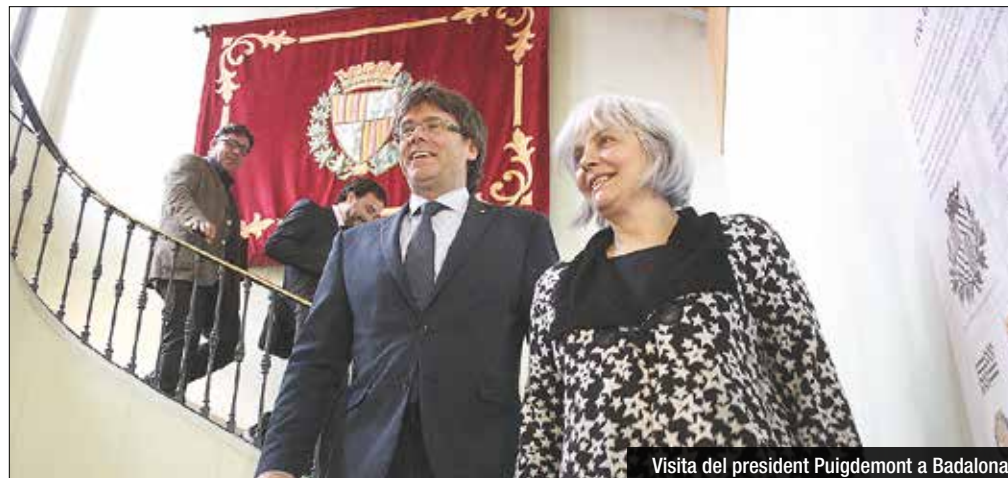
Visita del president Puigdemont a Badalona

la localitat podrà transmetre de forma directa a la Generalitat les seves reivindicacions i necessitats. En principi, la convocatòria de la taula, que també ha demanat L'Hospitalet de Llobregat com a segona ciutat més gran de Catalunya, es podria produir en les properes dues setmanes. A partir d'aquest moment, Badalona tindrà un espai propi i periòdic on intercanviar polítiques amb el govern català.