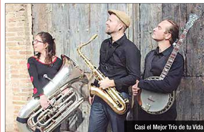
Casi el Mejor Trío de tu Vida

gracia, per un so mestís carregat d'elements del jazz clàssic i de la música dixieland. Les 'Nits d'Estiu del Museu a l'Anís del Mono' consisteixen en una visita a les instal·lacions de l'empresa més emblemàtica de la ciutat. Posteriorment es gaudirà d'un concert a l'aire lliure mentre es pren un refresc