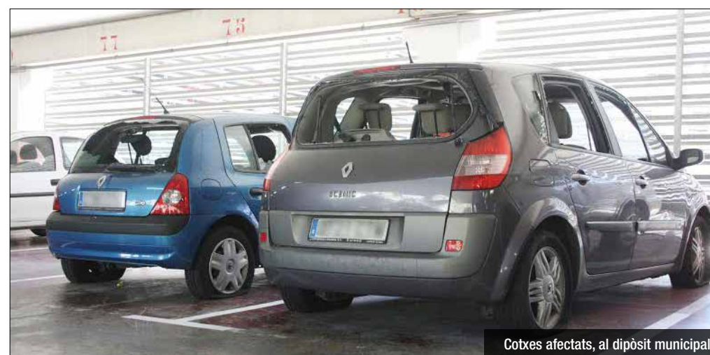
Cotxes afectats, al dipòsit municipal

arma de foc. No obstant, a més de tinença d'armes, el grup va ser interceptat per haver assaltat i atacat tres cotxes. Els tres vehicles, que en principi serien propietat de la família atacant durant el tiroteig, van quedar totalment destrossats i van haver de ser retirats al dipòsit policial. Totes les denunciades i detingudes tindrien vinculació