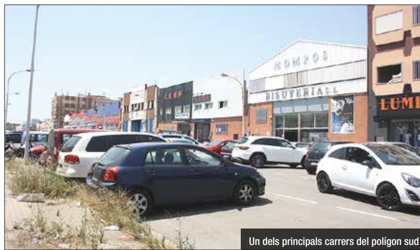
Un dels principals carrers del polígon sud

amb més de 300 punts de tecnologia Led. El total de la inversió d'aquest projecte és de 2.140.987 euros de la qual un 30% serà cobert per l'Ajuntament de Badalona i un 70% per l'Àrea Metropolitana de Barcelona en el marc de la segona convocatòria de subvencions del Programa de millora d'infraestructures i de competitivitat de polígons industrials i àrees d'activitat econòmica de l'AMB. A aquesta inversió se li suma la de dos projectes privats d'eficiència energètica. Els treballs s'executaran durant el 2017, segons ha explicat el regidor de Promoció