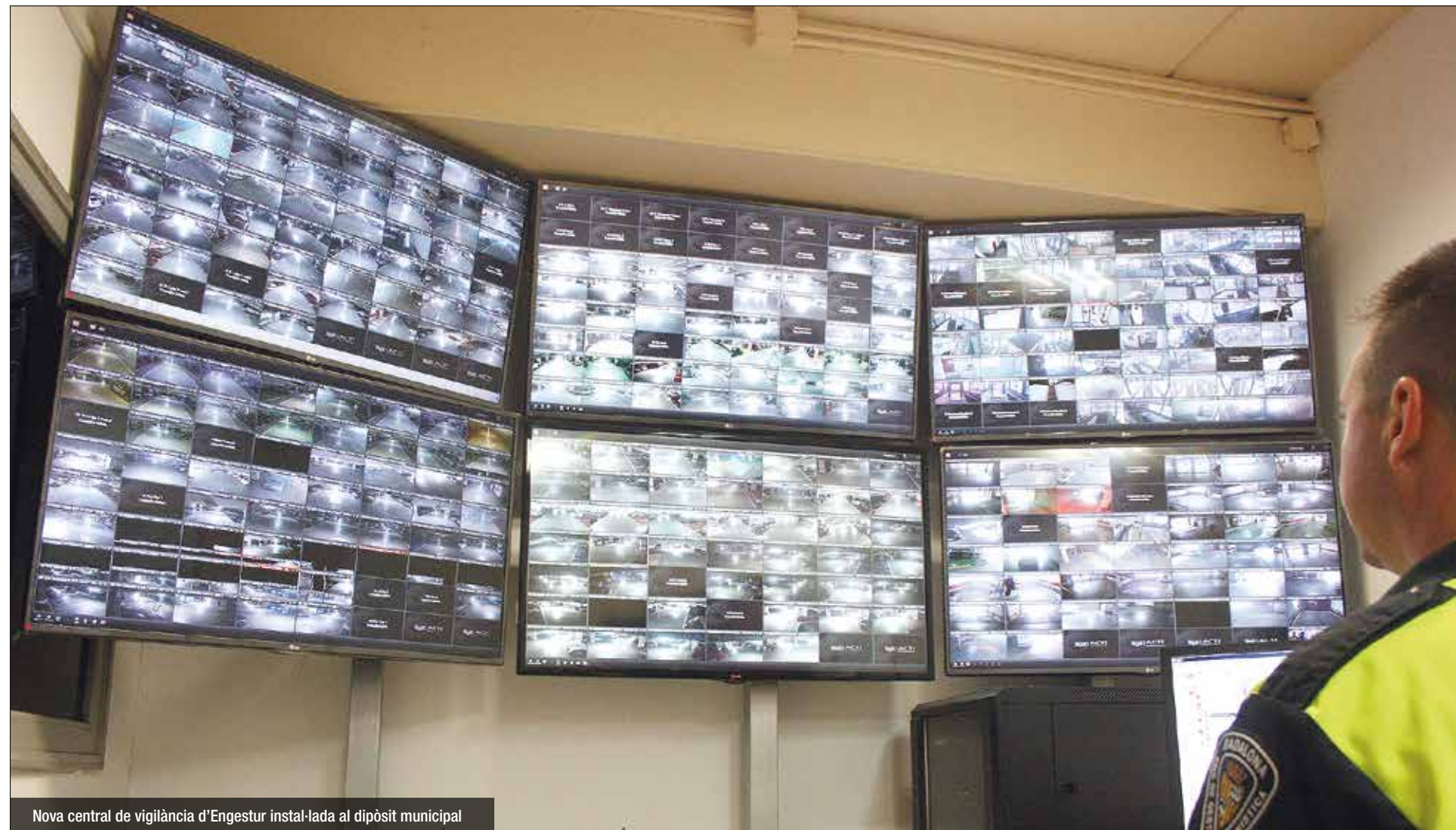
Nova central de vigilància d'Engestur instal·lada al dipòsit municipal

i si està registrat o registrada. Més enllà de tecnologia i recursos tècnics, també s'ha fet un salt quant a personal. La central compta ara amb un mínim de dues persones que sempre es troben fent el servei de vigilància. Fins fa unes setmanes, l'estació de Pompeu Fabra només disposava d'un responsable durant les nits, per exemple, i aquesta persona s'havia d'encarregar de diferents tasques, el que l'impedia poder prestar el 100% d'atenció a les càmeres. "És una millora molt gran; és molt més còmode, complet i el fet de ser dues persones l'allibera i et capacita molt més", apunta un dels nois del personal. Al marge del nou sistema per als 27 pàrquings que Engestur controla arreu de la ciutat, els de Pompeu Fabra i el Viver tenen la seva pròpia central de vigilància i personal 'in situ'.