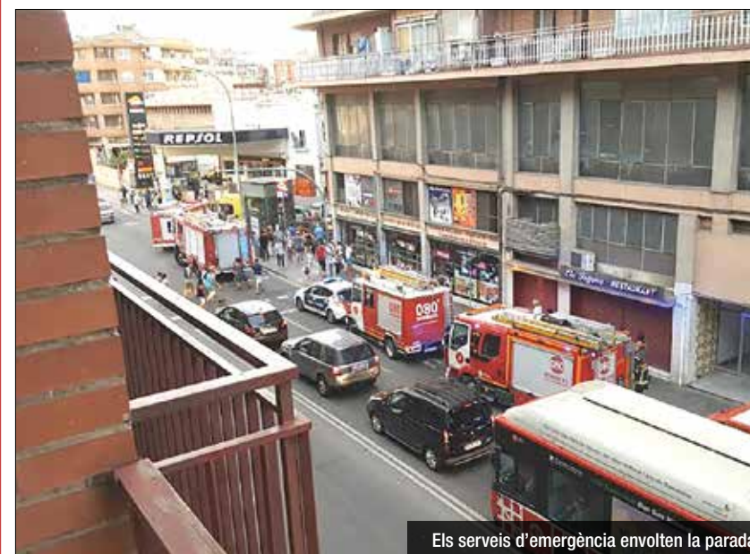
Els serveis d'emergència envolten la parada

estat intencionat o es tracta d'un accident. Els Serveis d'Emergència s'hi van desplaçar ràpidament, juntament amb bombers, Mossos i les policies locals, que van acordar la parada de metro. El SEM va aconseguir atendre l'afectat en un estat molt greu però viu i el va traslladar a l'hospital del Can Ruti, on va ser operat. Aquest dijous havia aconseguit superar les primeres hores crítiques.