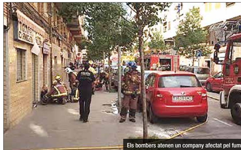
Els bombers atenen un company afectat pel fum

El barri de La Salut es va endur a finals de la passada setmana un petit ensurt arran de l'explosió d'un aparell elèctric en un pis del carrer de Nàpols, a tocar del passeig de La Salut. L'incident va provocar un incendi a l'immoble que va arribar a cremar un pis sencer i a afectar els pisos superiors. Arran dels fets, van resultar ferides lleus quatre persones: dos menors que hi eren al pis; una veïna, menor, del pis superior, que va inhalar fum; i un bomber. Polícies i bom-