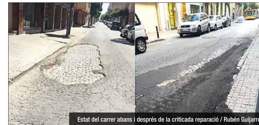
Estat del carrer abans i després de la criticada reparació