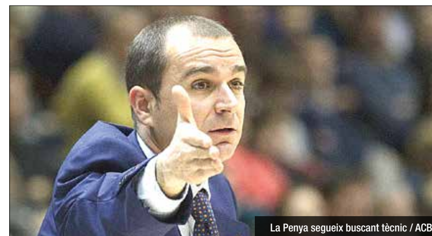
La Penya segueix buscant tècnic