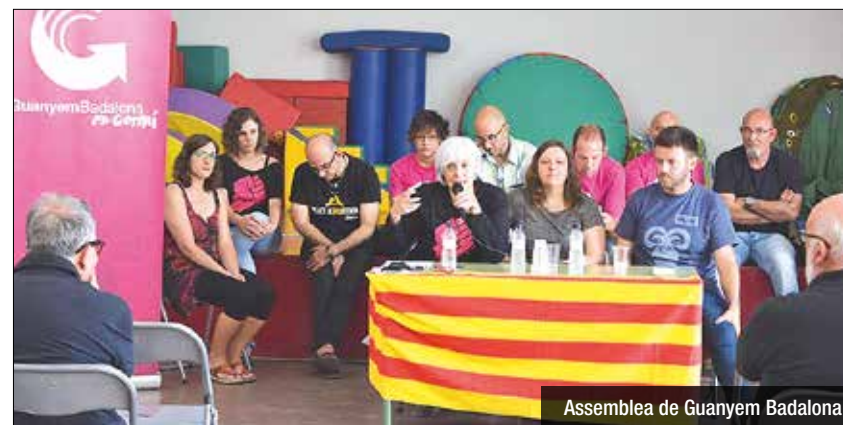
Assemblea de Guanyem Badalona