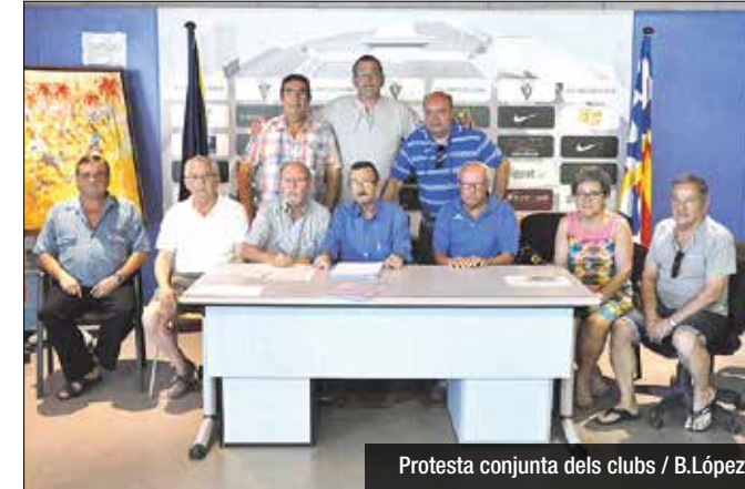
Protesta conjunta dels clubs

Mala il·luminació, extintors caducats, desfibril·ladors inexistents, manteniment deficient i un conveni marc pendent de redacció des de fa més d'un any. Segons ells mateixos manifesten, els clubs de futbol de Badalona estan al límit i han decidit passar a l'acció. Aquesta setmana, representants de la majoria d'entitats de la ciutat convocarien una roda de premsa a Montigalà per donar suport a l'Associació de Clubs de Futbol de Badalona. El Lloreda, el Pere Gol, el Sistrells, el Bufalà, la Unificació Llefià, el CF Badalona i la junta de l'Associació oferirien una demostració d'unitat i tornarien a lamentar les condicions amb les quals han de conviure. La problemàtica, ja existent amb governs anteriors i "agreujada en els últims temps", és ben senzilla: la redacció d'un nou conveni comú que reguli l'activitat futbolística de la