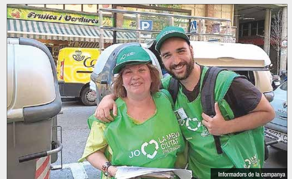
Informadors de la campanya

en compte la realitat de cada municipi. Per exemple, entre les 144 persones es compta amb representants de totes les ètnies, ja que en zones amb xifres d'immigració més elevades, el fet que l'informador i el ciutadà pertanyin a la mateixa cultura ajudarà a aconseguir que el missatge es transmeti de manera més efectiva, i sumarà per a la campanya, a més de cobertura i notorietat, grans nivells d'afinitat.