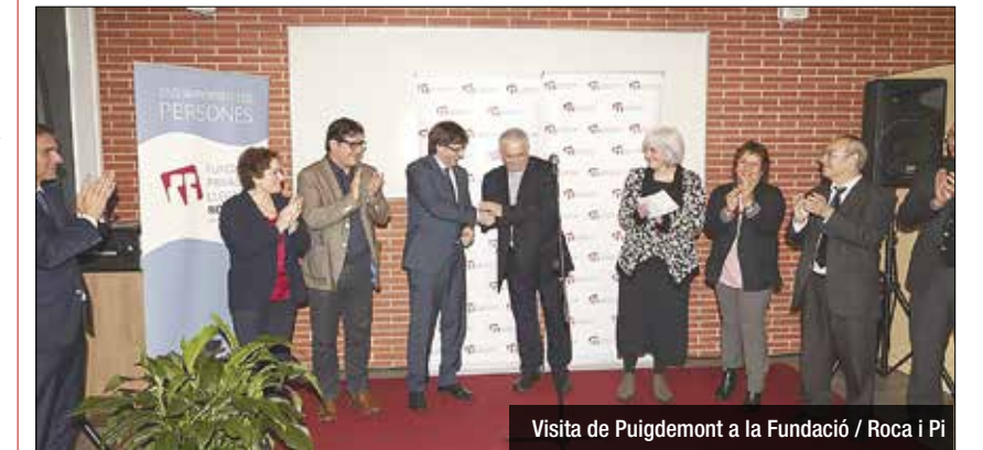
Visita de Puigdemont a la Fundació / Roca i Pi

La Fundació Roca i Pi presenta aquest 15 de juliol la renovació del seu compromís amb 22 entitats de diferents barris del Barcelonès Nord, amb les quals signarà els convenis d'enguany. L'entitat col·labora amb totes elles en diferents activitats adreçades a col·lectius en risc d'exclusió social. L'objectiu és compartir eixos estratègics del pla d'acció de Roca i Pi. Aquesta col·laboració es basa en aportacions econòmiques de la Fundació Roca i Pi a les entitats. La finalitat és reforçar i consolidar la tasca que fan aquestes organitzacions al seu territori o