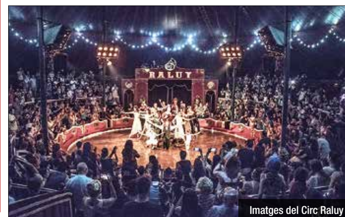
Imatges del Circ Raluy

Des del circ Raluy valoren que ha estat una molt bona experiència i que han marxat molts satisfets per la gran afluència de públic. Asseguren que molts van repetir per veure l'espectacle i d'altres que es van quedar amb la il·lusió de gaudir-ne, per això no perden l'esperança de tornar aviat a Badalona, sense descartar que sigui l'any vinent.