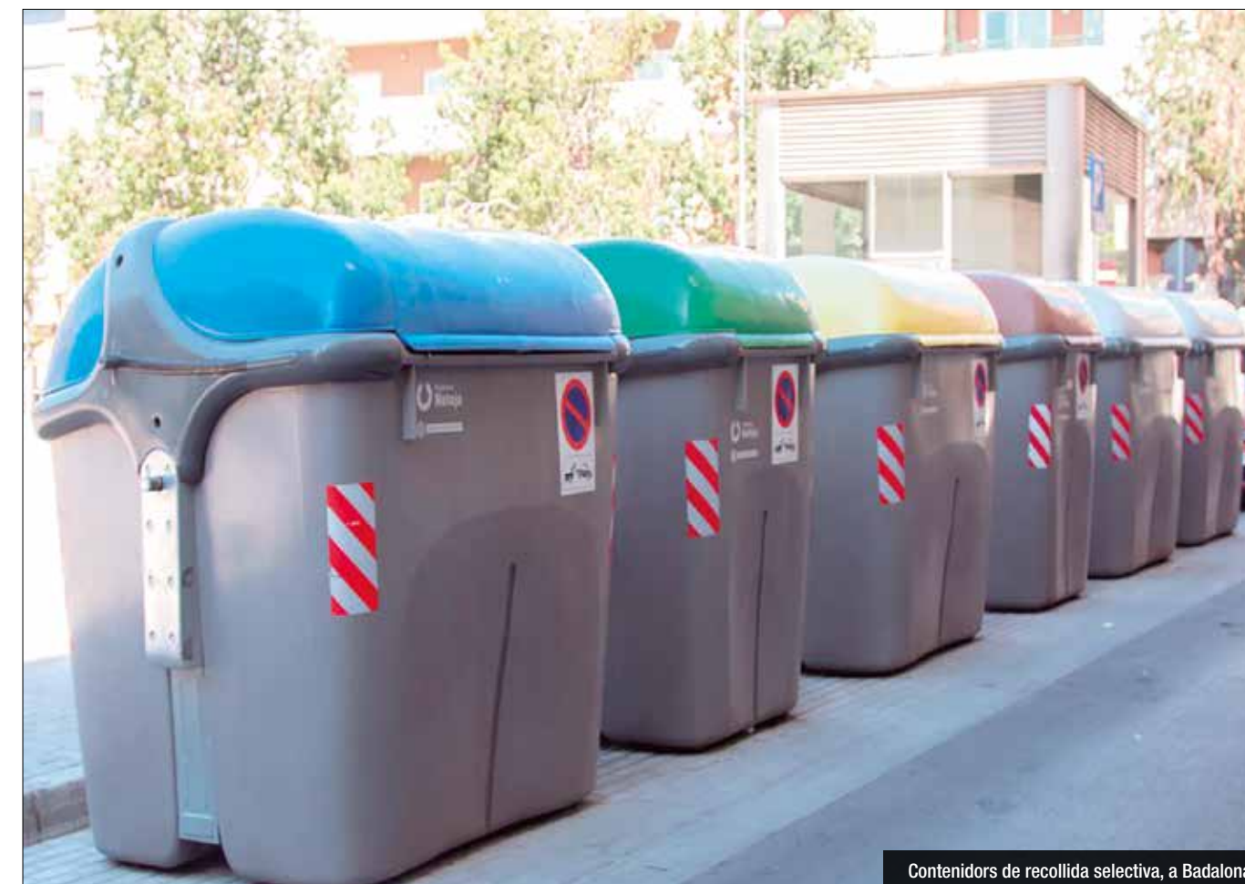
Contenidors de recollida selectiva, a Badalona

Aquest tipus de campanya té diferents antecedents: els anys 2013 i 2014 l'AMB va fer diverses actuacions similars. Entre l'agost del 2013 i el març del 2014, es van col·locar informadors en alguns supermercats de 33 municipis metropolitans, per donar consells sobre la recollida selec-