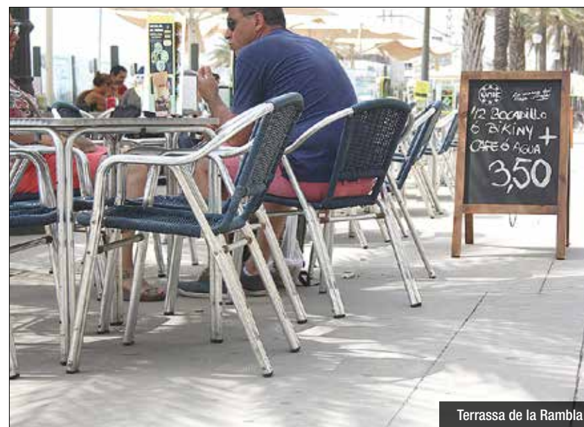
Terrassa de la Rambla

la Rambla, passeig Marítim i carrer de Santa Madrona, tenen un horari especial a la primavera i a l'estiu. Els dies feiners i festius, fins a les 00:30h, i els divendres i dissabtes, fins a les 2 de la matinada.