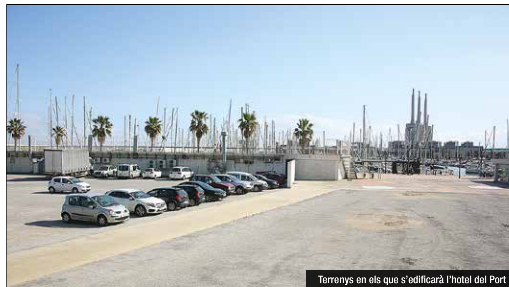
Terrenys en els que s'edificarà l'hotel del Port