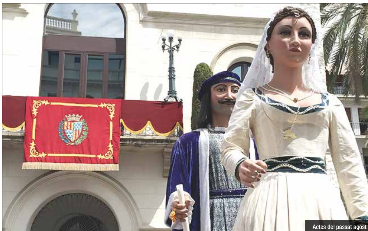
Actes del passat agost

De cara a diumenge, 15 d'agost, no hi farà l'ofici de festa, la ballada de gegants, les sardanes i el tradicional espectacle de foc i bany de les bèsties i diables. La Festa Major d'Agost, com l'any passat, tornarà a organitzar el vermut popular el migdia del 15 d'agost. La festa badalonina clourà amb un concert amb el grup "Els quatre vents".