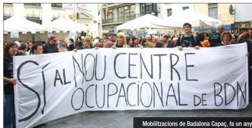
Mobilitzacions de Badalona Capaç, fa un any

La Fundació està convençuda que el projecte tiraria endavant tot i Guanyem