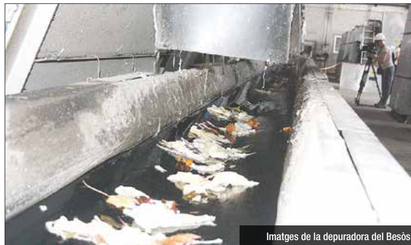
Imatges de la depuradora del Besòs

Més enllà dels residus locals, la costa badalonina acaba rebent la brutícia d'altres municipis de l'entorn més proper, i tot plegat repercuteix molt negativament en el fons marí de Badalona. Això provoca mala qualitat de l'aigua de mar en els dies posteriors a la pluja, així com l'impacte negatiu sobre les comunitats submarines per l'acumulació d'aquest tipus de restes sobre els fons marins. En el cas de Badalona, a més, la flota artesanal de pesca pateix un efecte negatiu molt gran, ja que hi ha dies que les seves xarxes queden plenes d'aquests tipus de material, quedant inservibles, amb el conseqüent impacte econòmic.