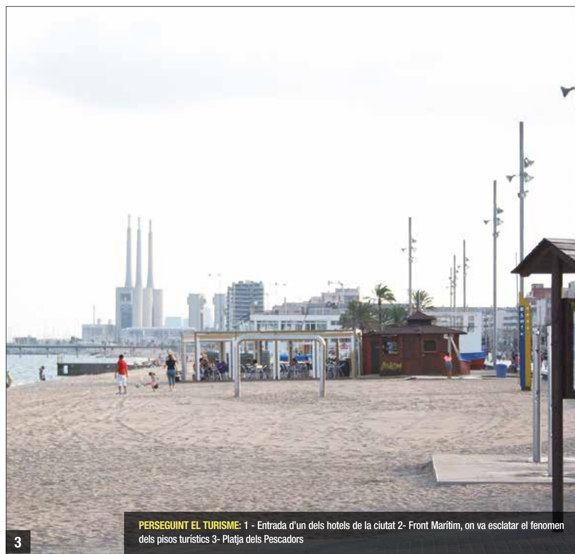
PERSEGUINT EL TURISME: 1 - Entrada d'un dels hotels de la ciutat 2- Front Marítim, on va esclatar el fenomen dels pisos turístics 3- Platja dels Pescadors