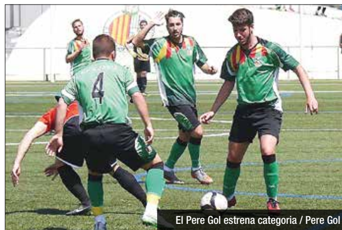
El Pere Gol estrena categoria / Pere Gol