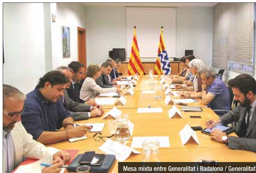
Mesa mixta entre Generalitat i Badalona

A més de l'habitatge, la reunió ha constatat molts altres punts a tractar, com ara el barri de Sant Roc i la nova estratègia social que s'hi