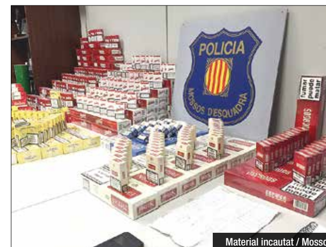
Material incautat

Els Mossos d'Esquadra han desmantellat un punt de venda de tabac de contraban que operava com si es tractés d'un estanc. L'afluència del punt era molt elevada, i és que es van poder comptabilitzar més de 20 compradors en menys d'una hora. Els