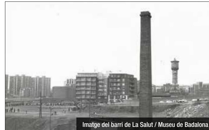
Imatge del barri de La Salut / Museu de Badalona

del 1966 al 1983, acompanyades dels textos que explicaran com era i com es transformava la ciutat.