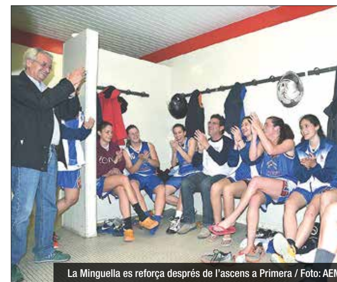
La Minguella es reforça després de l'ascens a Primera