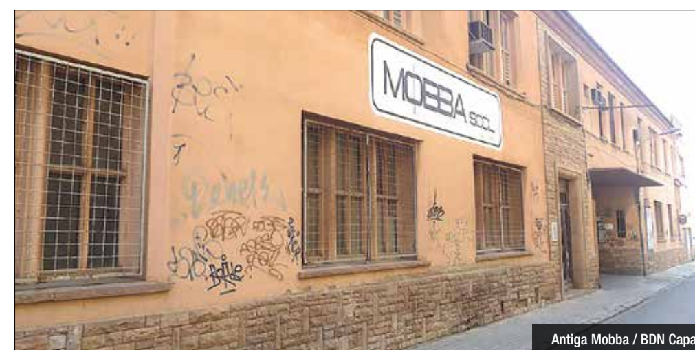
Antiga Mobba

espai -el de la Mobba-, que a dia d'avui està qualificat de zona verda, mentre que pràcticament la totalitat del solar de Morera està destinat a equipament privat, justament el que seria el nou equipament. Per últim, el més probable és que aquesta opció dilatés en el temps l'estrena d'una nova seu, que Badalona Capaç vol tenir enllestida per al 2018. La segona de les propostes alternatives suposaria treballar sobre el projecte ja existent, i es basaria en algunes millores de distribució i mobilitat a l'espai del Turó de l'Enric i els vials d'accés. Sobre el projecte actual, Sabater assegura que estan disposats a acceptar reformes i negociar modificacions, però avisen que si el procés es perllonga, els inversors podrien retirar-se. Membres i pares de la Fundació es manifestaran aquest dia 11 a l'ofrena floral de la Diada.