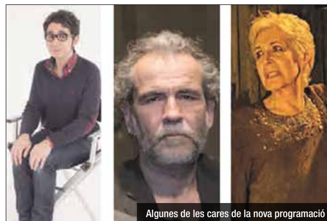
Algunes de les cares de la nova programació

cena. Quatre companyies de teatre amateur de la ciutat s'instal·laran al Teatre Zorrilla per preparar les seves noves produccions. Es tracta de Món Animal, Projecte Ixthys, Teatre a Peu Pla i Katalakaska.