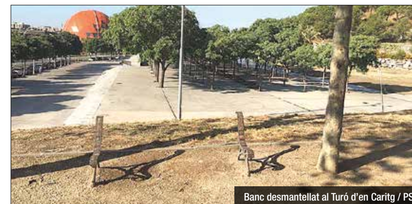
Banc desmantellat al Turó d'en Carítg / PSC

Els socialistes estan elaborant un llistat amb 200 "punts negres" del manteniment