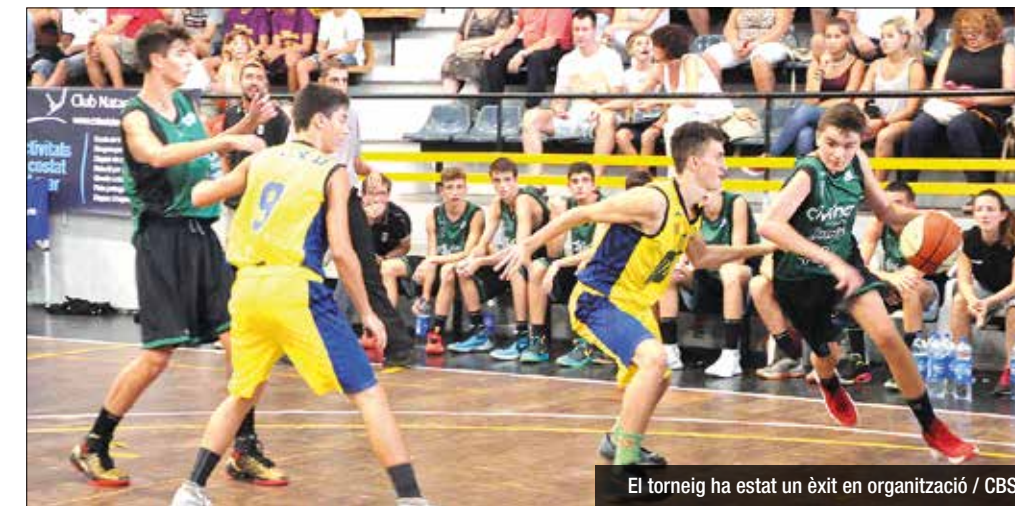
El torneig ha estat un èxit en organització

L'equip parroquial queda cinquè i el Joventut quart