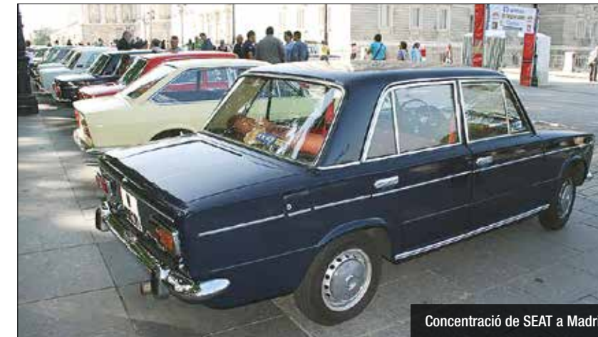
Concentració de SEAT a Madrid

El Port de Badalona retrocedirà en el temps i tornarà unes dècades enrere amb la visita d'uns vehicles ben particulars. L'explanada de l'aparcament de les instal·lacions i la placeta adjunta acolliran la XXI Concentració Nacional de SEAT 1430, 124 i 124 Sport de Barcelona. Uns 180 vehicles d'aquests models estaran exposats des de les 18h fins a les 20h, aproximadament. El pas per Badalona forma part d'una iniciativa que ha re-