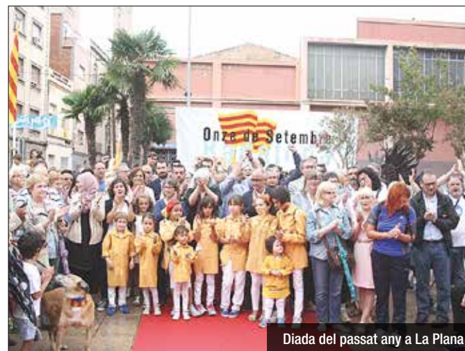
Diada del passat any a La Plana