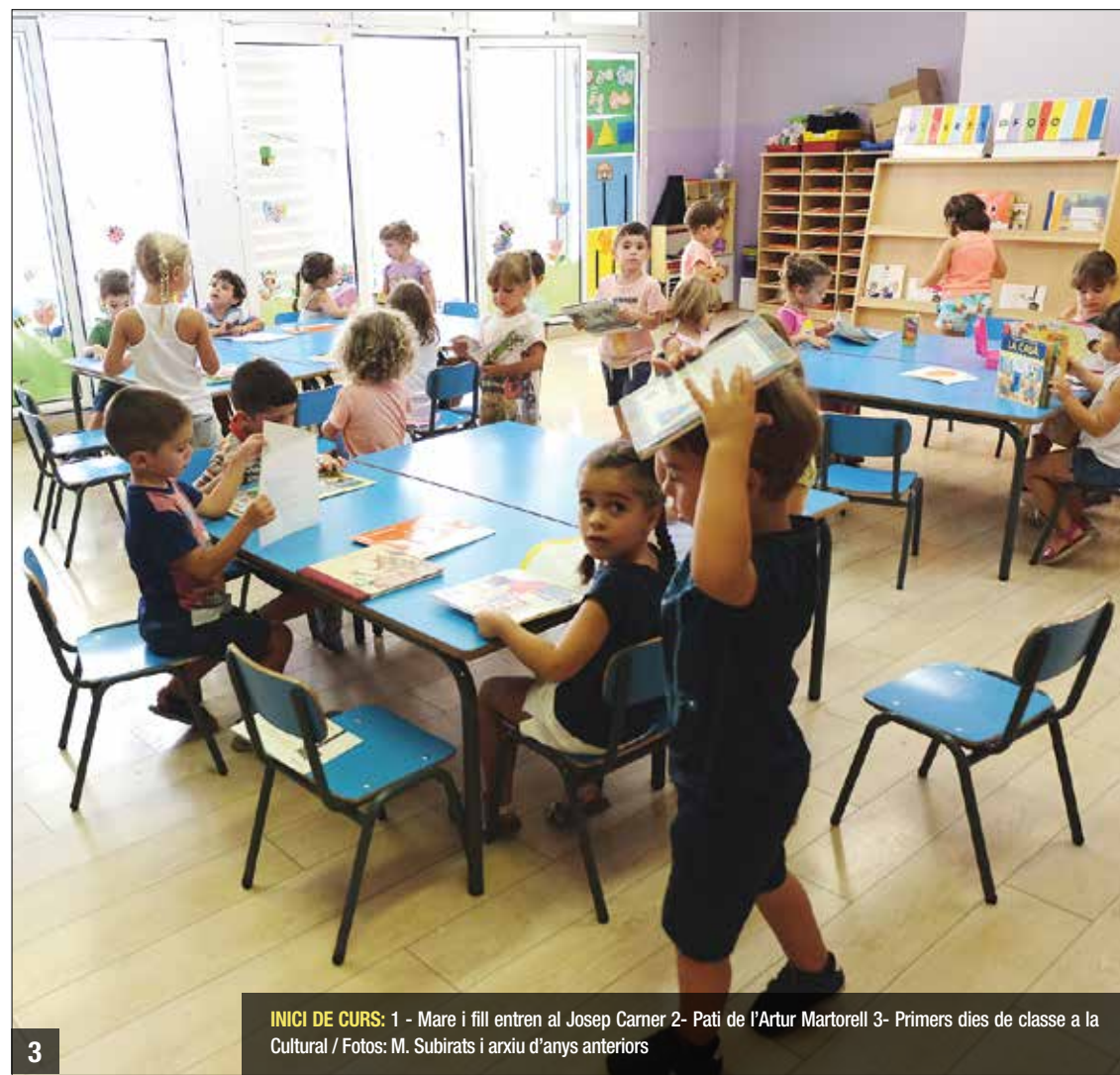
INICI DE CURS: 1 - Mare i fill entren al Josep Camer 2- Pati de l'Artur Martorell 3- Primers dies de classe a la Cultural