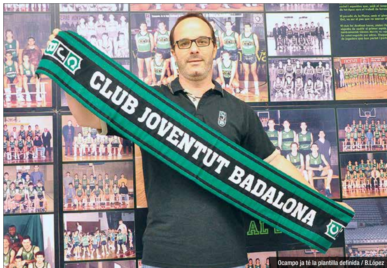
Ocampo ja té la plantilla definida

Vasiliauskas és un jugador internacional