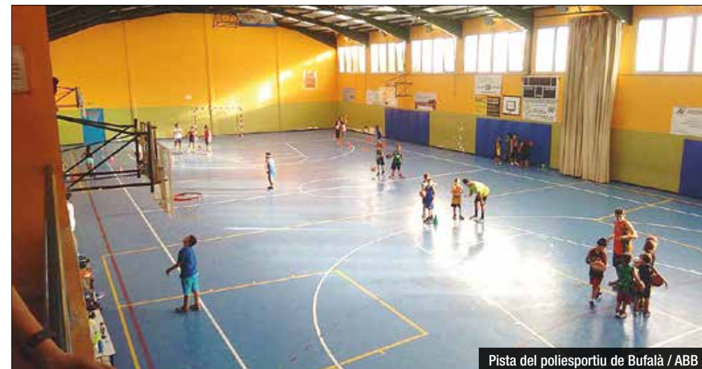
Pista del poliesportiu de Bufalà