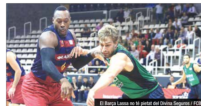
El Barça Lassa no té pietat del Divina Seguros