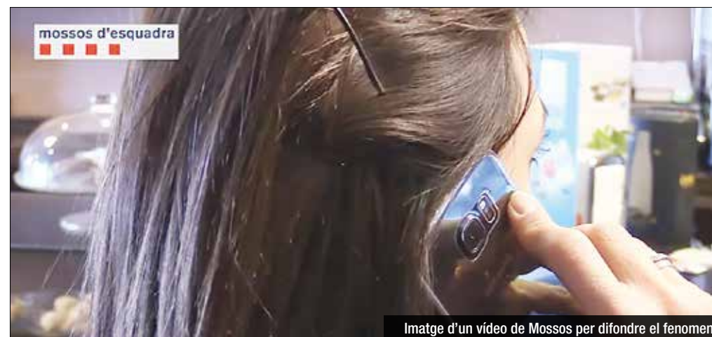
Imatge d'un vídeo de Mossos per difondre el fenomen

Els Mossos d'Esquadra detecten fins a 14 intents de simulació de segrest