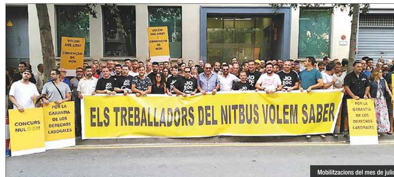
Mobilitzacions del mes de juliol

Nou episodi del cas de la concessió del servei de Nitbus que des de fa pràcticament dos anys manté en peu de guerra als treballadors de TUSGSAL. Després de la mobilització de finals de juliol de la plantilla per evitar que l'aprovació final de l'adjudicació a la multinacional ALSA anés al Ple de l'AMB, Ada Colau va encarregar un últim informe per poder prendre una decisió. I el document confirmaria les irregularitats del concurs de les que els treballadors de TUSGSAL s'han queixat des de fa mesos, segons avançava el passat diumenge El Periódico. L'informe, realitzat per professionals externs a l'AMB, apuntaria que la convocatòria del concurs per concedir el servei de Nitbus no va ser publicat al Diari Oficial de la Unió Europea de la forma que marca el reglament del Parlament Europeu. En aquest sentit, el procés de licitació es podria anul·lar de ple dret, quelcom que la plantilla de TUSGSAL ja va començar a reclamar fa més d'un any amb aquest mateix argu-