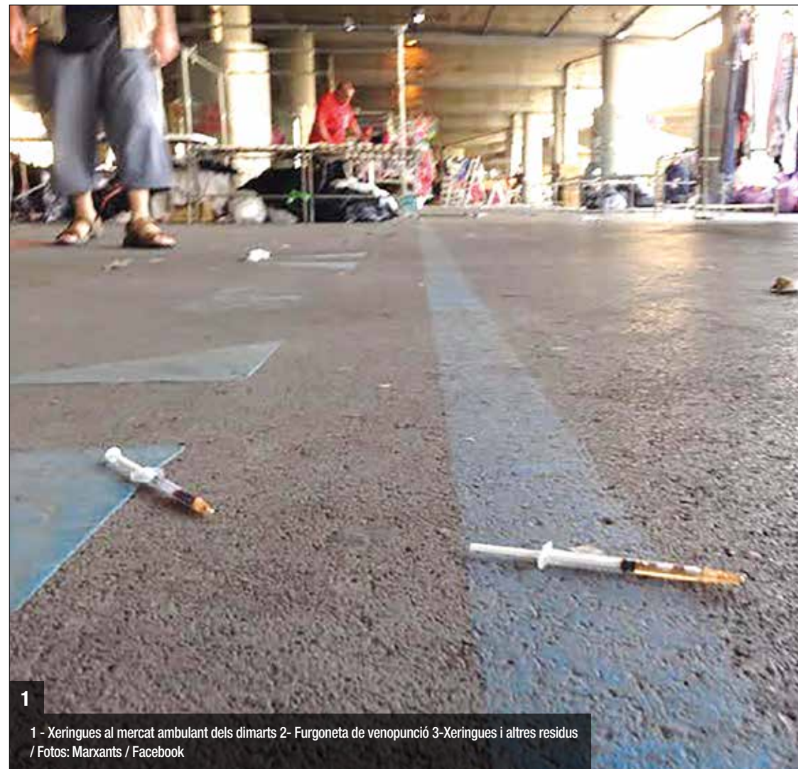
1 - Xeringues al mercat ambulant dels dimarts 2- Furgoneta de venopunció 3-Xeringues i altres residus