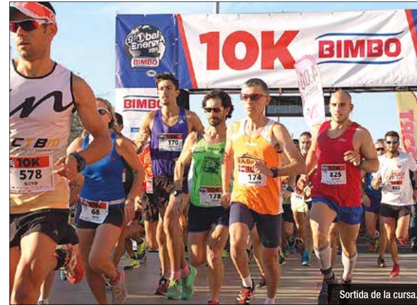
Sortida de la cursa.

Badalona va acollir durant el matí del diumenge 25 de setembre la segona edició de la Bimbo Energy Race, una cita esportiva global i única que, lluny de ser una cursa convencional, la seva organització sota la mà de Zona Vip Events va convertir Badalona en una de les 37 ciutats de 22 països d'arreu del món en participar en un ambiciós repte proposat per la companyia Bimbo. L'objectiu era assolir els 100.000 inscrits, una xifra titànica en només en una cursa, sumant-se la complexitat en sincronitzar i organitzar 22 països en un mateix dia. La jornada esportiva va despertar a les 9 del matí al Port de Badalona i ho va fer, sorprenentment, amb un sol radiant i una temperatura quasi de ple estiu, lluny de les prediccions previstes per aquell diumenge. L'esperit solidari i singular de la cursa va aconseguir reunir a 1.400 corredors que van poder gaudir, tant d'un recorregut de 10 quilòmetres, com d'un circuit més accessible de 3Km per a famílies senceres de totes