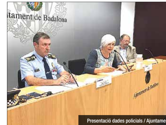
Presentació dades policials / Ajuntament

gener i setembre de 2015 va ser de 227.306 euros. Aquest import en el mateix període de 2016 s'ha situat en 330.767 euros, la qual cosa suposa una diferència de 103.461 euros respecte l'any anterior a causa. Cal destacar però que la xifra de retribució total 2016, inclou l'abonament de 258.610 euros per la recuperació de la paga extra de 2012 dels treballadors públics. Si no s'hagués hagut d'abonar aquesta paga extra, durant el 2016 el cost total de les retribucions hagués estat de 110.245 euros menys que l'exercici 2015.