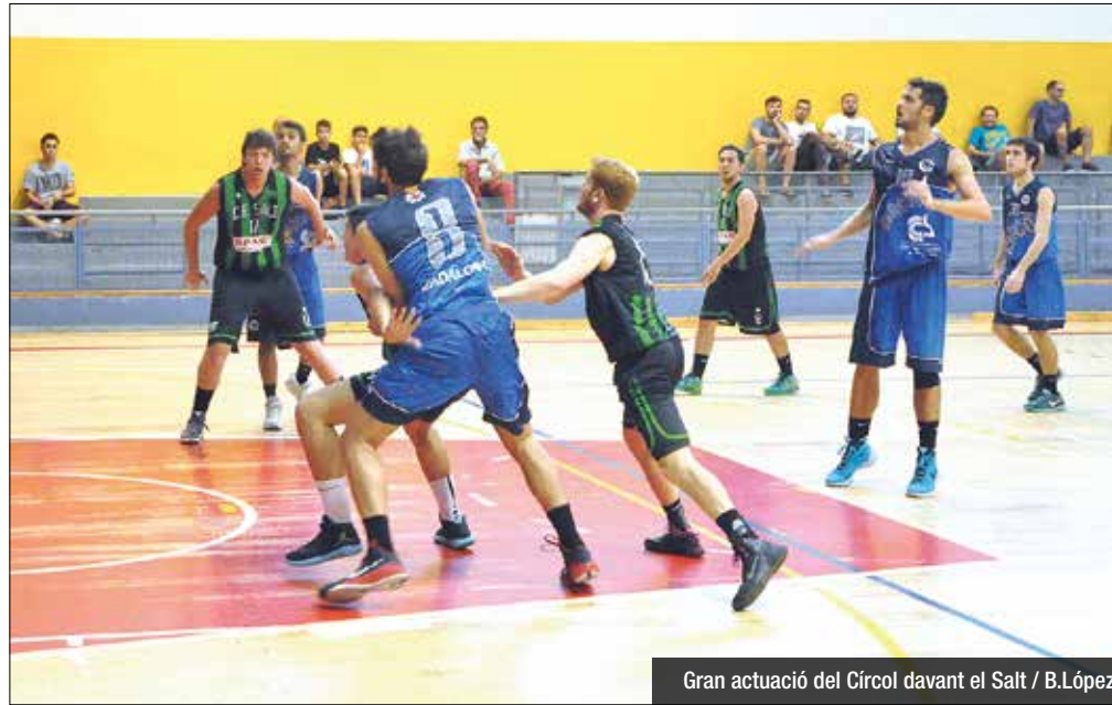
Gran actuació del Círcol davant el Salt

El bloc de Víctor Carrasco completa una demostració de força contra el CB Salt