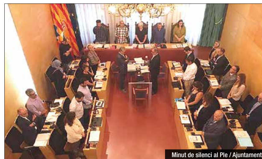
Minut de silenci al Ple

La seva mort va tocar la fibra de la política badalonina, especialment del col·lectiu socialista, el passat mes d'agost, quan les xarxes socials es van omplir de records cap a l'exregidor. El Ple li ha brindat aquest dimarts un sentit minut de silenci i un aplaudiment final.