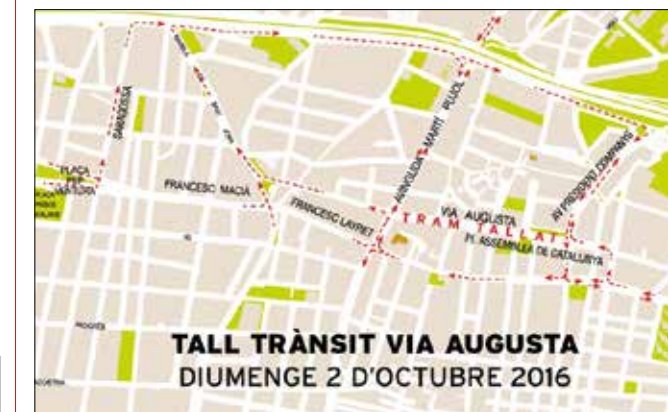
TALL TRÀNSIT VIA AUGUSTA DIUMENGE 2 D'OCTUBRE 2016

No s'hi podrà transitar entre 8 i 17 hores