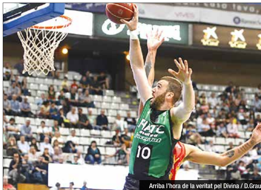
Arriba l'hora de la veritat pel Divina