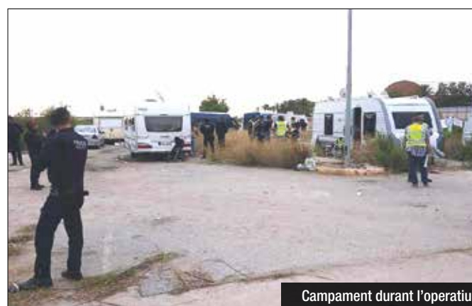
Campament durant l'operatiu

policials han explicat que havien recollit fins a quatre denúncies d'empreses de Badalona que havien rebut la visita del grup. El 'modus operandi', expliquen, era anar a oferir els seus serveis per a afiliar els estris d'algunes indústries i pressionar fins a rebre alguna quantitat de diners. La policia, que va desplaçar dimarts més d'una desena de vehicles entre cotxes i furgons, manté oberta la investigació.