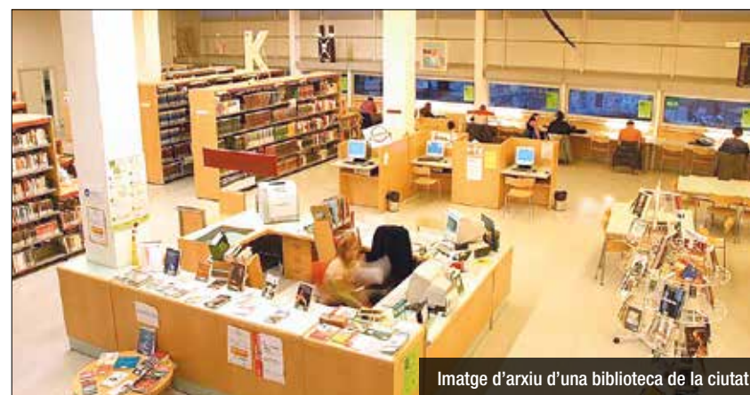
Imatge d'arxiu d'una biblioteca de la ciutat