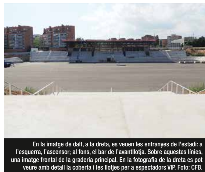
En la imatge de dalt, a la dreta, es veuen les entranyes de l'estadi: a l'esquerra, l'ascensor; al fons, el bar de l'avantllotja. Sobre aquestes línies, una imatge frontal de la graderia principal. En la fotografia de la dreta es pot veure amb detall la coberta i les il·lotges per a espectadors VIP.

El nou Estadi Municipal de Badalona creix dia a dia i en els terminis previstos. L'arquitecte, Joan Carles Navarro, confirma que estarà acabat a final de novembre, tal com havia manifestat a aquest diari en una entrevista el mes de juliol passat. I el que s'observa visitant les obres és que, efectivament, es troben en la seva recta final. Ja es veuen les cinc il·lotges per a espectadors VIP