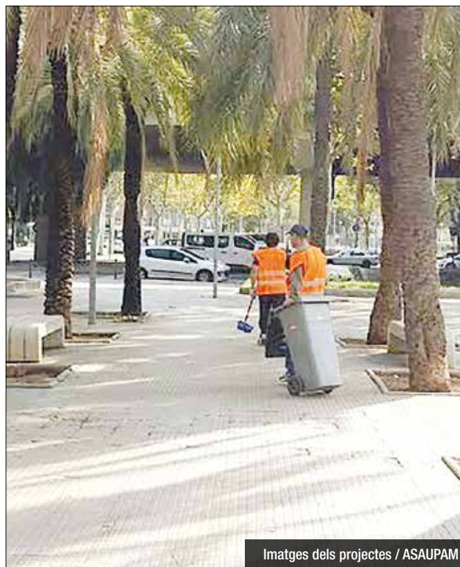
Imatges dels projectes