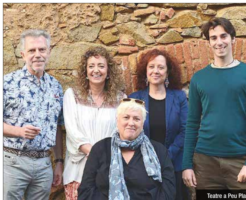
Les obres de teatre tornen aquest cap de setmana al Zorrilla i al Principal, després de 10 dies de projeccions de la mà del Festival Filmets. Aquest divendres, a les 21h, el

Doble funció aquest cap de setmana als escenaris municipals