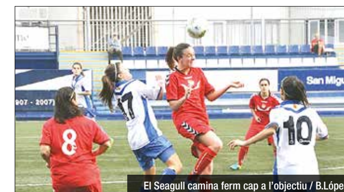
El Seagull camina ferm cap a l'objectiu

que el tercer classificat ja és a set punts de distància, gran dada per començar a assegurar el play-off.