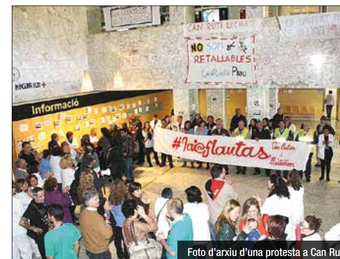
Foto d'arxiu d'una protesta a Can Ruti

El col·lectiu denuncia la manca de personal