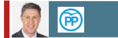
Xavier García Albiol Regidor grup municipal del PP

Hace unos días mantuve un encuentro con vecinos de Lloreda y Nova Lloreda, y todos ellos me transmitieron la gran preocupación que tienen por la degradación que existe en sus barrios. Las calles están más sucias que