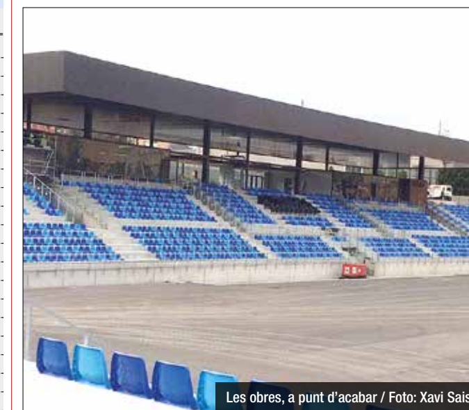
Les obres, a punt d'acabar