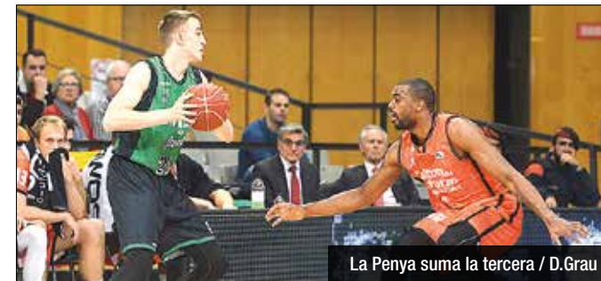
La Peña suma la tercera

Kravtsov (28 de valoració) amb el saber estar de Jordan (19). Malgrat patir en algunes fases, el bloc d'Ocampo lluitaria de tu a tu amb el València (44-44 al descans) i arribaria a obrir forat (67-60). Al final caldria patir, ja que després d'una cistella de mèrit de Vidal l'equip de Pedro Martínez erraria el triple de la victòria (86-84).