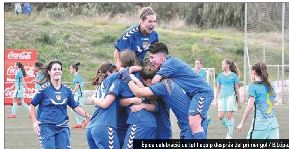
Èpica celebració de tot l'equip després del primer gol / B.López

Les gavines aprofiten l'estratègia a la perfecció per imposar-se al filial blaugrana