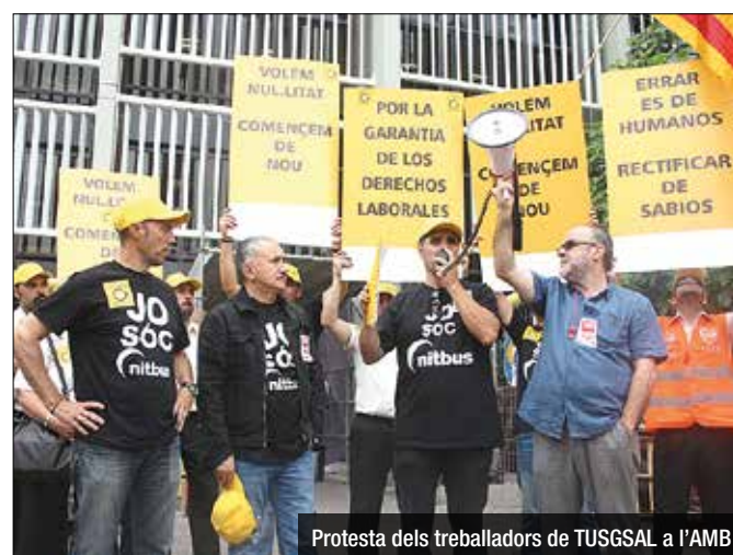
Protesta dels treballadors de TUSGSAL a l'AMB

no podia ser motiu per deixar fora una empresa en ple procés, quan encara no s'havia decidit l'adjudicació. En qualsevol cas, considera que l'oferta de la societat badalonina era la més potent, i la intenció ara és que ho torni a ser.