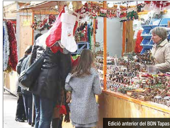
Edició anterior del BDN Tapas

La fira obrirà aquest dissabte; l'encesa de llums serà aquest divendres