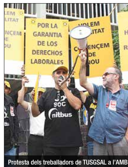
Protesta dels treballadors de TUSGSAL a l'AMB

EDITORIAL: La força de l'economia local 22