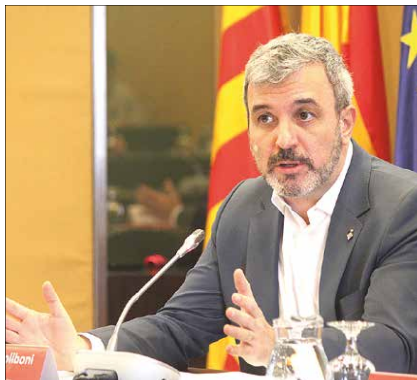
Jaume Collboni Vicepresident de Desenvolupament Social i Econòmic de l'AMB

Arran de totes les contractacions materialitzades amb la primera edició del pla, els anàlisis dels participants va desprendre un perfil clar de les persones que van participar de la iniciativa de l'AMB. Es tracta majoritàriament d'homes autòctons sense discapacitats d'entre 36 i 45 anys, amb formació bàsica de graduat escolar i provinents del sector serveis. Generalment van ser persones amb càrregues familiars i que ja portaven a l'atur més de 12 mesos.