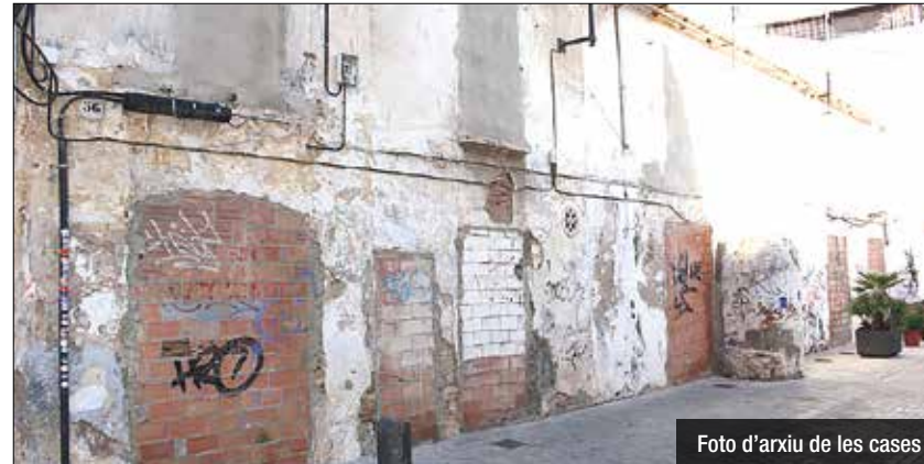
Foto d'arxiu de les cases

Un pla especial urbanístic les protegiria tot i la seva descatalogació el 2013