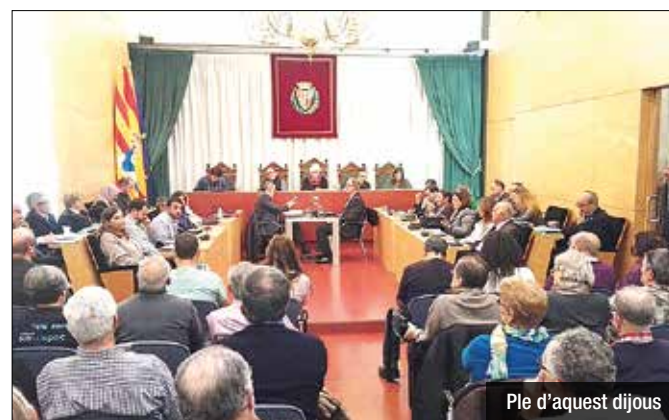
Ple d'aquest dijous