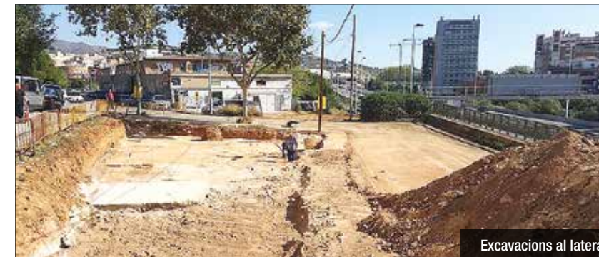
Excavacions al lateral