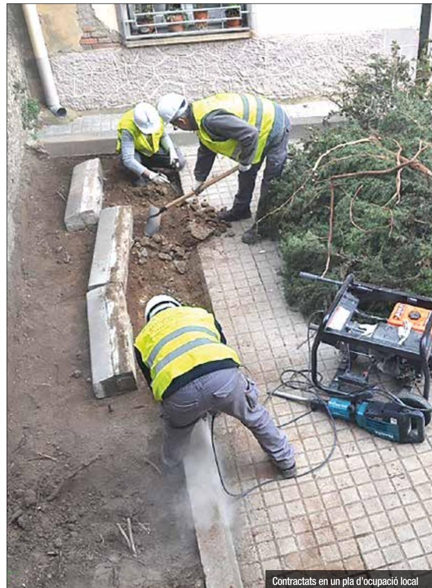
Contractats en un pla d'ocupació local

“La creació d'oportunitats laborals és el primer instrument que tenim per combatre les desigualtats i aconseguir la inclusió social, l'objectiu últim del govern metropolità”