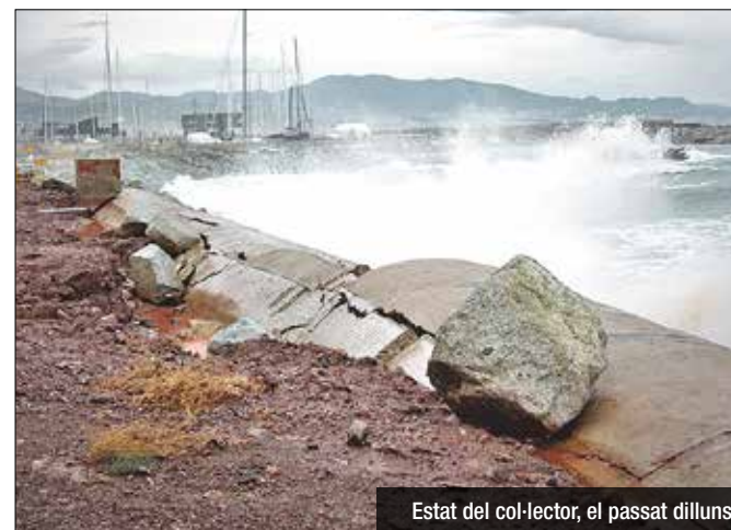
Estat del col·lector, el passat dilluns

Tot i que el desperfecte més simbòlic i que tothom ha fotografiat és el del Pont del Petrolí, l'efecte més potencialment devastador a nivell ambiental del temporal del passat cap de setmana és el trencament del col·lector de Llevant, la canalització que condueix totes les aigües residuals del clavegueram de Montgat i Badalona cap a la depuradora del Besòs. El col·lector transcorre en paral·lel a la platja i, a dia d'avui, és visible i està des-tapat des del barri de la Mora fins al terme municipal de Sant Adrià.