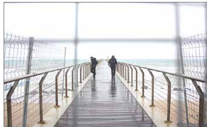
Les autoritats fan comprovacions al pont, dilluns

que ja es van poder veure diumenge s'han donat al Pont del Petroli, la plataforma final del qual ha quedat molt malmesa. L'accés roman i romandrà tancat els propers dies i probablement setmanes. La força del mar va fer desaparèixer baranes i taules de fusta. De fet, fonts municipals han confirmat que les onades