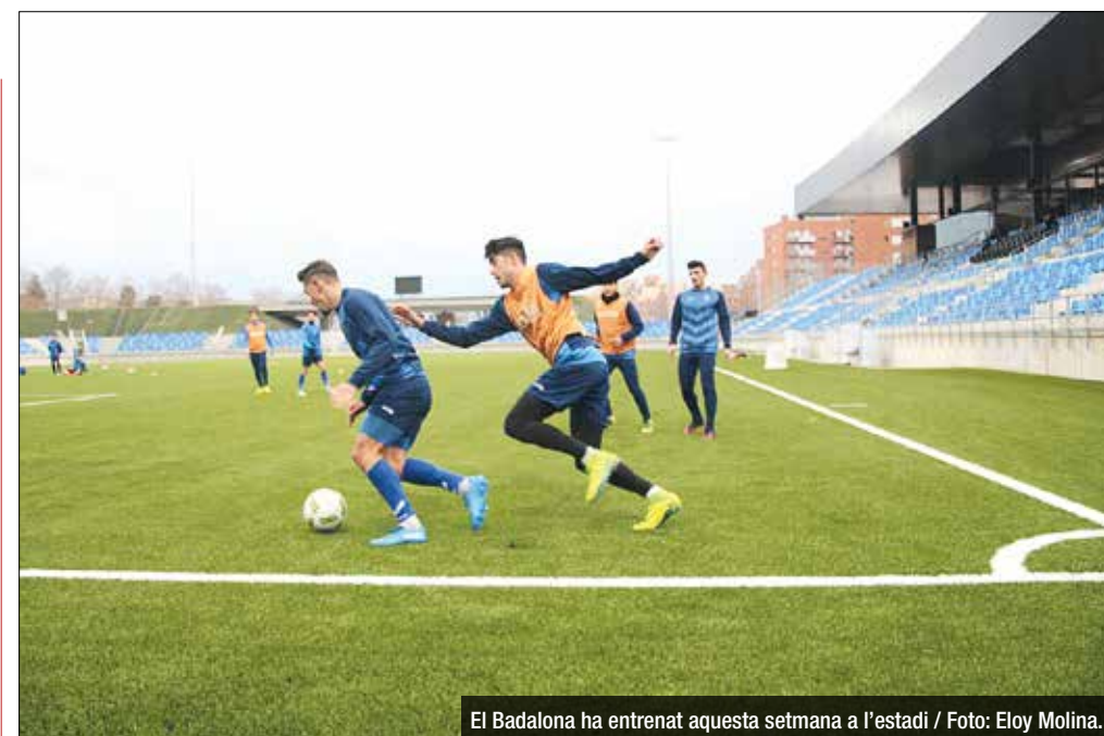
El Badalona ha entrenat aquesta setmana a l'estadi / Foto: Eloy Molina.

quatre primers i veu premiada la seva impecable trajectòria, però per continuar allà dalt és imprescindible no deixar de sumar. Els filials del València i el Vila-real pressionen amb força i obliguen a una victòria aquest diumenge. No serà gens fàcil repetir la història de la primera volta quan, en una sensacional actuació, el Ba-