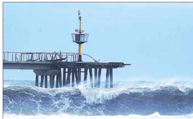
Onades del passat diumenge van destrossar el pont

Les onades del passat diumenge van deixar molt més que imatges espectaculars el passat cap de setmana a Badalona. Dilluns, després, les autoritats municipals van poder començar a revisar l'abast dels desperfectes provocats per les onades de més de 5 metres. De fet, des de l'Ajuntament es va establir l'estat d'emergència ambiental a través de l'aprovació d'un decret que permetrà respondre econòmicament de forma flexible per posar remei als danys que ha patit tota la costa badalonina. Els desperfectes més evidents i