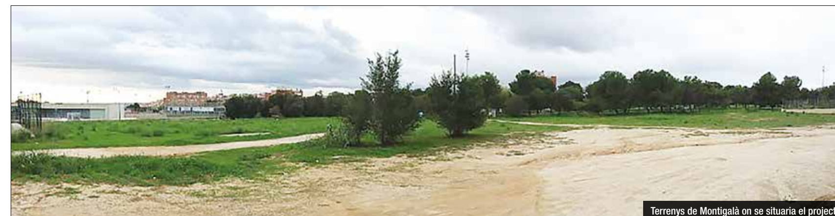
Terenys de Montigalà on se situaria el projecte

L'aprovació inicial serà per Junta de Govern, abans de passar per Ple