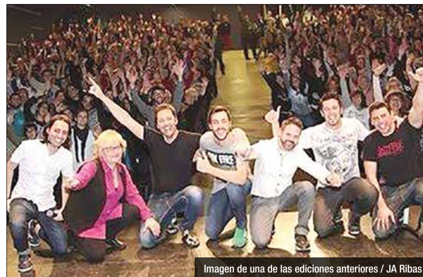
Imagen de una de las ediciones anteriores