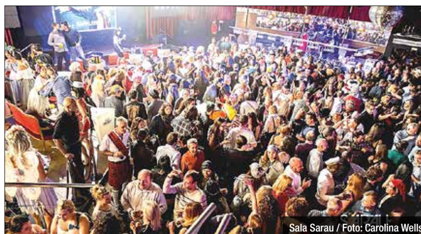
Sala Sarau

El grup es va formar el 1996 amb la intenció de revivir el disco. La sala badalonina s'ha consolidat com la sala més estable de concerts a la ciutat. De fet, cada divendres i dissabte programen concerts, de tots els estils, a part de propostes d'oci com monòlegs, festes de ciutat o esdeveniments socials.