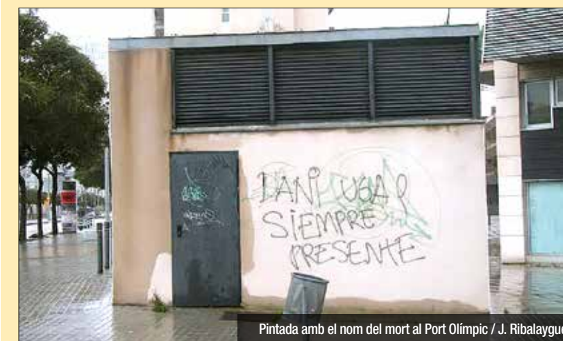
Pintada amb el nom del mort al Port Olímpic / J. Ribalaygue

A finals de novembre, la Generalitat va posar fi a la comissió en la qual van participar els ajuntaments de Sant Adrià i Badalona, així com una vintena més de localitats on els fugats es van instal·lar. Fonts de la comissió neguen que es negociés amb els 'Baltasares' perquè renunciaran a la venjança. "No ens sotmetem a aquestes lleis".