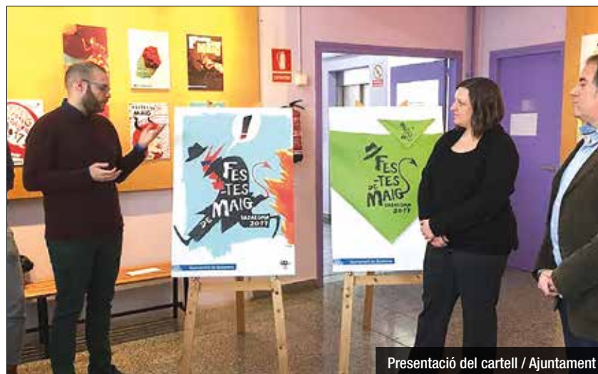
Presentació del cartell

El color verd del mocador solidari de les Festes de Maig 2017 s'ha escollit, tal i com ja es va fer l'any passat, a partir de la tria