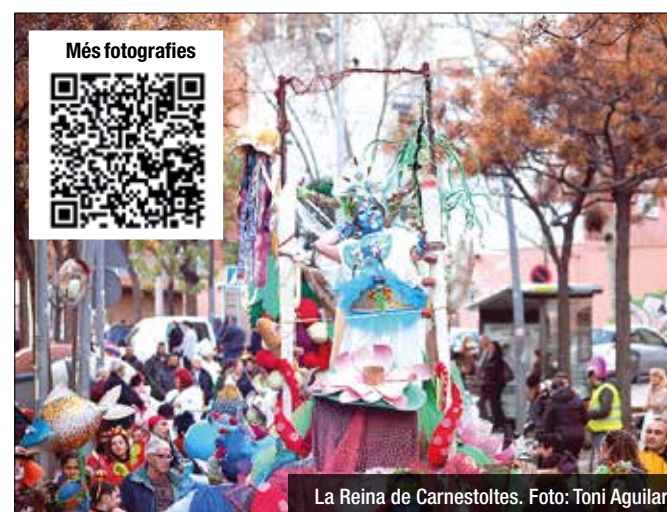
La Reina de Carnestoltes.

rarquies; subvertiu la fe i l'ordre social, poseu el món de cap per vall, i poseu verds i encabritats a aquells que us tenen pels ous aferrats". També feia un crit a la diversió, la solidaritat i el treball per millorar la ciutat, el barri i les condicions socials. Tot seguit, més de 1.500 participants van arrancar la 35a edició de la Rua de Carnestoltes pels carrers de Sant Antoni i Sant Mori de Llefià fins a arribar a la plaça Trafalgar. Un any més s'han vist disfresses amb moltes hores de treball i imaginació, com 'Air