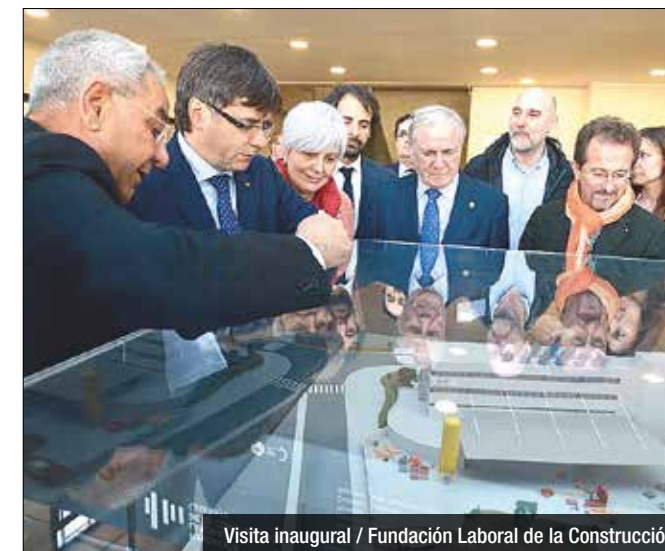
Visita inaugural / Fundació Laboral de la Construcción

El President inaugura la nova central, a Montigalà