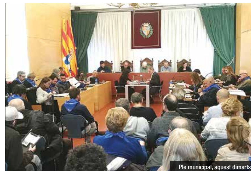
Ple municipal, aquest dimarts