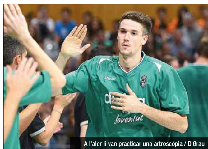
A l'aler li van practicar una artroscòpia

fer sessions de qualitat per acabar la lliga bé", destacava el jugador vinculat. Actualment, el CB Prat es troba a mig camí de la zona de descens i de les eliminatòries pel títol de la LEB Or i l'equip aposta per intentar mirar cap a la zona alta. "Dins del vestidor sí que s'ha parlat del tema del play-off. Resten nou jornades i el tenim a quatre partits. Farem tot el possible per lluitar-ho fins al final, perquè ens suposa una motivació", afirmava López-Arostegui. L'exterior es va notar "una mica lent" a Lugo, sobretot "en la primera rotació". "És normal després de quatre setmanes aturat. Sé que he de fer, perquè conec més la competició. Contra l'Oviedo espero tornar al meu nivell d'abans", valorava.