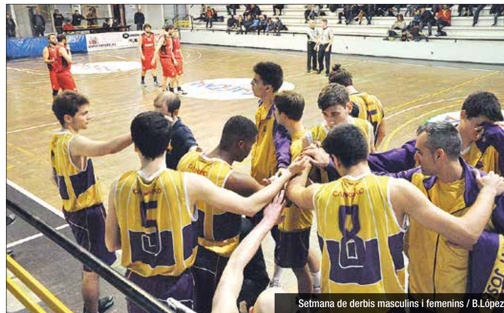
Setmana de derbis masculins i femenins

El plat fort de la setmana dins del bàsquet masculí de Badalona es va viure al Centre Parroquial amb un enfrontament entre el Sant Josep (16/2), líder del grup I de Copa, i l'AE Badalonès (7/11), vuitè classificat. Els dimonis obligarien els locals a rectificar molts tirs, circumstància que evitaria que el Sant Pep pogués marxar definitivament abans del descans (31-17). En la represa, i després d'uns bons minuts d'intensitat defensiva vermella, un triple de Cuesta posava el líder a 18 punts (50-32), renda insalvable malgrat els intents protagonitzats per Balagué i Solé (66-57). La diferència en el rebot (46 a 27) seria clau pel Sant Pep (71-60). Baixant fins al grup II de Primera, observem com els clubs de Badalona van viure una jornada excel·lent. El líder, Maristes Ademar (17/3), iniciava el seu partit contra l'Arbúcies anotant vuit triples en el primer quart (16-28), però hauria de treballar fins al final (66-66) després de veure com el rival li empatava el partit (80-84). Pel que fa al Círcol (16/4), el segon classificat oferiria una demostració d'autoritat a la Plana anul·lant totalment el Cabrera a partir del segon període i amb dos parcials de 21-10 i 23-9 (79-53). En relació a l'AE Minguella (7/13), l'equip de David Martín faria un pas endavant vital per les seves aspiracions de permanència, exhibint a la pista del Quart una de les seves millors versions del curs (72-85). A Segona el Badalonès (9/10) continua sense funcionar després de cedir