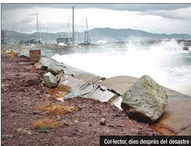
Col·lector, dies després del desastre