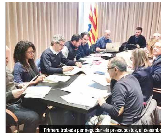
Primera trobada per negociar els pressupostos, al desembre

El debat del pressupost i l'annex d'inversions torna a ser posposat