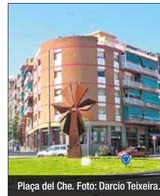
Plaça del Che.

cursfembarri.blogspot.com. Entre els premiats, l'associació repartirà un total de 70 euros en metàl·lic i 10 afiliacions gratuïtes durant un any a l'entitat veïnal.