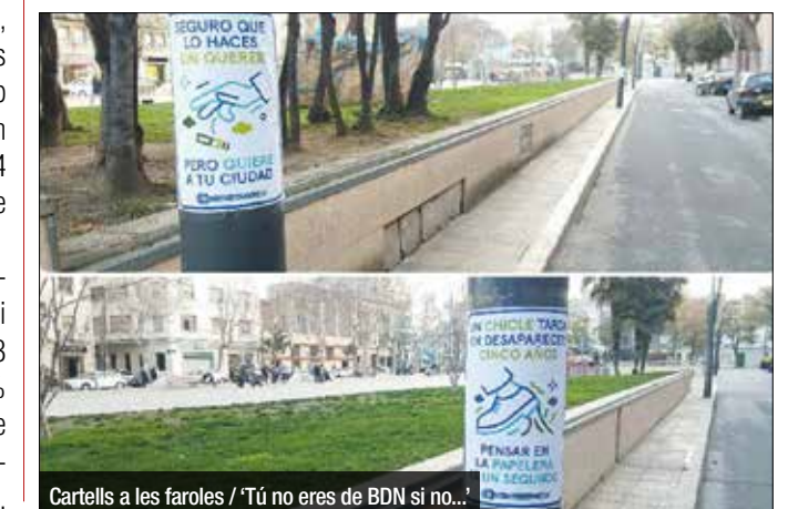
Cartells a les faroles / 'Tú no eres de BDN si no...'

Ja ho varen fer fa uns mesos, i la bona rebuda els ha portat a impulsar una segona campanya de conscienciació entre el veïnat. Els organitzadors de la pàgina de Facebook 'Tú no eres de Badalona si no...' han creat nous cartells amb lemes que animen a utilitzar les papereres o a no deixar els excrements dels gossos al carrer, entre d'altres actes de civisme. Els primers cartells s'han començat a distribuir aquests dies pel barri del Centre, tant al carrer com entre negocis i comerços. Poc a poc, s'aniran enganxant també a la resta de barris. La tirada inicial és d'uns 2.000 cartells, que s'augmentaran fins a un màxim de 5.000 a mesura que es vagin esgotant.