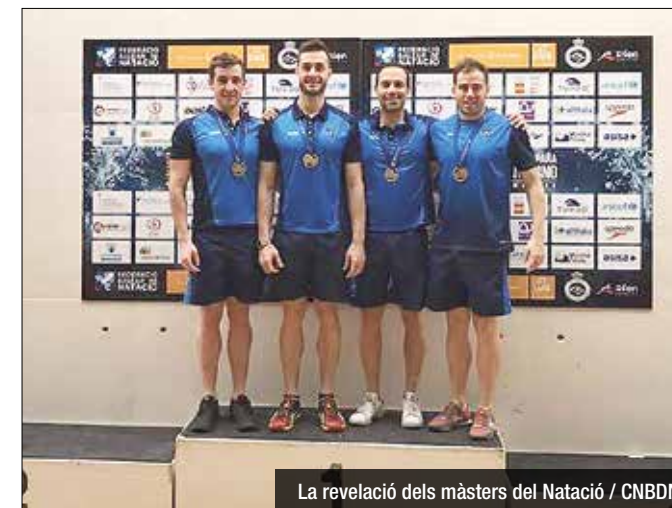
La revelació dels màsters del Natació