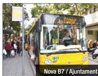
Nova B7 / Ajuntament

Les línies B7 i B44 d'autobusos s'han fusionat des d'aquesta setmana. La línia resultant, la nova B7, unirà els barris de Pomar, Morera, Canyadó, Casagemes i Centre amb el Front Marítim, la Mora i les estacions de Renfe de Badalona i Sant Adrià de Besòs, així com amb l'estació del Trambesòs. La freqüència de pas de la nova línia B7 serà de 20 minuts els dies feiners i també allarga el servei al vespre fins a dues expedicions més. Als festius la freqüència de pas serà de 35 minuts.