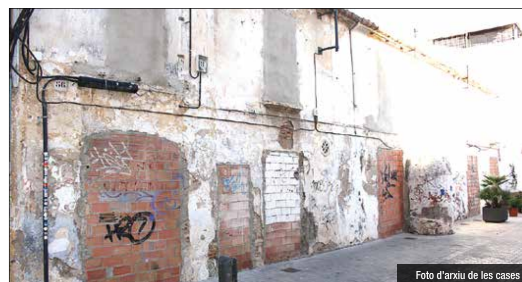
Foto d'arxiu de les cases

El govern vol garantir la conservació de les cases de pescadors de Baix a Mar, al Centre, que van ser descatalogades fa uns anys pel seu estat de ruïna. Per això, aquest dimarts ha impulsat una modificació del pla especial que les protegeix com a patrimoni local, i que ha comptat amb el suport del Ple sense cap vot en contra. A partir d'ara, les quatre de les sis finques que es poden conservar podran acollir activitat comercial a la planta baixa, mentre que la planta superior podrà continuar sent habitatge. Sempre respectant una sèrie d'elements patrimonials, com ara la façana o el pou d'aigua. La intenció és fer que la parcel·la de cases sigui més atractiva per a l'entrada de privats que puguin injectar capital i assegurar la con-