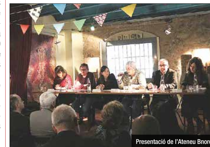
Presentació de l'Ateneu Bnord

espai d'impuls de l'economia social, el cooperativisme i nous projectes. La iniciativa té previst impulsar aproximadament una trentena de cooperatives, que se sumaran a les 113 que funcionen a dia d'avui al territori. Inicialment, l'Ateneu Bnord disposarà d'un pressupost de poc més de 200.000 euros.