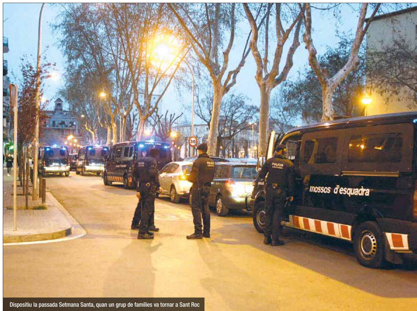
Dispositiu la passada Setmana Santa, quan un grup de famílies va tornar a Sant Roc