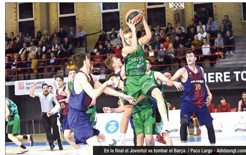
En la final el Joventut va tombar el Barça.

els renyi, i tenen clar que volen ser professionals. Estan en un bon camí d'escoltar, de creure en la metodologia, de no tenir pressa". "Això és una carrera de fons per tots ells, i mentre uns poden arribar als 21 anys, altres ho poden fer als 24", afegeix Miret, que té clar que els resultats, en formació, no són el més transcendent: "Evidentment som competitiu i volem guanyar, i aquest triomf els permetrà viure una experiència a la Final Four que segur que no oblidaran mai. Però el més important, el que tots volem, és que d'aquí un temps tots aquests nanos arribin al màxim nivell. Que estiguin preparats si hi ha una oportunitat al primer equip i que siguin els jugadors que la gent de l'Olimpic vol veure i amb els quals s'identifica".