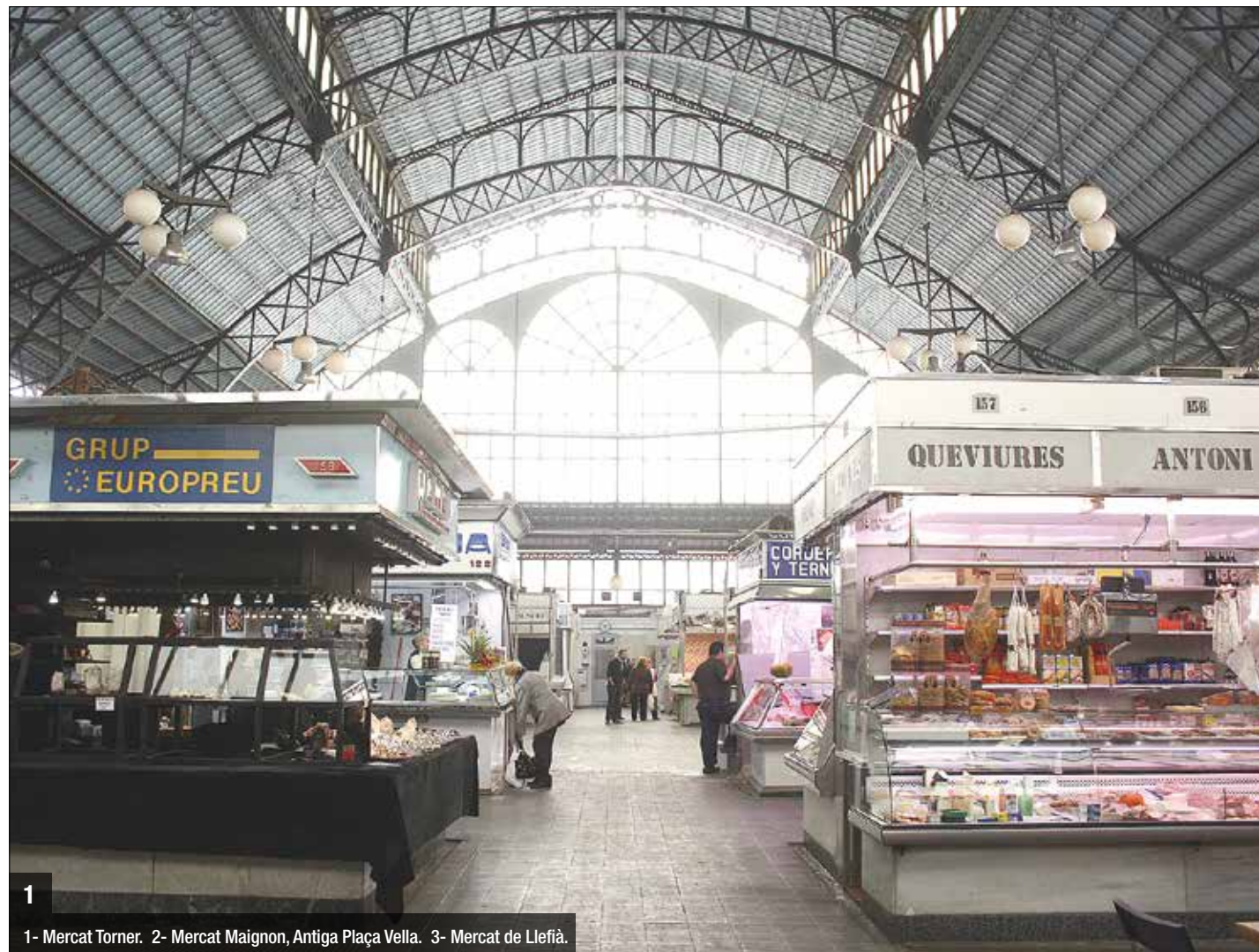
1- Mercat Torner. 2- Mercat Maignon, Antiga Plaça Vella. 3- Mercat de Llefià.

Comerç creu que reubicar el mercat a Pep Ventura seria molt positiu per a la dinamització de la seva activitat, i permetria, entre altres opcions, fer de l'actual espai del Torner una gran plaça porxada al cor del barri del Progrés. No obstant, això seria no més que una hipòtesi, ja que seria un pas que s'hauria de madurar molt i executar el proper mandat, com a molt aviat. Els paradistes del Torner veuen amb molt bons ulls un hipotètic trasllat a Pep Ventura, però després de diferents promeses i projectes es mostren molt escèptics. Han perdut un 25% de comerços els darrers quatre o cinc anys, i avisen que el ritme continuarà baixant si l'Ajuntament no reacciona. La informació que existeix sobre aquesta nova idea és poca, ja que es va començar a parlar fa un o dos mesos, i esperen saber-ne més prou abans de poder fer una valoració sòlida.