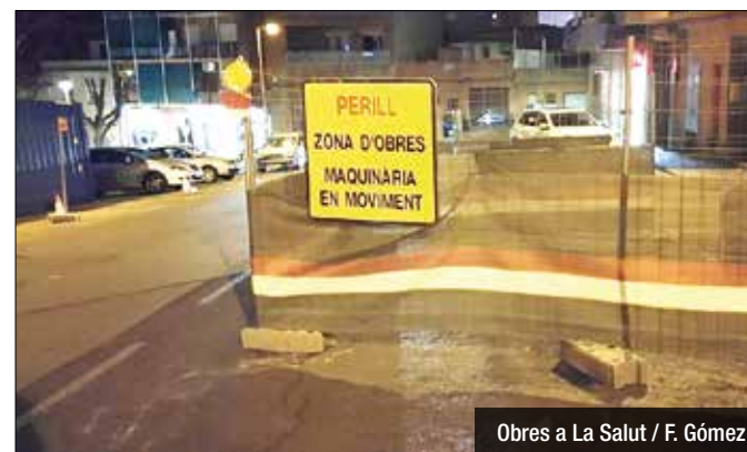
Obres a La Salut / F. Gómez

Aquesta setmana han començat les obres de reurbanització del carrer d'Isaac Albéniz, al barri de la Salut, un projecte que suposarà la millora de la mobilitats dels i les vianants, entre el carrer d'Hipòlit Lázaro i l'avinguda de Carítg. Les actuacions inclouen la millora de la urbanització, l'ampliació de voreres mantenint els carrils de circulació i la col·locació de nous elements d'arbrat i enllumenat. Aquesta obra té un cost de 117.000 euros i una durada prevista de dos mesos.