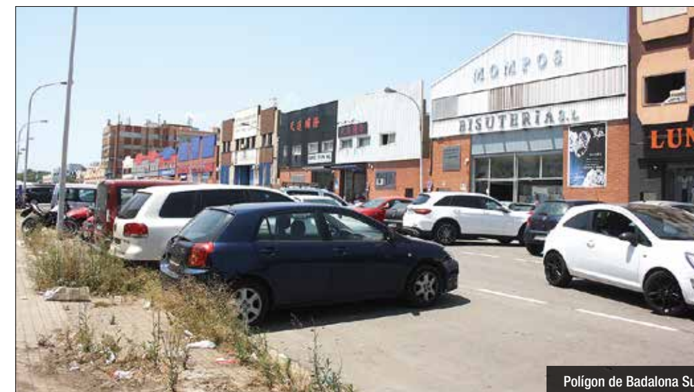
Polígon de Badalona Sud

L'Ajuntament treballa en l'adjudicació de les obres per uns 2 milions