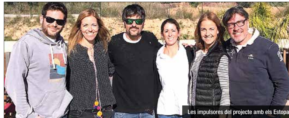
Les impulsores del projecte amb els Estopa