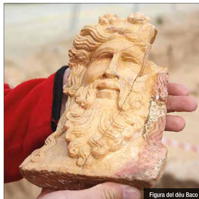
Figura del déu Baco

Apareixen al 'top 10' de National Geographic