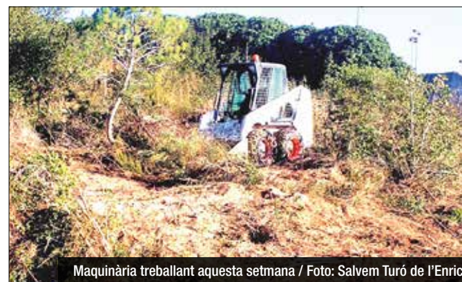
Maquinària treballant aquesta setmana

L'Ajuntament ha demanat aturar els treballs