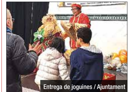
Entrega de joguines

Un any més, la campanya Cap infant sense joguina ha tornat a ser un èxit a Badalona. Gràcies a la solidaritat de la ciutadania, aquest Nadal, més de 400 famílies han rebut lots de joguines, fet que suposa que prop de mil infants de Badalona s'hagin beneficiat de la campanya. La campanya es fa extensiva a institucions de caràcter social i solidari, a infants en tractament a l'Hospital Germans Trias i Pujol i a l'Institut Guttmann i també a les residències de gent gran públiques. Aquest fet permet que el total aproximat de beneficiaris de la campanya superi les 1.600 persones