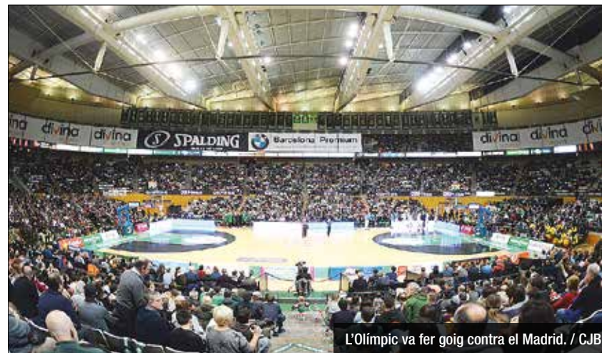
L'Olimpic va fer goig contra el Madrid. / CJB

Promoció per omplir també contra el Múrcia