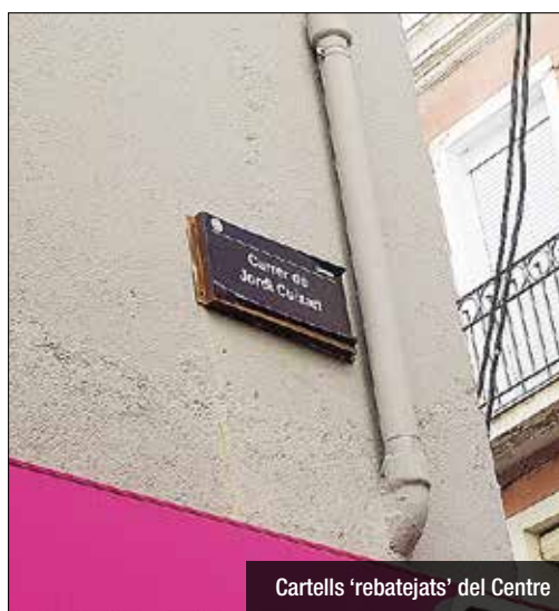
Cartells 'rebatejats' del Centre

pública, matisen que encara no s'ha dut a terme la neteja general, i que els cartells que han estat desenganxats no són pas per acció municipal. "Hem preferit deixar passar les eleccions i que