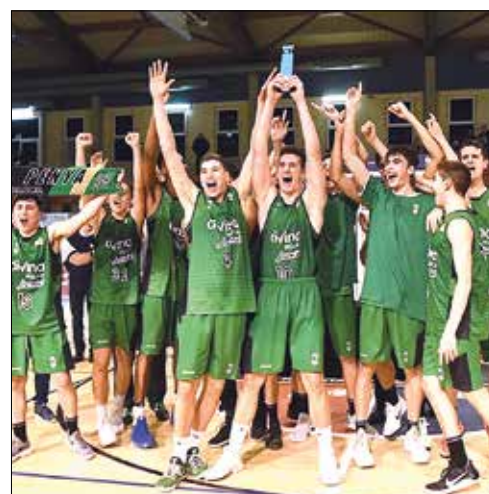
La Penya, celebrant el triomf.

EDITORIAL: Cap concessió a l'incivisme 14