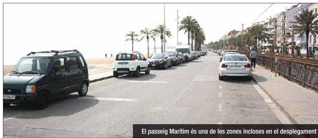
El passeig Marítim és una de les zones incloses en el desplegament

La mesura s'havia d'anar instaurant durant el 2017, però no hi ha hagut cap avenç