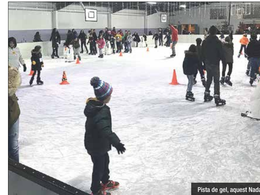
Pista de gel, aquest Nadal

L'aflluència ha augmentat aquest segon any a l'espai lúdic