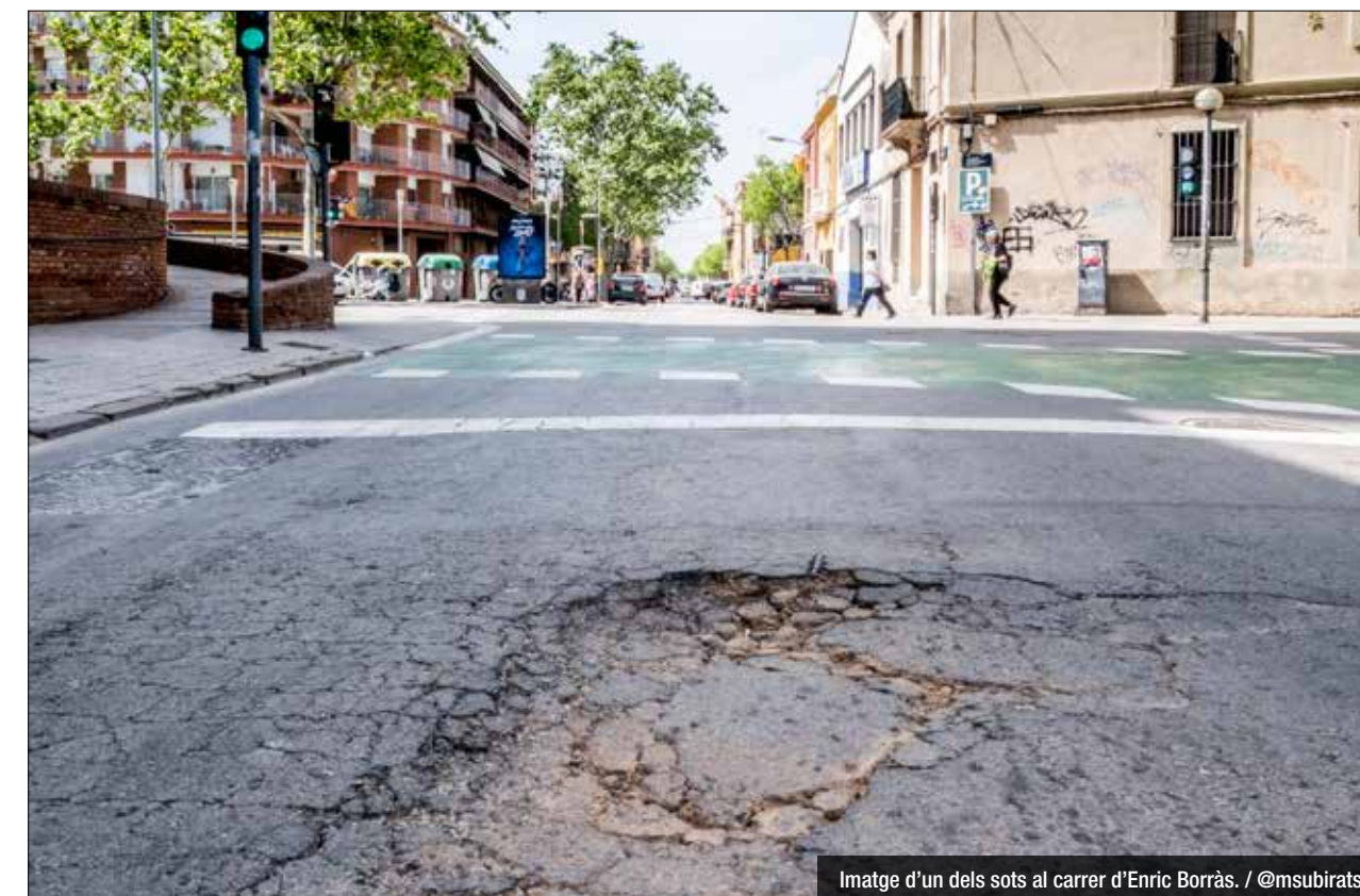
Imatge d'un dels sots al carrer d'Enric Borràs.

Es faran treballs a Enric Borràs, Progrés, Lladó i Coll i Pujol