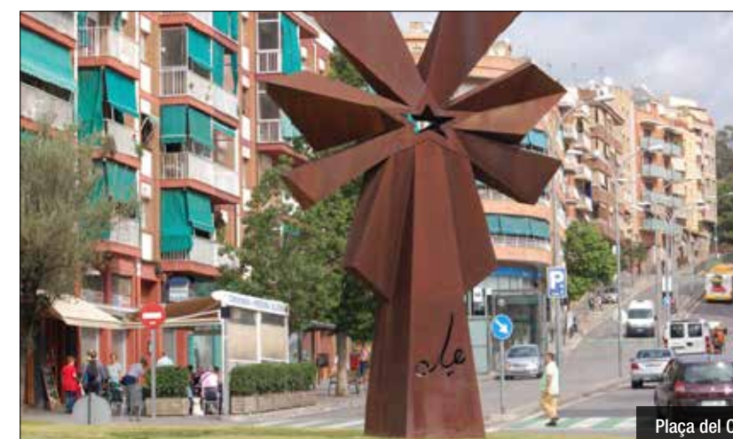
Plaça del Che

Les diverses entitats que participen en el Comitè Cívic Salvador Allende i la Comissió Che Guevara, totes dues de Badalona, s'han reunir per començar a preparar els homenatges que, com cada any a la nostra ciutat, commemoren els aniversaris dels assassinats d'Allende i el Che, i com a novetat, es realitzarà un acte en record a Víctor Jara, en el 45è aniversari del seu assassinat per part de l'exèrcit de Pinochet. Concretament l'11 de setembre tindrà lloc l'ofrena a Allende a la plaça que porta el seu nom, situada al barri de Sant Mori de Llefià. També, el dia 15 del mateix mes a la plaça de la Segona