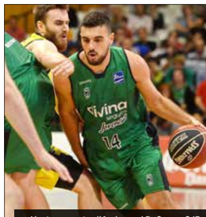
Ventura, contra l'Andorra.

La Federació Catalana de Bàsquet (FCBQ) ja ha donat a conèixer el calendari i la seu de la pròxima edició de la Lliga Catalana ACB. El torneig es disputarà al pavelló Barris Nord de Lleida, el 8 i 9 de setembre, i en semifinals el Divina Joventut se les veurà amb el Morabanc Andorra. L'altra semifinal la protagonitzaran el Barça Lassa i el Baxi Manresa. Feia 15 anys que Lleida no acollia la Lliga Catalana, competició que en els darrers anys ha estat monopolitzada pel Barça, que suma 21 títols. La Penya en té 11.