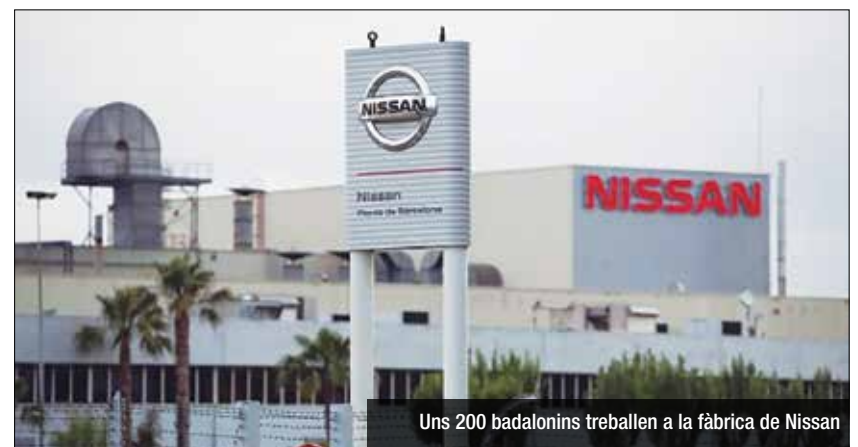
Uns 200 badalonins treballen a la fàbrica de Nissan

treballadors de la fàbrica, i afecta més de 20.000 llocs de treball indirectes que en depenen. D'aquests, uns 200 badalonins i badalonines treballen directament a la fàbrica i molts més ho fan indirectament. Els treballadors s'han manifestat, aquest dijous, en diverses zones de Barcelona, com la Ronda litoral o la Gran Via. El pla de negoci presentat aquest dimecres per l'aliança Nissan-Renault i Mitsubishi preveu el repartiment de regions del món i de gammes i models. La planta de Barcelona no en forma part, d'aquest repartiment; n'ha quedat fora.