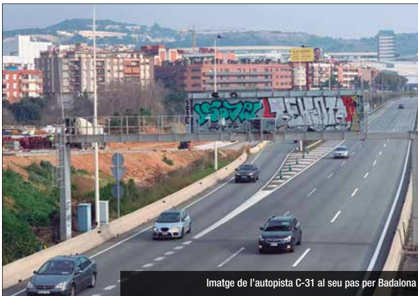
Imatge de l'autopista C-31 al seu pas per Badalona