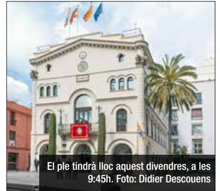
El ple tindrà lloc aquest divendres, a les 9:45h.

cartipàs del govern d'Albiol. Des de PSC, ERC i En Comú, al moment de tancar aquesta edició, ja havien anunciat que votarien en contra d'aquest augment. Per la seva part, Guanyem estava a l'espera d'una assemblea de partit que havia de debatre aquest cartipàs i Junts podria decantar-se per l'abstenció. El ple d'aquest divendres tindrà 15 punts més a l'ordre del dia, com la designació de nous membres als organismes municipals o delegar algunes atribucions més a l'alcalde, Xavier Garcia Albiol.