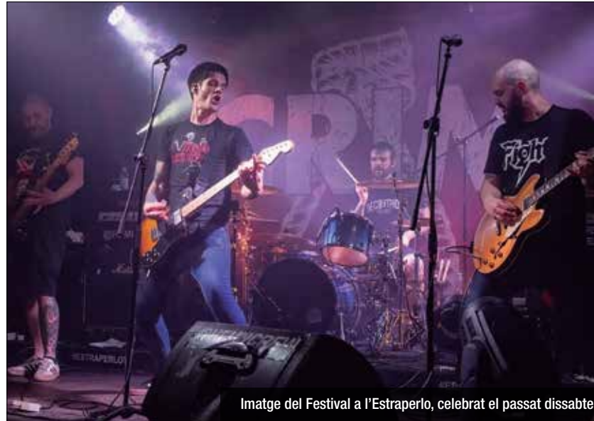
Imatge del Festival a l'Estraperlo, celebrat el passat dissabte

Fins a 55.000 persones van seguir l'edició en streaming del festival Fem d'Aquí amb concerts en directe des de l'escenari de la Sala Estraperlo del polígon de Can Ribó. El concert, que es va celebrar el dissabte, va comptar amb la participació dels grups de punk català Crim, La Inquisició i Deadyard. L'organització ha assegurat que el festival va ser "tot un èxit" —es va multiplicar l'aforament per 400— i han assenyalat que el so i la realització van ser "de molta qualitat", amb fins a set càmeres gravant". Creuen que aquests factors van "sorprendre i animar en parts iguals" el públic. A més, destaquen que les persones que van seguir el directe "no van parar de deixar comentaris molt positius" als perfils que emetien el vídeo. La Sala Estraperlo es planteja oferir aquest servei a totes les bandes i promotors que vulguin repetir aquest format. Els organitzadors asseguren que es van complir tots els protocols de seguretat, com la distància de seguretat, l'ús de màscares pels treballadors, l'ús