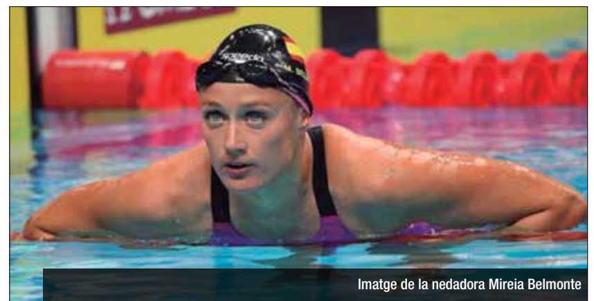
Imatge de la nedadora Mireia Belmonte

Després de dos mesos sense tocar l'aigua, Mireia Belmonte ha tornat a la feina. La nedadora badalonina ha explicat a Catalunya Ràdio com està tornant a agafar les sensacions aquàtiques al CAR de Sant Cugat. Belmonte ha reconegut que costa molt tornar-s'hi a posar després d'una aturada, sobretot la qüestió tècnica: estils, viratges, sortides, puntes, etc. Ara bé, la badalonina també és optimista ja que els jocs