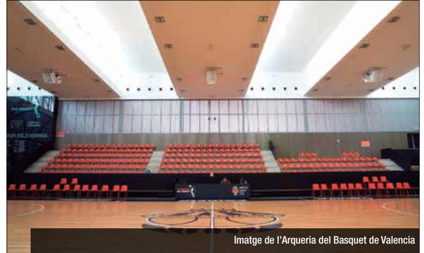
Imatge de l'Arqueria del Basquet de València

El Club Joventut Badalona acaba d'estrenar una nova botiga online amb una versió millorada que busca ser més dinàmica i eficaç, amb un disseny molt visual i amb l'objectiu d'agilitzar