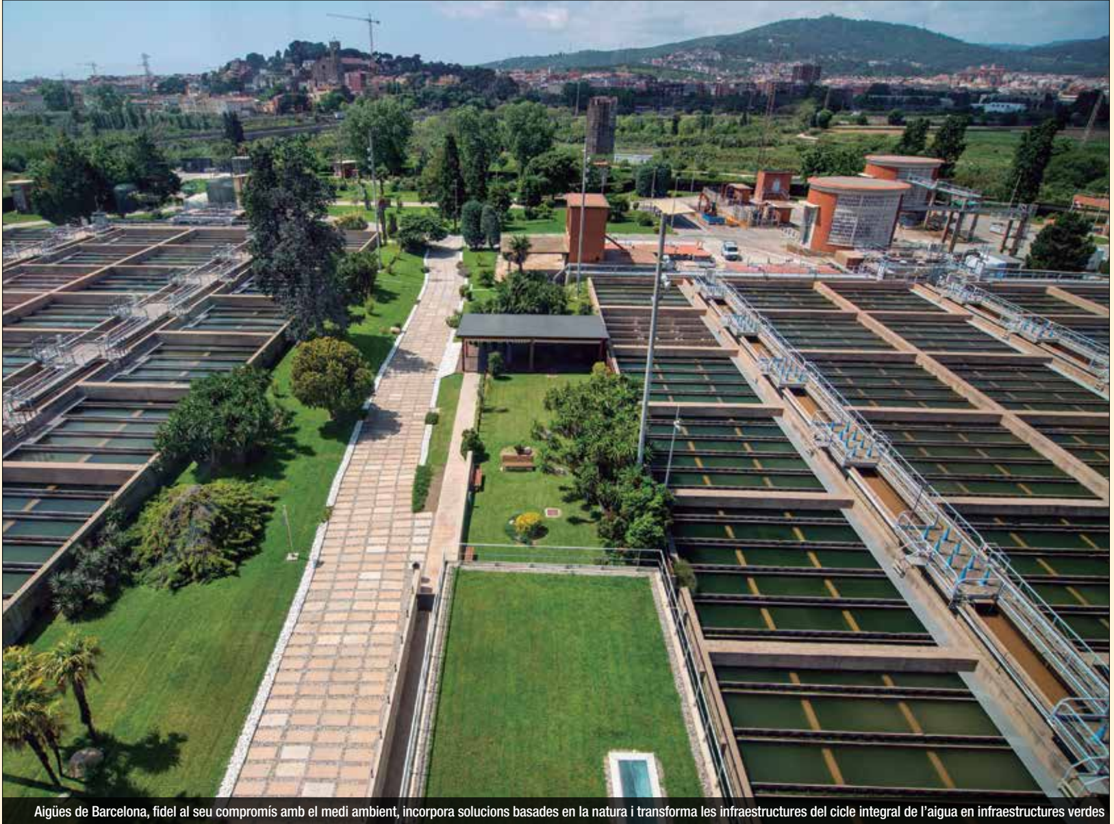
Aigües de Barcelona, fidel al seu compromís amb el medi ambient, incorpora solucions basades en la natura i transforma les infraestructures del cicle integral de l'aigua en infraestructures verdes

Protegir la biodiversitat i lluitar contra l'escalfament global formen part del mateix esforç per garantir el futur de la planeta. La rica varietat de formes de vida del nostre planeta ens proporciona aigua, aire i aliments, és font de coneixement científic i de medicaments, i contribueix a mitigar els efectes del canvi climàtic. Cuidar tots això és la nostra obligació, i a més, és la millor inversió per aconseguir un món més segur, sa i habitable.