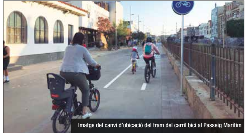
Imatge del canvi d'ubicació del tram del carril bici al Passeig Marítim

La façana marítima disposa des d'aquesta setmana d'un canvi d'ubicació del carril bici entre el carrer del Mar i el carrer de Sant Ignasi de Loiola que millora la connexió en aquest espai més estret del Passeig Marítim. Es tracta del recorregut de 330 metres que se situa paral·lel i a tocar de les vies del tren. El seu itinerari, separat de l'espai