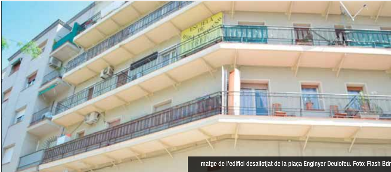
matge de l'edifici desallotjat de la plaça Enginyer Deulofeu.

Part dels veïns no podran tornar fins d'aquí un mes