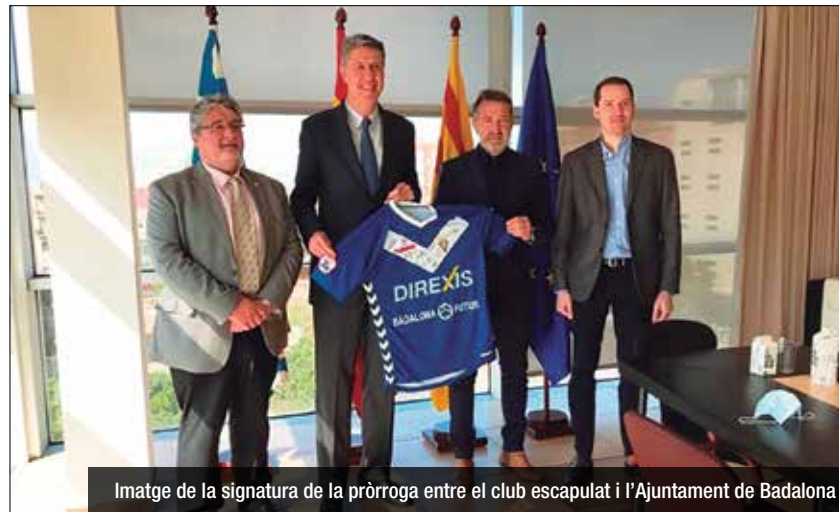
Imatge de la signatura de la pròrroga entre el club escapulat i l'Ajuntament de Badalona

El contracte inclou el lliurament a l'Ajuntament de Badalona de 25 entrades de llotja i de 500 entrades de graderia per a assistir a tots els partits oficials de la temporada en qualsevol de les competicions del primer equip. L'Ajuntament s'encarrega del repartiment d'aquestes entrades entre entitats de la ciutat a través del Servei d'Esports. Aquest repartiment es reprendrà un cop els partits es tornin a celebrar amb presència de públic en l'Estadi municipal.