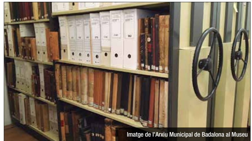
Imatge de l'Arxiu Municipal de Badalona al Museu

L'Arxiu Històric de la Ciutat de Badalona (AHBDN) i l'Arxiu d'Imatges del Museu s'han sumat a la celebració del Dia Internacional dels Arxius (DIA 2020) promogut pel Consell Internacional d'Arxius (CIA/ICA). Els documents que tenia l'avi, els fons d'una empresa de la ciutat, les fotografies d'una entitat veïnal... són un bon exemple de tot allò que guarda un arxiu històric. El treball diari amb aquests documents i la sensibilització en la seva conservació i difusió, contribueixen a refer la història del nostre passat i facilita l'estudi d'especialistes, interessats i curiosos. Atentent l' excepcionalitat que vivim, les activitats d'aquesta edició tenen caràcter virtual. El Museu de