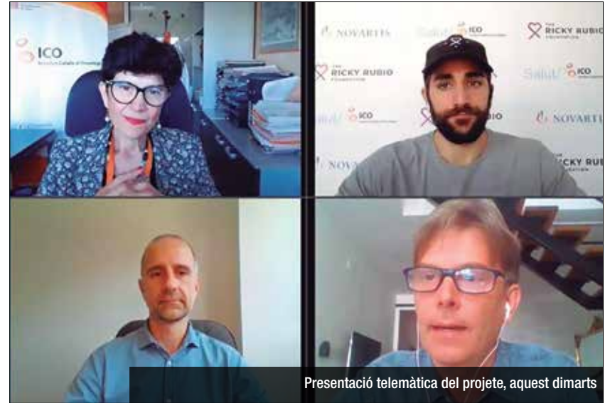
Presentació telemàtica del projecte, aquest dimarts

The Ricky Rubio Foundation, l'Institut Català d'Oncologia a Badalona (ICO) i Novartis han impulsat un projecte per millorar l'atenció i la qualitat de vida de les persones amb càncer. La iniciativa vol contribuir a la “humanització” de l'assistència i els espais destinats a pacients oncològics i els seus familiars, així com a la promoció de l'esport com