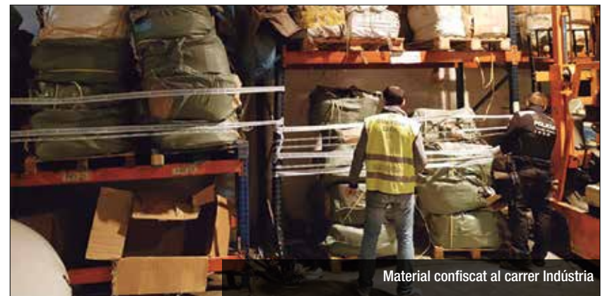
Material confiscat al carrer Indústria

Les corretges falsificades eren de la marca Bimba y Lola