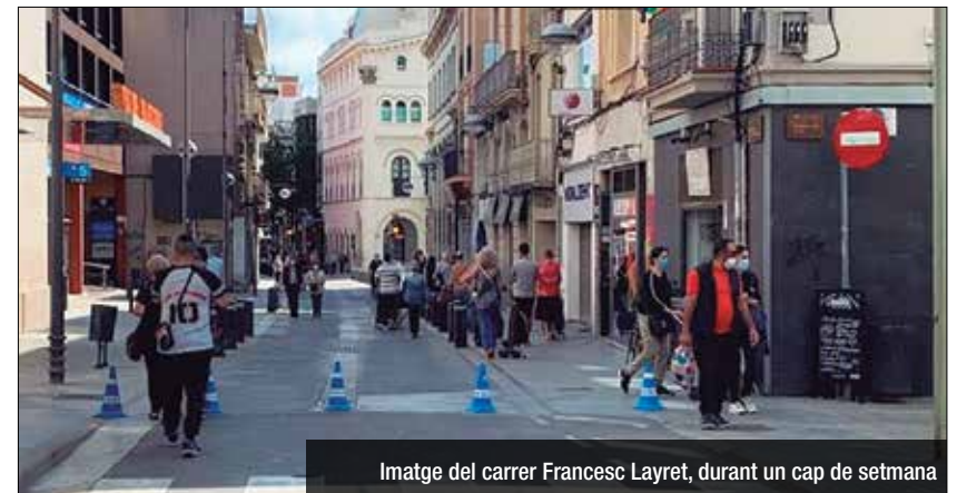
Imatge del carrer Francesc Layret, durant un cap de setmana

Un informe de mobilitat, encarregat per l'Ajuntament de Badalona el 2013, detallava que amb l'obertura del lateral de la C31 es feia tècnicament viable la pacificació del carrer