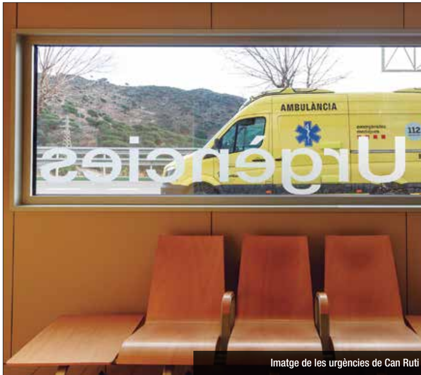
Imatge de les urgències de Can Ruti

L'Hospital Germans Trias i la Direcció d'Atenció Primària de la Metropolitana Nord han impulsat des d'aquest mes de juny un nou marc d'adequació de l'ús dels dispositius d'atenció urgent del territori. La posada en marxa el passat mes de novembre del Centre d'Urgències d'Atenció Primària (CUAP), ubicat al CAP Dr. Robert de Badalona, va suposar un primer estadi d'aquesta coordinació, que ha permès esponjar