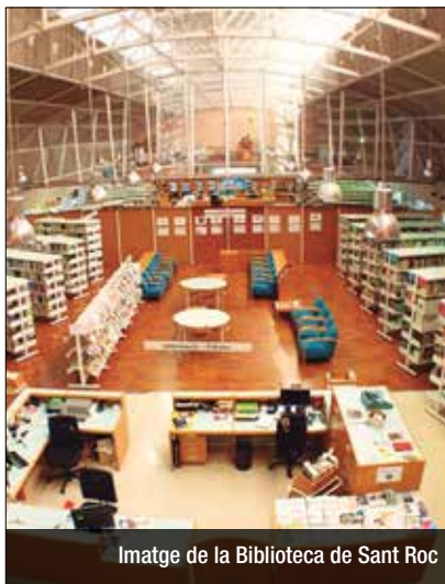
Imatge de la Biblioteca de Sant Roc

Des d'aquesta setmana han obert totes les biblioteques de la Xarxa Municipal de Biblioteques de Badalona tancades des del mes de març a causa de la crisi sanitària ocasionada per la Covid-19. L'única biblioteca que continuarà tancada serà la Biblioteca Central Urbana Can Casacuberta a causa de les per obres de millora en la climatització de l'equipament que s'hi estan fent. L'obertura es fa seguint els protocols establerts a cada fase de desescalada i tenint cura de la salut dels treballadors i treballadores i dels usuaris i usuàries. A partir d'ara la biblioteca Canyonadó i Casagemes – Joan Argenté ampliarà el seu horari i obrirà també pels matins, i la Biblioteca Sant Roc passarà a obrir-se en horari de tarda.