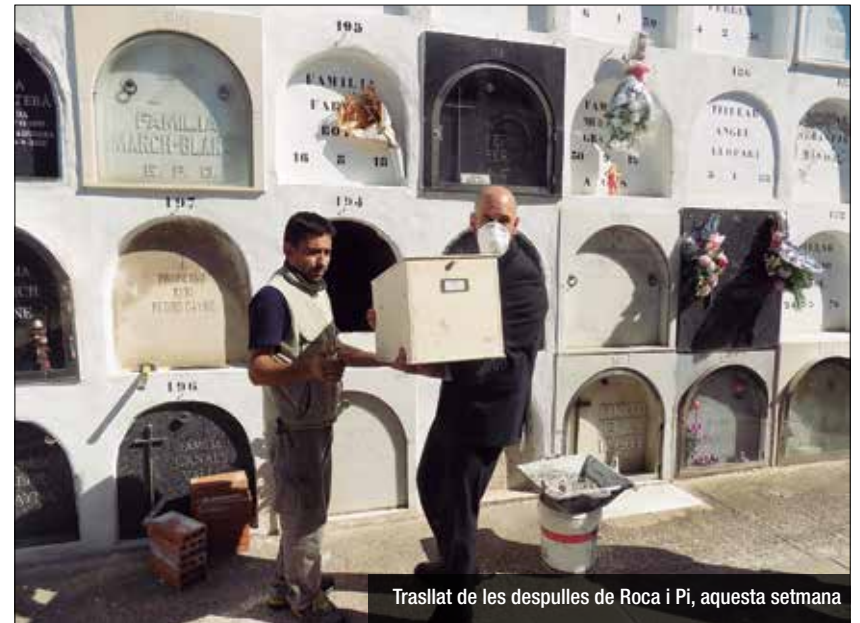
Trasllat de les despulles de Roca i Pi, aquesta setmana

Trasllat des del cementiri de Sant Gervasi