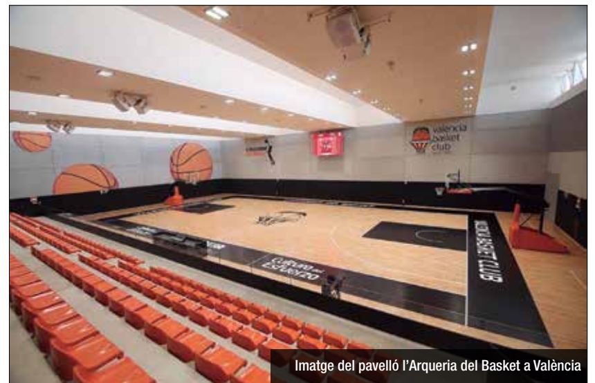
Imatge del pavelló l'Arqueria del Basket a València

Els verd-i-negres ja coneixen el calendari amb tots els enfrontaments