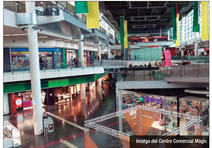
Imatge del Centre Comercial Màgic