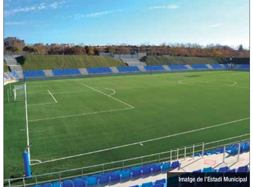
Imatge de l'Estadi Municipal

Els quatre equips que disputaran el play-off d'ascens a Segona B ja han començat a preparar els partits del play-off. Tindran, aproximadament, un mes i mig per fer-ho. I de moment, ho fan amb tots els jugadors, ja que cap d'ells ha donat positiu per covid-19 i, per això, poden entrenar-se sense cap problema seguint tots els protocols de seguretat i prevenció marcats per les autoritats sanitàries i esportives.