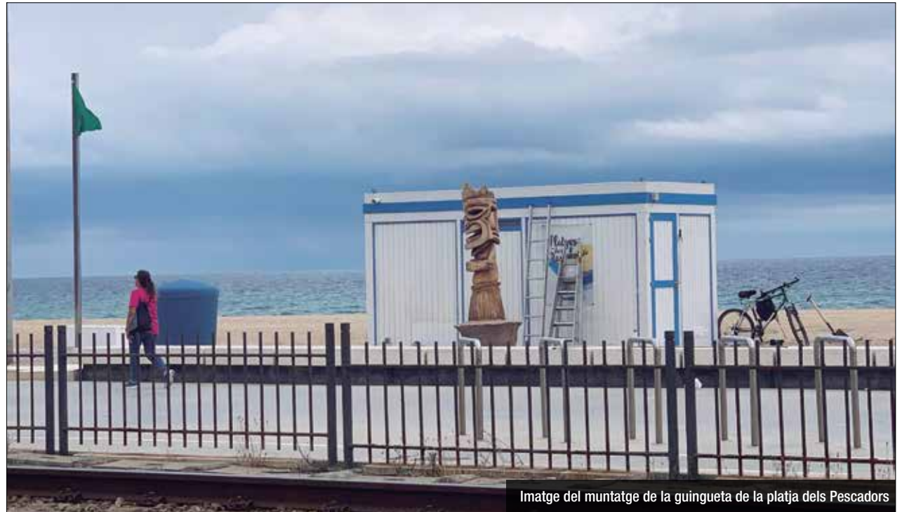
Imatge del muntatge de la guingueta de la platja dels Pescadors

Aquest dijous ha començat, finalment, el muntatge de les guinguetes de la platja de Badalona. En un principi, alguns concessionaris havien anunciat que estaven dubtosos en poder instal·lar-se aquest any perquè amb les condicions actuals havien fet números i no sortia rendible obrir. Els guinguetaires demanaven, entre altres qüestions, el possible allargament de la concessió, un any més, i millors condicions en el pagament d'alguns canons. Finalment, els representants d'aquests establiments i l'Ajuntament han arribat a un acord que facilita la seva instal·lació a les platges de la ciutat i que consisteix en el fet que podran ampliar la durada de la concessió inicial fins a un màxim d'un 15% i, a més, durant aquest estiu també podran ampliar el seu espai un 50% per respectar les mesures de seguretat recomanades per les autoritats sanitàries. A la platja de Badalona, segons l'Ajuntament, poden instal·lar-se fins a 8 establiments de platja. De moment, les primeres ja s'han començat a muntar i esperen obrir el dissabte 20 de juny.