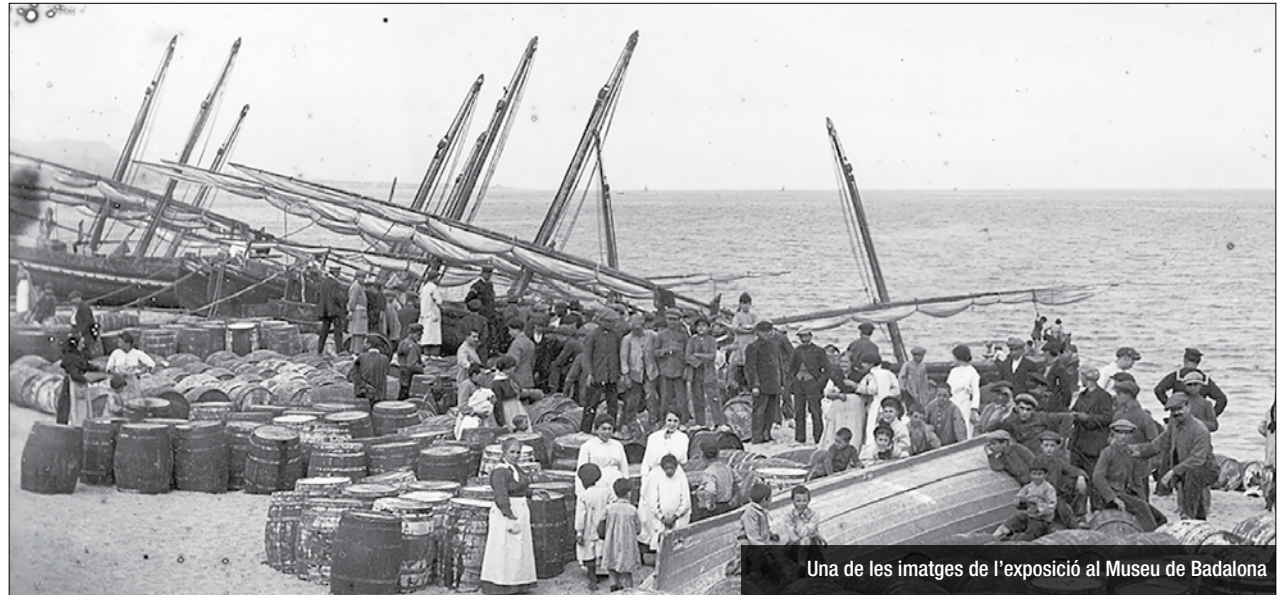
Una de les imatges de l'exposició al Museu de Badalona

A partir del dimarts 16 de juny es podrà veure l'exposició Badalona desconeguda a la planta baixa del Museu. La mostra recull un conjunt de fotografies fetes entre l'últim quart del segle XIX i l'últim quart del XX: cent anys d'intensos canvis per a Badalona, una vila que, en aquest període, es transformarà en ciutat i creixerà de forma gairebé ininterrompuda. Aquest canvi queda molt ben testimoni per les imatges de l'exposició, on podrem veure com la ciutat va ocupant el lloc dels camps i la vida urbana va desplaçant els hàbits rurals. L'entrada a l'exposició és gratuïta i es podrà visitar de dimarts a divendres, de 10 a 14 h i de 17 a 20 h, i els caps de setmana de 10 a 14 h. L'aforament, per l'actual situació sanitària, estarà limitada.