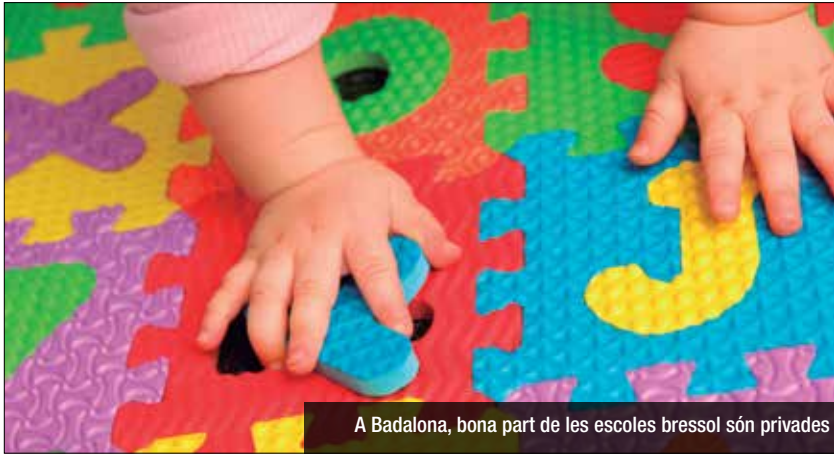
A Badalona, bona part de les escoles bressol són privades

Les llars bressol privades consideren inviables les condicions per reobrir