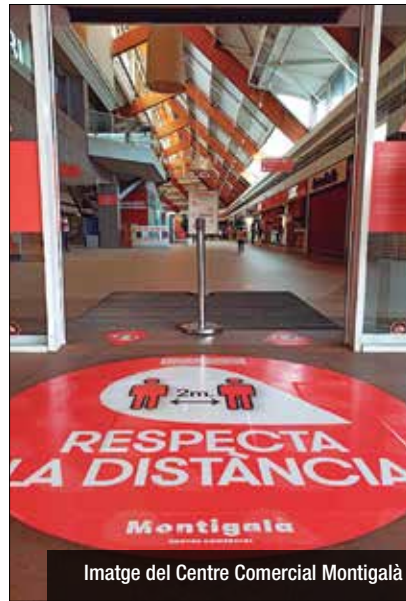
Imatge del Centre Comercial Montigalà

Els centres comercials de la ciutat, com el Màgic o el Centre Comercial Montigalà, han tornat a obrir portes aquesta setmana, coincidint amb l'entrada de la regió metropolitana en la Fase 2 de la desescalada progressiva marcada per les autoritats. La majoria d'establiments no essencials han anat recuperant la normalitat i han obert gradualment, seguint les mesures marcades i pautes de seguretat, com ara limitació d'aforaments i neteja i desinfecció dels espais perquè tots els clients puguin tornar a gaudir del centre comercial en les millors condicions. Al Màgic han començat la campanya 'Màgic et cuida' per remarcar la seguretat amb la qual es pot acudir a les seves instal·lacions, on des de fa setmanes s'ha treballat incansablement per lluitar contra la propagació de la Covid-19. Per la seva part, el Centre Comercial Montigalà ha incrementat la seguretat dels seus clients a través de la posada en marxa de diferents mesures com el reforç de les tasques de ventilació, la intensificació de les desinfeccions diàries —es realitzen entre quatre i sis actuacions— en totes les instal·lacions, controls d'accés, aforament, l'habilitació de punts amb dispensadors de gel hidroalcohòlic i la utilització de tots els canals de comunicació amb recomanacions de seguretat.