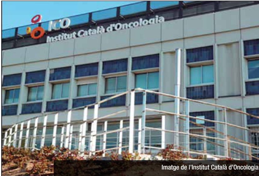
Imatge de l'Institut Català d'Oncologia

Es crearà una sala que oferirà acompanyament emocional a pacients i familiars