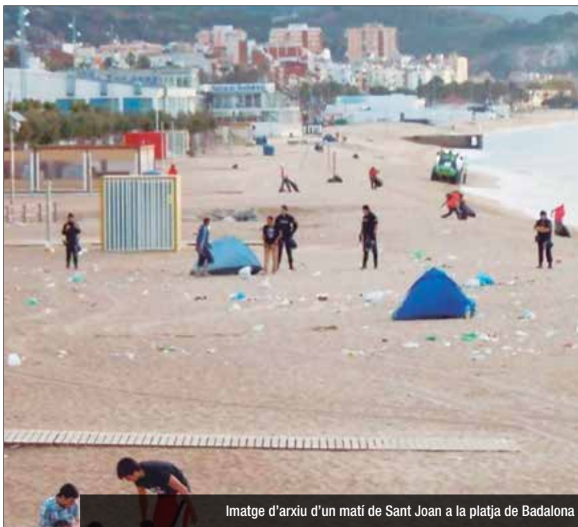
Imatge d'arxiu d'un matí de Sant Joan a la platja de Badalona

Albiol demana a Colau consensuar amb la resta de municipis metropolitans aquesta qüestió