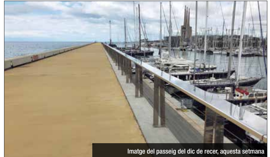
Imatge del passeig del dic de recer, aquesta setmana

lor "groc-platja" característic. Pel que fa a les baranes, s'han reposat o substituït els passamans amb noves peces d'acer inoxidable, igual com s'ha procedit amb els fils tensors. Aquesta renovació s'ha estès també al tram de passamà del passeig que discorre a sobre dels establiments de restauració que mantenia la fusta original. Aquesta acció, situada en el Pla de Manteniment del Port programa la substitució progressiva de l'element fusta per materials més resistents a l'exposició i el desgast de l'ambient marí (acer corten i inoxidable). Tanmateix, en el marc d'aquestes actuacions, la propera serà la renovació i millora dels paviments del Moll Lima i de l'aparcament central del Moll Nord. Les dues accions es programaran quan finalitzin els treballs de reposició i reforç dels elements de defensa del