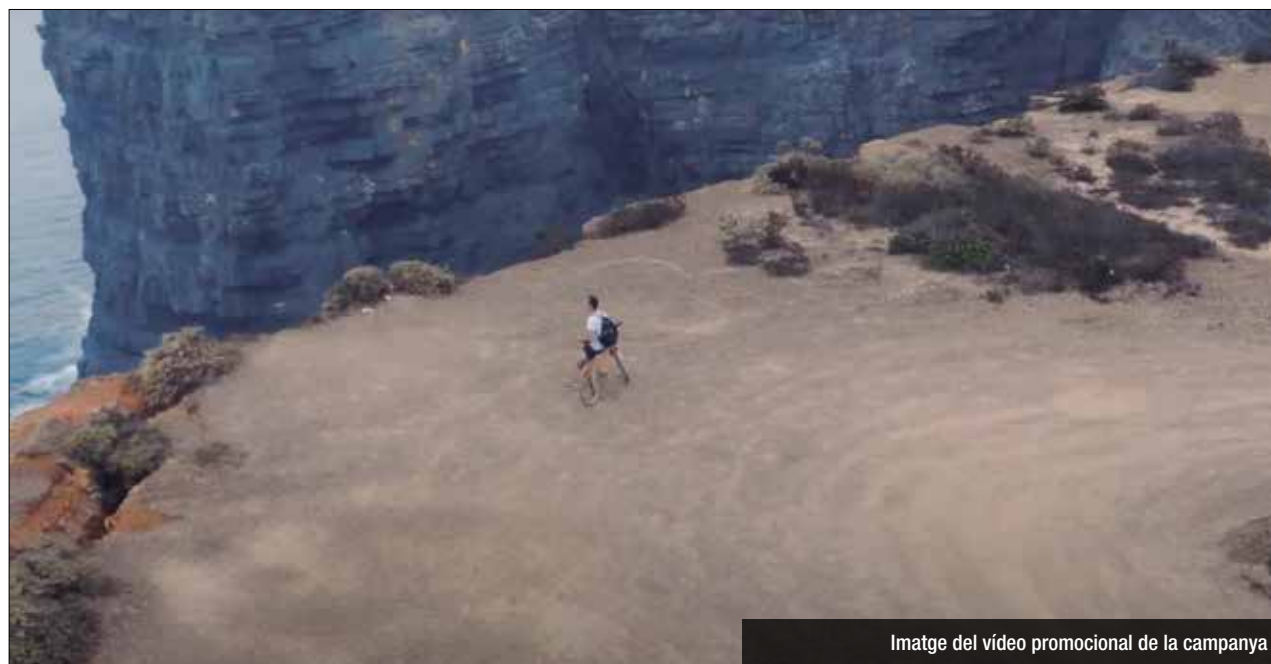
Imatge del vídeo promocional de la campanya

I club m'ha donat suport fent una ambiciosa aportació d'aliments i Funbikes ha col·laborat posant a punt la bicicleta i ocupant-se de tot el tema de mecànica i prevenció de reparacions.