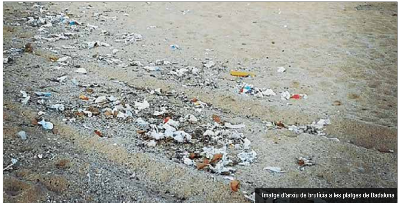
Imatge d'arxiu de brutícia a les platges de Badalona

Segons Ecologistes en Acció, el pèssim disseny de la xarxa de clavegueram i la insuficient capacitat del sistema provoquen una sobresaturació del clavegueram en dies de pluja i, de vegades, també sense pluja. Plàstics, restes d'animals morts i escombraries de tota mena arri-