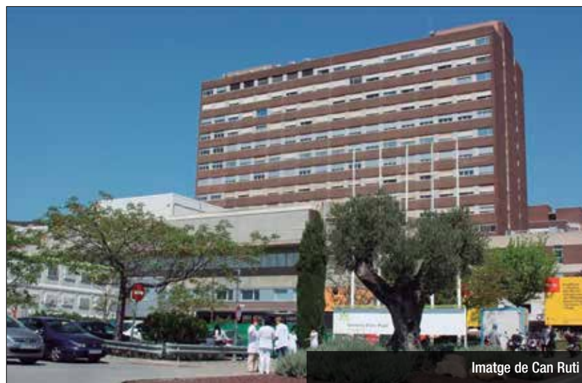
Imatge de Can Ruti

Segons la Generalitat, al setembre ja s'haurà recuperat l'activitat ajornada que era més urgent. La resta s'haurà de recuperar durant el 2020, el 2021 i potser un tram del 2022. De cara a les properes setmanes, el