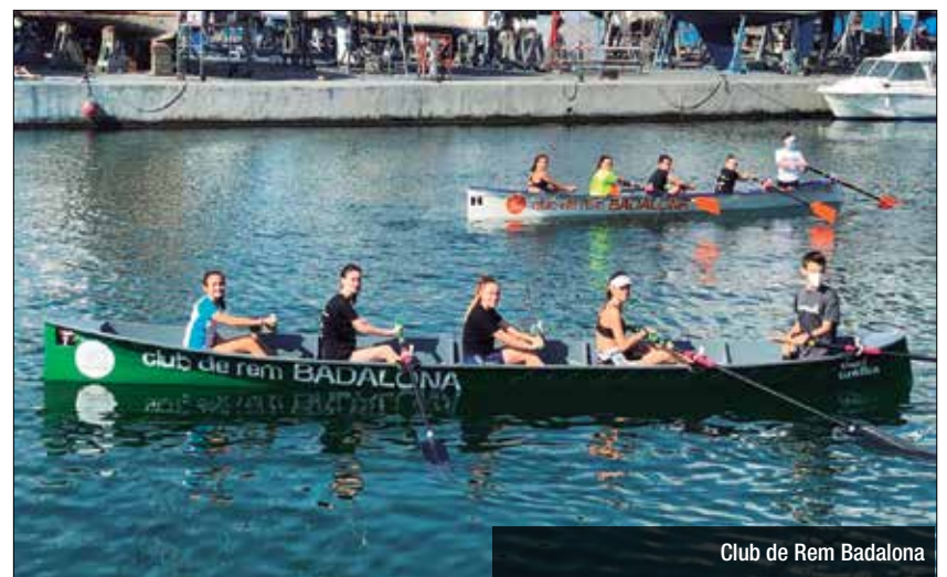
Club de Rem Badalona

Diferent sort han corregut els nedadors del Club Natació Badalona, els quals han rebut la notícia que la Piscina Municipal Mireia Belmonte no obrirà les portes fins al mes de setembre. Aquest tancament ha provocat que els més veterans del club s'hagin hagut de desplaçar a la localitat maresmenca del Masnou per poder practicar el seu esport.