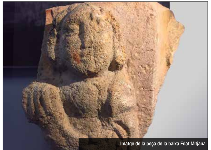
Imatge de la peça de la baixa Edat Mitjana

Durant el darrer any s'han fet diverses ins-