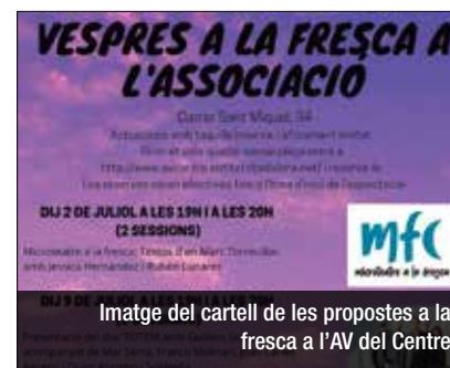
Imatge del cartell de les propostes a la fresca a l'AV del Centre

possibilitat de poder reservar les entrades a través del web de l'entitat. http://www.avcentre.entitatsbadalona.net/ . La primera proposta serà amb microteatre a la fresca amb textos de Marc Torrecillas. El dijous 16, a les 19h, hi haurà la presentació del disc Cants de resistència. De cara al 23 de juliol, a les 19h, arribarà la màgia amb el mag badaloní Enric Magoo.