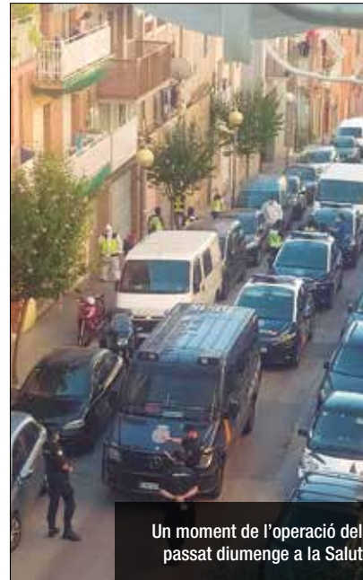
Un moment de l'operació del passat diumenge a la Salut

La investigació l'ha executat la Brigada Provincial d'Informació de Barcelona coordinada per la Comissaria General d'Informació i sota la supervisió del Jutjat Central d'Instrucció número 3 i la Fiscalia de l'Audiència Nacional. Els tres arrestats van passar a disposició judicial i el magistrat en va decretar l'ingrés a presó. En últims mesos, i especialment durant