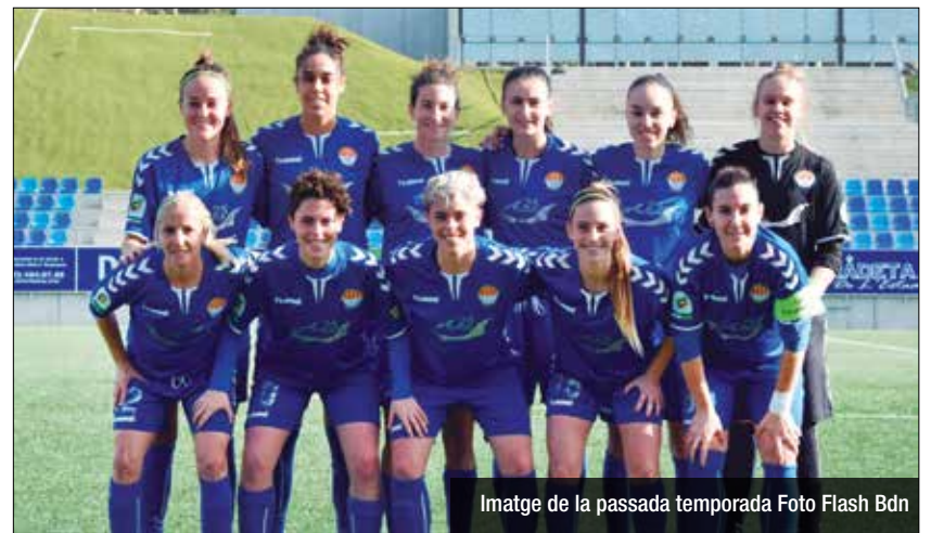
Imatge de la passada temporada

En els pròxims dies es comunicaran la resta d'incorporacions, en un nou projecte que neix amb el repte de superar la gran temporada 2019-2020, la qual no es va poder culminar com a conseqüència de la pandèmia.