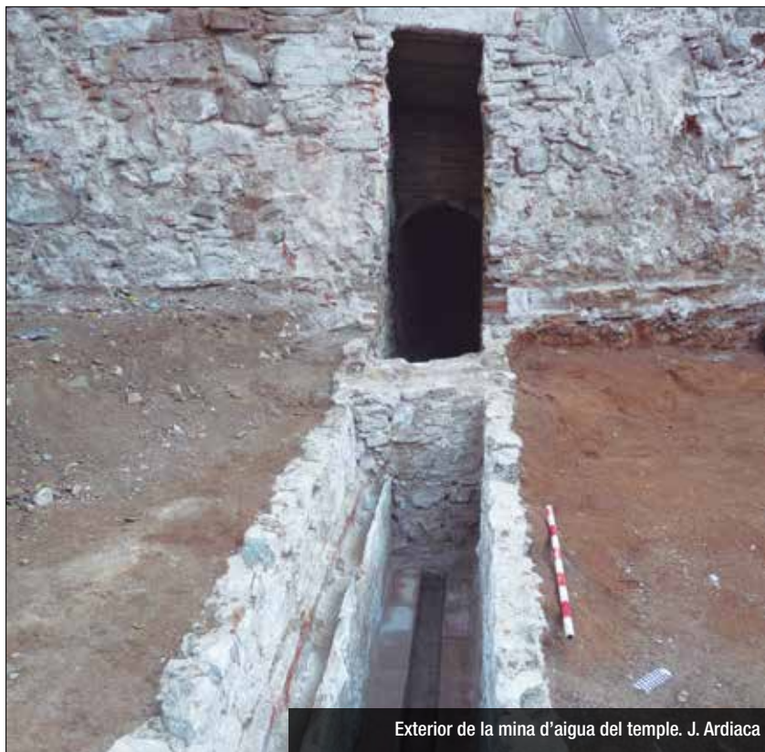
Exterior de la mina d'aigua del temple. J. Ardiaca