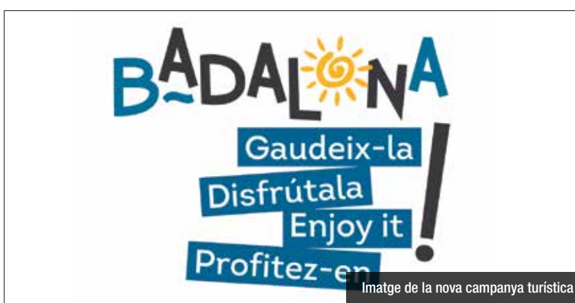
Imatge de la nova campanya turística

Es vol potenciar el litoral i els atractius turístics de la ciutat