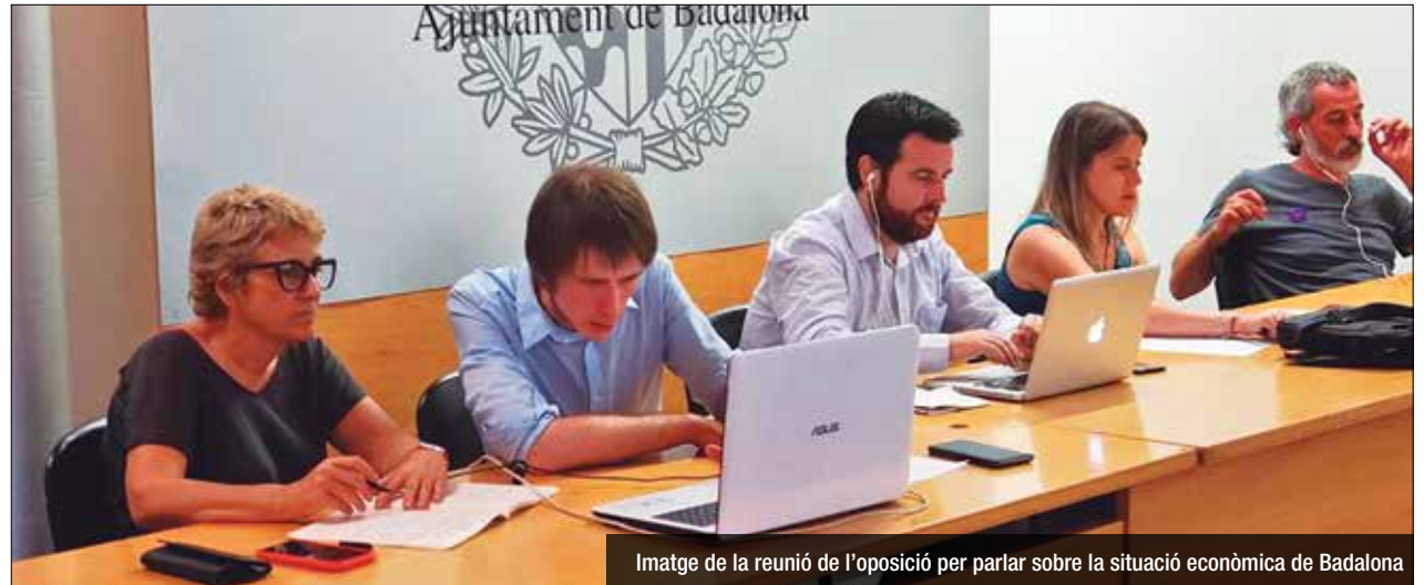
Imatge de la reunió de l'oposició per parlar sobre la situació econòmica de Badalona

Tots els blocs de l'oposició, sense el PP, van reunir-se la setmana passada amb diverses entitats econòmiques de la ciutat per tal de posar sobre la taula quines mesures urgents necessita Badalona després del confinament. Tots els partits, PSC, Guanyem, ERC, En Comú Podem i Junts van coincidir a demanar un pla al govern local i convocar el Consell Econòmic i Social de Badalona. La trobada va ser presencial, per part dels portaveus dels grups municipals, i també temàtica per part de les entitats, com la Federació de Veïns de Badalona (FAVB), l'entitat de restauradors Forquilla Badalona o els Marxants de la ciutat. Entre altres mesures, les entitats econòmiques de la ciutat han demanat un pla econòmic i urgent al govern del PP, tal com s'ha tirat endavant a molts municipis, i la condonació d'al-