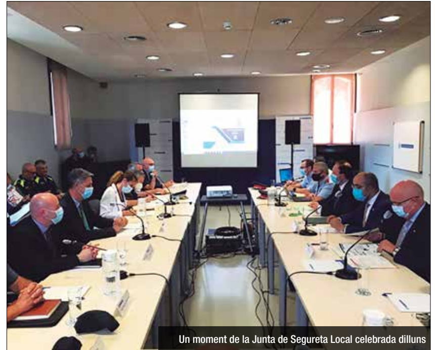
Un moment de la Junta de Segureta Local celebrada dilluns

Aquesta és una de les mesures que preveu el govern de Badalona per intensificar la tendència a la baixa dels fets delictius a Badalona. "Estem millor que la resta de Catalunya, però no estic satisfet i no en tinc suficient", ha afirmat l'alcalde després d'una Junta Local de Seguretat en la que ha participat el conseller d'Interior, Miquel Buch. En aquest sentit, i com ja és habitual en les darreres setmanes, les Juntes Locals de Seguretat que ve presidint el conseller d'Interior a diferents ciutats han anat acompanyades de la petició dels respectius alcaldes d'augmentar la presència d'agents dels Mossos d'Esquadra. En tots els casos, Buch ha promès més efectius, a les portes d'una nova graduació d'agents. Després de vuit anys sense la graduació de nous mossos, a finals de juliol sortiran de l'acadèmia uns 750 nous policies que aniran, en bona part, a "reforçar" justament l'àrea metropolitana de Barcelona. Buch he evitat donar xifres de quina distribució es