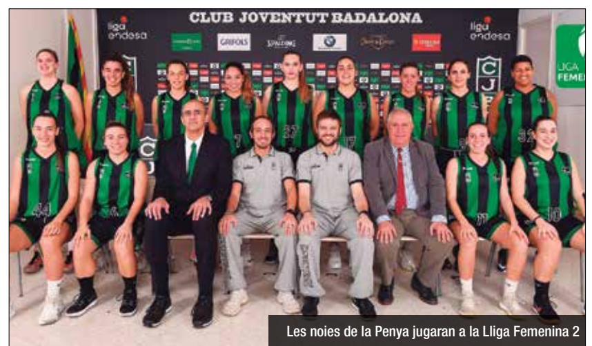
Les noies de la Penya jugaran a la Lliga Femenina 2

la competició, l'equip anava segon del seu grup de Primera Catalana (amb un balanç de 15-4). Gràcies a la bona temporada, el sènior femení va aconseguir una plaça per jugar Copa Catalunya el següent curs. Fa dos anys, el Club Joventut Badalona va donar l'impuls definitiu a la secció femenina, equiparant-la amb l'àrea masculina (elevant a la categoria de Club 5 equips femenins). Ara l'entitat disposa de 15 equips de noies que, combinats amb 6 mixtes, 27 masculins, 1 d'esport adaptat i 2 de diversitat funcional, formen els 51 equips del planter de la Penya.