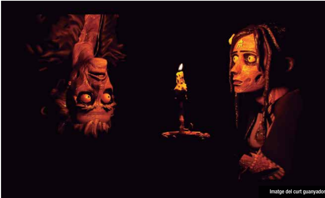
Imatge del curt guanyador

Una stop motion gòtica, fosca, que fa un homenatge al cinema de terror dels anys 50 i 60 i amb una tècnica i fotografia molt cuidada rep el Premi Serra Circular del certamen. Dels 47 curtsmetratges de la Secció Oficial, el jurat del festival ha triat