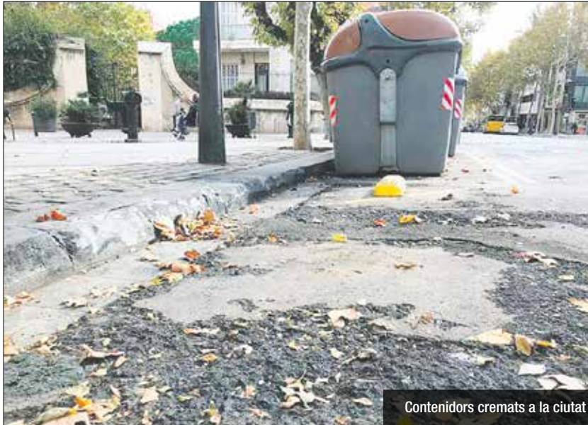
Contenidors cremats a la ciutat

La Guàrdia Urbana de Badalona i els Mossos d'Esquadra estan treballant conjuntament per detenir el piròman que està cremant contenidors a l'àrea metropolitana de Barcelona. Ambdós cossos policials investiguen si hi ha relació entre els incendis de contenidors que s'han produït durant les darreres nits a diverses ciutats metropolitanes com Badalona, Montornès del Vallès o Sabadell, entre d'altres.