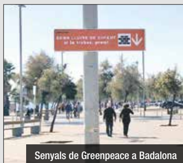
Senyals de Greenpeace a Badalona

Badalona es va despertar dissabte al matí amb nous panells de senyalització urbana en les seves calçades, que indiquen les mancances de la ciutat pel que fa a la seva sostenibilitat. Es tracta d'una iniciativa de voluntaris de Greenpeace, que han col·locat, a més, senyals sota les senyals d'entrada a les ciutats, en les quals es pot llegir 'Ciutat Insostenible. Reinventa la Ciutat'.