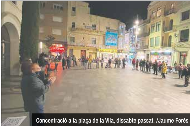
Concentració a la plaça de la Vila, dissabte passat.

A causa de la darrera normativa decretada per la Generalitat de Catalunya, Badalona Cultura s'ha vist aobligada de suspendre tots aquells espectacles previstos als tres teatres municipals de Badalona durant aquestes setmanes. Aquesta mesura, que s'aplica des del passat divendres 30 d'octubre, afecta els espectacles de la programació oficial dels teatres badalonins. En-