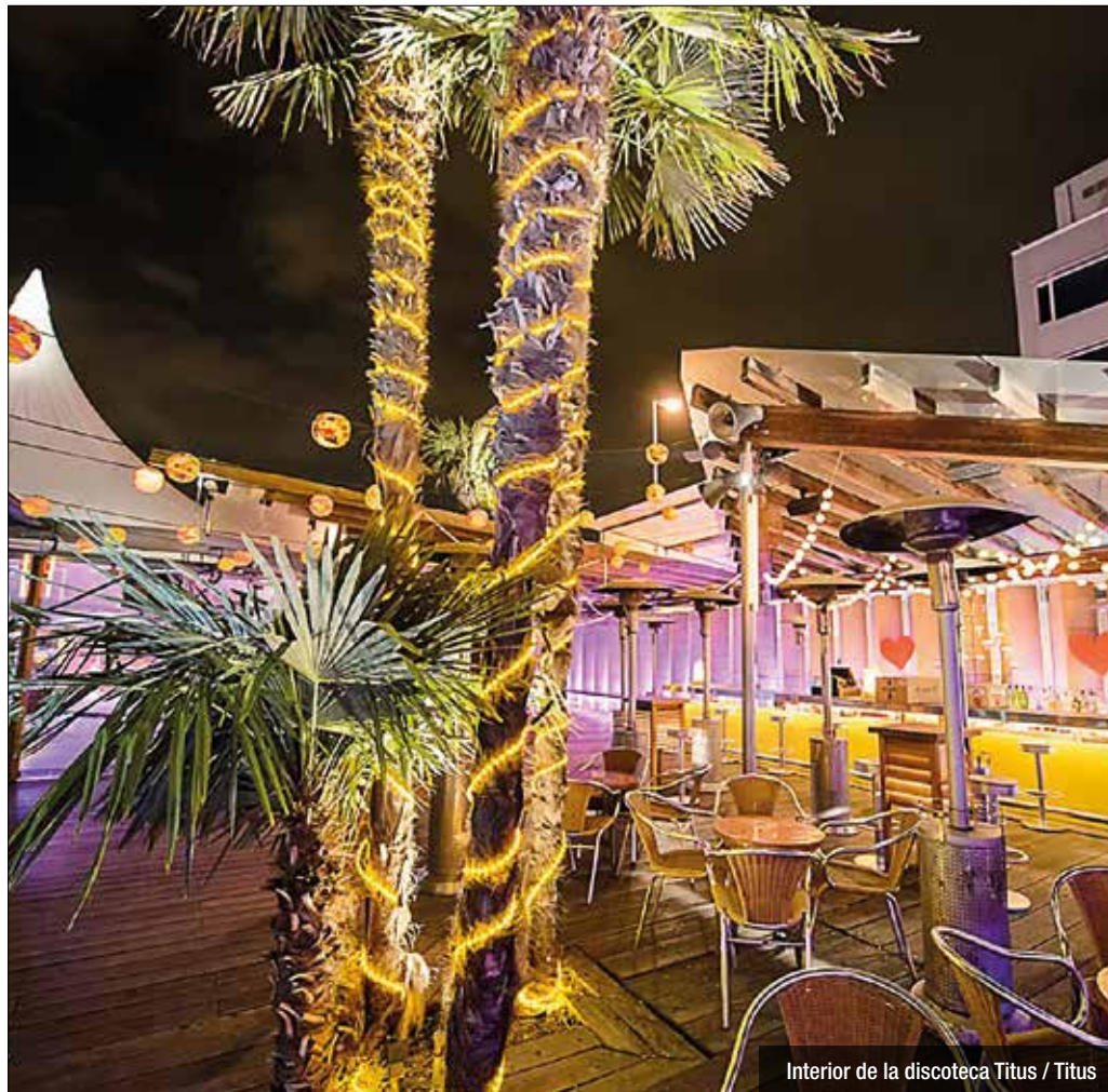
Interior de la discoteca Titus / Titus

on hi consta la data d'inauguració i l'any 2020 acompanyat d'un interrogant com a possible data de tancament. En el marc d'aquesta iniciativa, les sales estatals "icòniques" s'uniran en un concert gratuït i en streaming el 18 de novembre a les 20h, que "podria ser 'L'últim concert'", que es podrà veure al web www.elultimoconcierto.com . Les sales han alertat que la situació és "insostenible" i si les administracions no prenen mesures de "gran importància" en un termini curt o immediat, "és molt probable que la majoria de les sales del país s'enfrontin aquest 2020 a 'L'últim Concert'. Davant d'això, les sales han demanat amb urgència un pla de rescat o la hibernació de despeses fixes, per a poder resistir i continuar oferint música en directe quan la situació sanitària ho permeti i la resta dels espais culturals de pública concurrència recuperi la seva activitat.