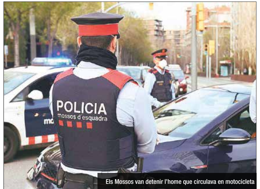
Els Mossos van detenir l'home que circulava en motocicleta

El passat dimarts es va establir un operatiu policial que va permetre localitzar i detenir l'home mentre circulava amb motocicleta pels carrers de Badalona. L'arrestat ja ha reingressat a la presó.