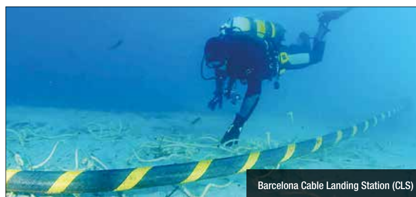
Barcelona Cable Landing Station (CLS)

La Barcelona Cable Landing Station arriba prop de Badalona. Avui mateix, dijous, té lloc a Sant Adrià de Besòs la presentació de la primera estació internacional d'aterratge de cables submarins de tota Catalunya. Es tracta d'una infraestructura estratègica que servirà per a la connexió terrestre de cables submarins de fibra òptica que discorren pel mar Mediterrani. L'estació d'aterratge open port, d'abast internacional, reforçarà el posicionament de Barcelona com a hub tecnològic del Sud d'Europa.