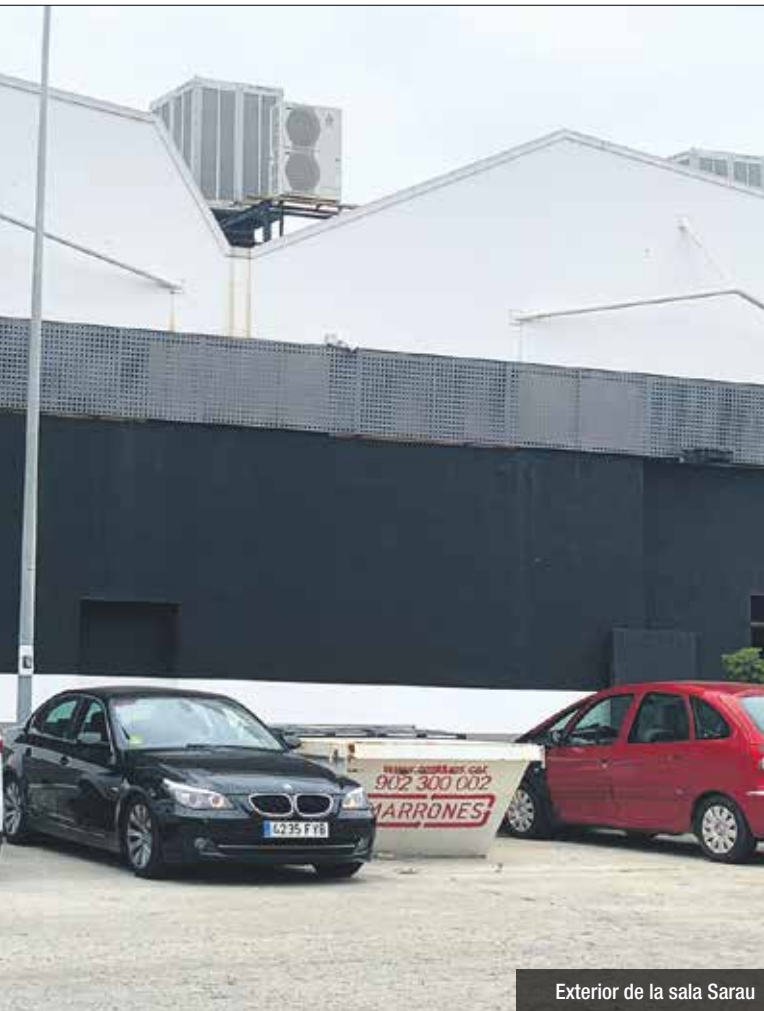
Exterior de la sala Sarau