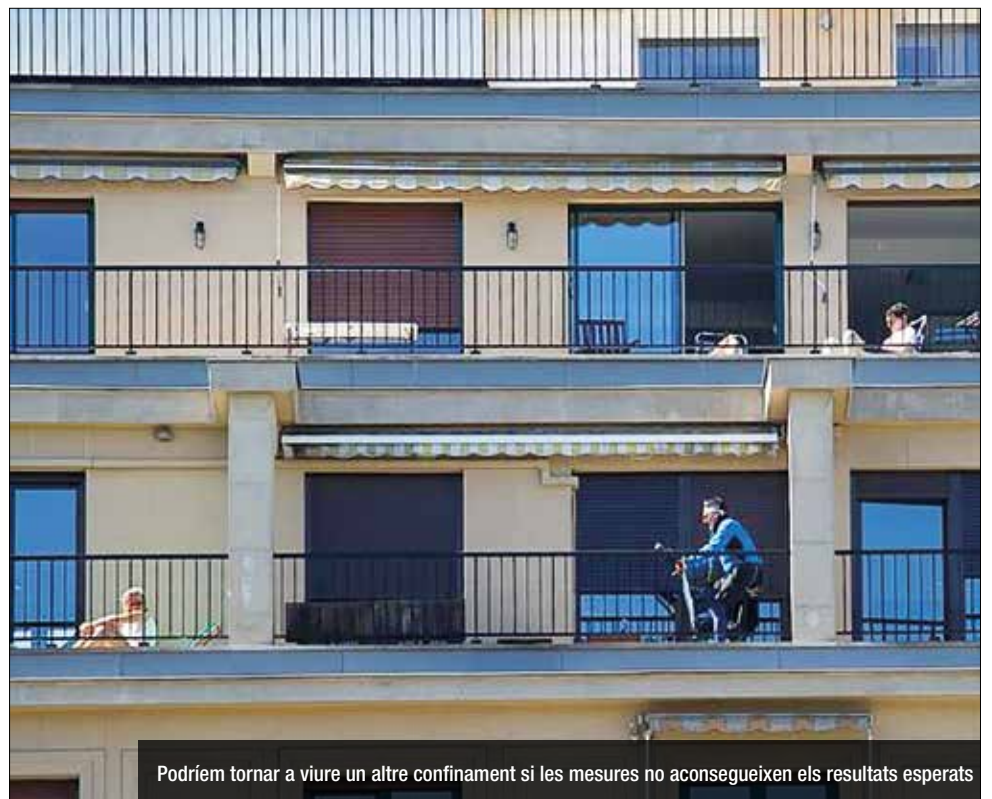
Podríem tornar a viure un altre confinament si les mesures no aconsegueixen els resultats esperats

tricions actuals fins que no s'arribi al pic de contagis i es doblegui la corba i la pressió al sistema sanitari baixi de manera sostinguda i clara. Per a Ramentol, ara cal veure en els propers dies l'impacte dels tres paquets de mesures anunciats en les últimes setmanes -tancament de bars i restaurants; toc de queda nocturn; confinament de Catalunya i per municipis els caps de setmana; suspensió de les activitats culturals i extraescolars, entre altres-. En cas que no funcionin, no descarta el confinament domiciliari, que podria ser, però, diferent al del març.