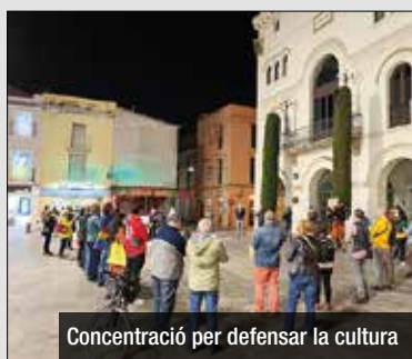
Concentració per defensar la cultura

Dissabte passat la Plaça de la Vila va viure una manifestació més; aquest cop una seixantena de veïns i veïnes de Badalona es concentraven per demanar que es reprenguin les activitats culturals. El lema: #LaCulturaÉsSegura. Més ciutats del voltant han acollit també la protesta i és que denuncien que el sector és un dels més segurs i lliure de la Covid.