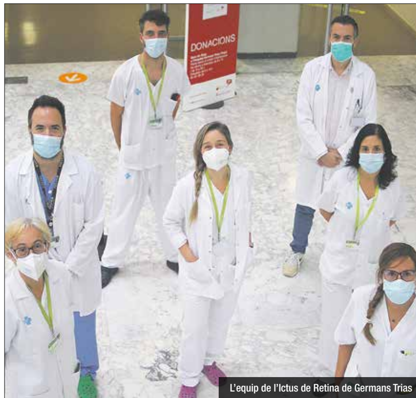
L'equip de l'Ictus de Retina de Germans Trias

Des de la posada en marxa del protocol, s'ha pogut activar el Codi Ictus Retina en un total d'11 pacients gràcies a què van venir a Urgències dins de les primeres 6 h des de l'inici dels símptomes. D'aquests, es va administrar el tractament fibrinolític a un total de 7 pacients, dels quals un 50% va recuperar la visió.