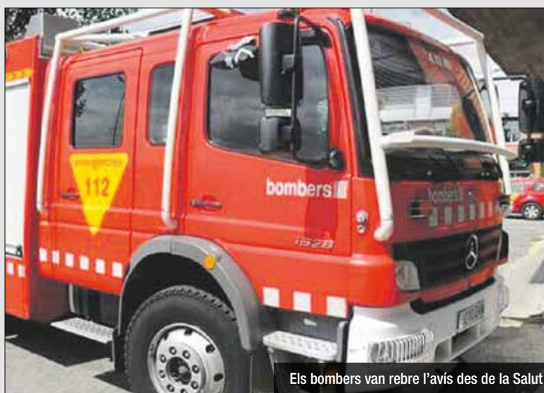
Els bombers van rebre l'avís des de la Salut

La matinada del diumenge es va produir un incendi en un pis del carrer Nàpols, al barri de la Salut. El foc ha afectat un matalàs, un televisor i algun armari de l'habitació d'aquest pis. La resta de