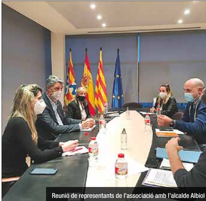
Reunió de representants de l'associació amb l'alcalde Albiol

El govern de Badalona, encapçalat per l'alcalde Xavier Garcia Albiol, han mantingut una trobada aquest dimarts amb representants el Grup de Restauradors de Badalona, For-