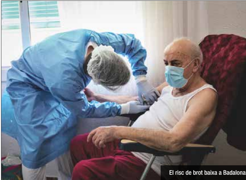
El risc de brot baixa a Badalona

Vam començar la setmana amb un índex molt alt