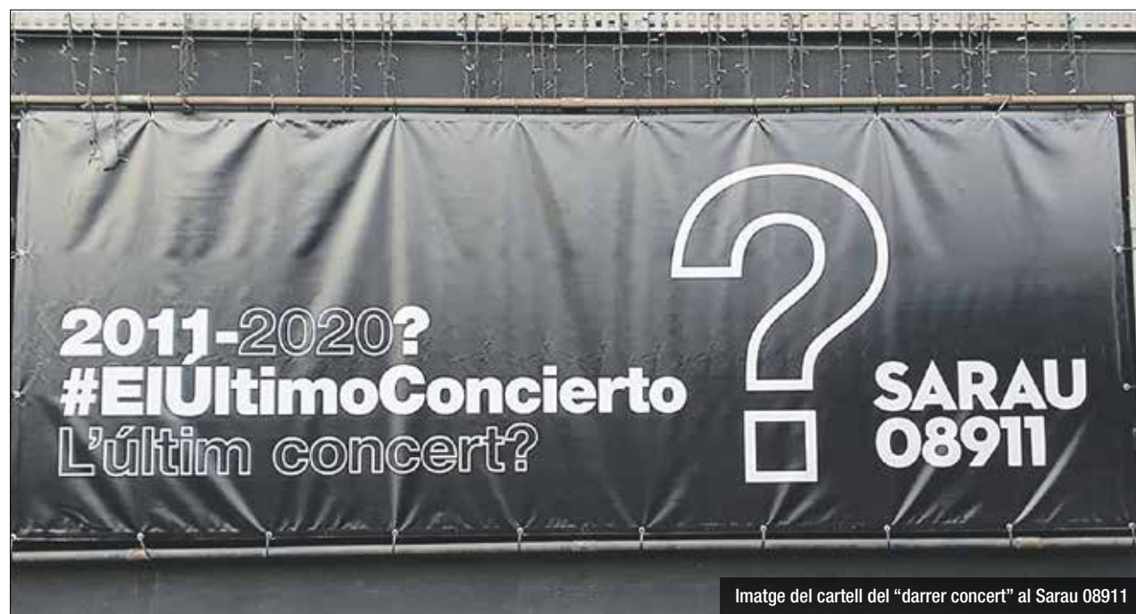
Imatge del cartell del "darrer concert" al Sarau 08911

on hi consta la data d'inauguració i l'any 2020 acompanyat d'un interrogant com a possible data de tancament. En el marc d'aquesta iniciativa, les sales estatals "icòniques" s'uniran en un concert gratuït i en streaming el 18 de novembre a les 20h, que "podria ser 'L'últim concert'", que es podrà veure al web www.elultimoconcierto.com . Les sales han alertat que la situació és "insostenible" i si les administracions no prenen mesures de "gran importància" en un termini curt o immediat, "és molt probable que la majoria de les sales del país s'enfrontin aquest 2020 a 'L'últim Concert'. Davant d'això, les sales han demanat amb urgència un pla de rescat o la hibernació de despeses fixes, per a poder resistir i continuar oferint música en directe quan la situació sanitària ho permeti i la resta dels espais culturals de pública concurrència recuperi la seva activitat.