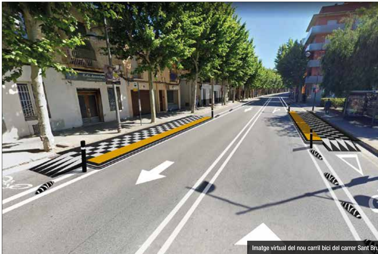
Imatge virtual del nou carril bici del carrer Sant Bru

L'objectiu és ampliar la xarxa ciclable a la ciutat