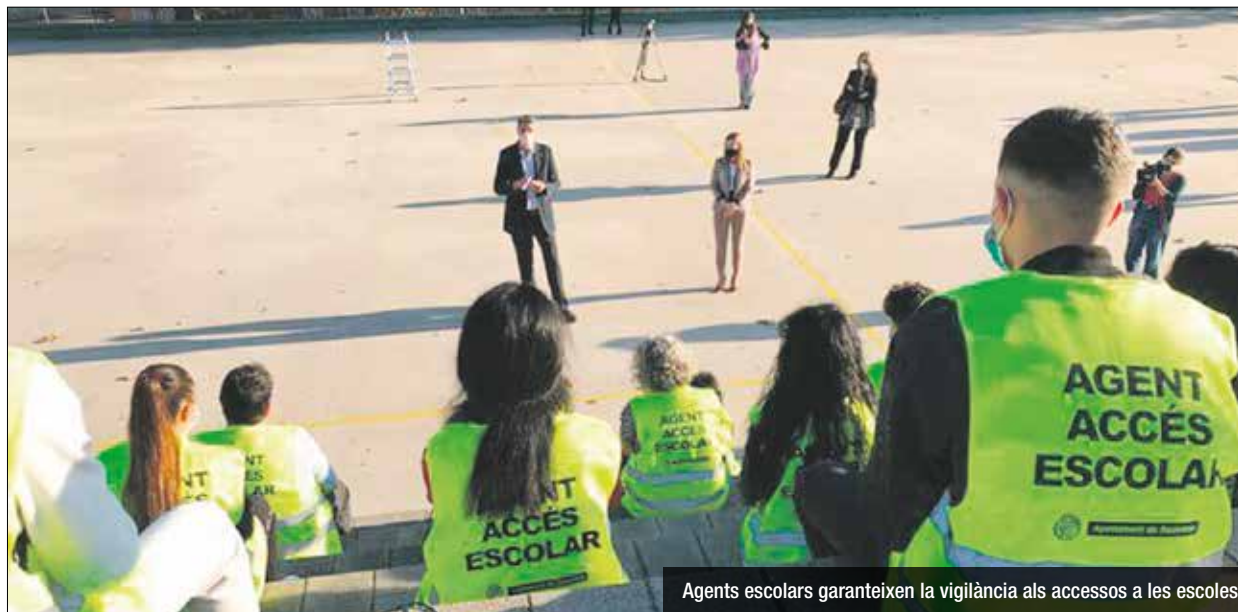
Agents escolars garanteixen la vigilància als accessos a les escoles

Per posar en funcionament el nou servei de suport i vigilància als accessos dels centres educatius s'han contractat 56 persones que faran la funció d'agent. Totes les persones que formen part del servei aniran identificades per fer la seva feina i seran supervisades per tècnics de Protecció Civil i d'Educació de l'Ajuntament de