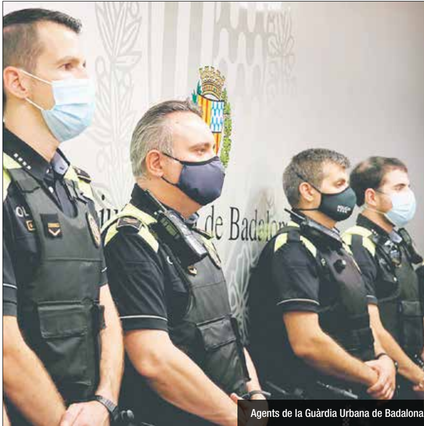
Agents de la Guàrdia Urbana de Badalona

El PP apunta a un "relaxament" a l'hora de dur la mascareta