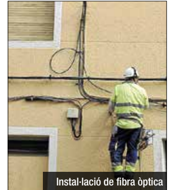
Instal·lació de fibra òptica

El veïnat assegura que s'ha demanat diversos cops a l'Ajuntament aquest permís necessari per acabar d'instal·lar la fibra òptica en tota la totalitat del barri. "Tampoc cap com-