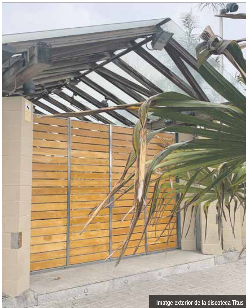
Imatge exterior de la discoteca Titus

Les sales de música en directe de l'Estat, entre elles la Sala Sarau 08911 de Badalona, han desplegat diverses intervencions artístiques a les seves façanes per denunciar la situació crítica del sector pel tancament per la covid-19. Una cinquantena de sales catalanes ha modificat, físicament o digitalment, les seves persianes amb l'etiqueta #elultimoconcerto #ultimconcert,