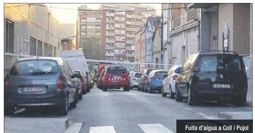
Fuita d'aigua a Coll i Pujol

la tarda, a casa d'uns familiars. Els fets, que van passar a primera hora de la tarda, van ser comunicats als Bombers, on s'hi van traslladar fins a 3 dotacions, a part de la Guàrdia Urbana i tècnics municipals que van avaluar les esquerdes que s'han originat en aquestes cases.