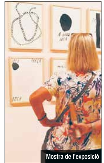
Mostra de l'exposició