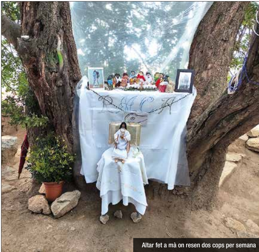
Altar fet a mà on resen dos cops per setmana

Un grup de dones resen sota un arbre on, afirmen, va aparèixer la Verge al 1987