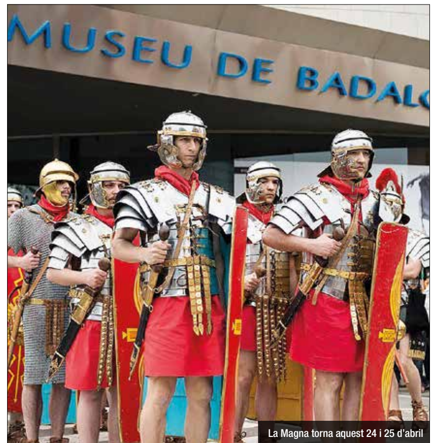
La Magna torna aquest 24 i 25 d'abril

A més dels actes presencials, alguns dels quals es podran seguir en directe pel canal de Youtube del Museu de Badalona, s'han programat diferents continguts (reconstrucció històrica, arqueologia i tallers) que es difondran durant el festival en el web i en els perfils de les xarxes socials del Museu. Enguany, a més, amb motiu de la pandèmia i per garantir la seguretat de participants i de públic, caldrà inscriure's i adquirir les entrades, prèviament, al web del Museu.