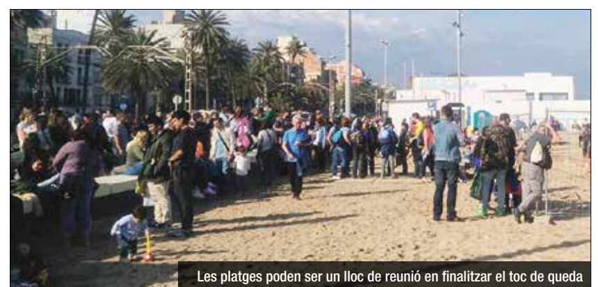
Les platges poden ser un lloc de reunió en finalitzar el toc de queda

En aquesta carta Albiol planteja la situació que pot succeir si la Generalitat decideix seguir amb les actuals mesures de limitació horària de bars i restaurants, ja que "aquest fet acabarà provocant, en horari nocturn, una situació d'enorme complexitat en els carrers i, de manera molt especial i concreta, en les platges". L'alcalde considera que els municipis de l'àrea metropolitana que disposen de platja haurien de coordinar les accions i mesures que acabin prenent-se per evitar situacions i mesures contradictòries.