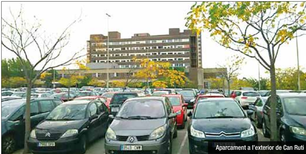
Aparcament a l'exterior de Can Ruti

L'ampliació de l'àrea quirúrgica i de l'espai destinat a l'aparcament centren les principals necessitats de millora de l'entorn de Can Ruti. Així s'ha posat en relleu en la primera reunió per abordar l'avantprojecte de desenvolupament sanitari de la