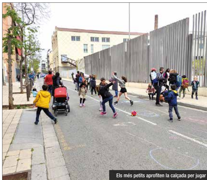
Els més petits aprofiten la calçada per jugar

La iniciativa de la Revolta Escolar es va iniciar a la ciutat de Barcelona al desembre de 2020. Sabadell va ser la següent en promoure aquestes accions i Badalona es va convertir en la tercera ciutat en sumar-se a aquesta causa. L'objectiu és tallar carrers propers a les escoles per demanar entorns escolars pacífics. És a dir, amb menys contaminació, més segurs i amb més soroll. Les escoles Progrés i Ventós Mir són les que inicien aquest moviment a la ciutat, on pares i fills a la sortida del col·legi juguen a la calçada del carrer Indústria i exhibeixen pancartes i missatges reivindicatius. Badalona Port i Gitanjali també han participat en aquest tall de carrer, per tant en total són quatre els centres badalonins que s'hi han adherit. Des de les Associacions de Famílies d'Alumnes d'aquests centres demanen que s'activi la zona de baixes emissions i es limiti la velocitat del carrer entre 20 i 30, ja que els