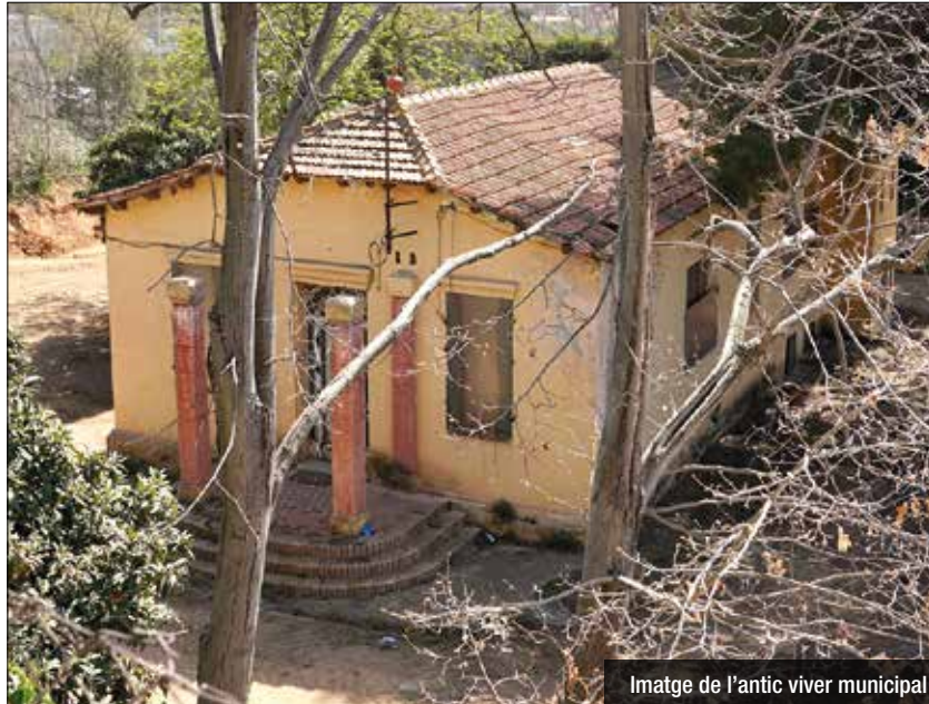
Imatge de l'antic viver municipal

També s'habilitarà un espai pels camions d'escombraries