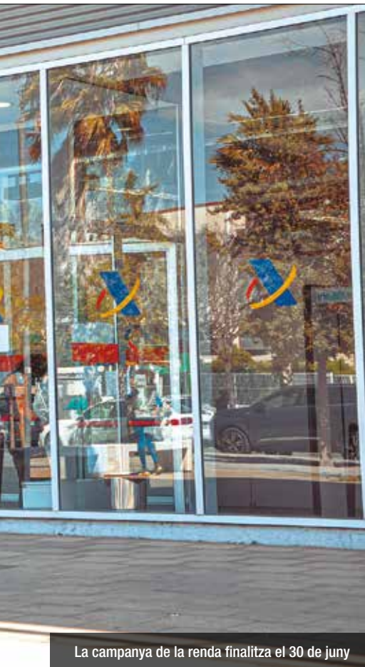
La campanya de la renda finalitza el 30 de juny

hagin pagat per la seva hipoteca durant l'any: un 7,5% en el tram estatal i un 7,5% més en el tram autonòmic. Això sí, la deducció pot aplicar-se sobre una base màxima de 9.040 euros anuals, així que el contribuïent pot deduir fins 1.356 euros com a molt.