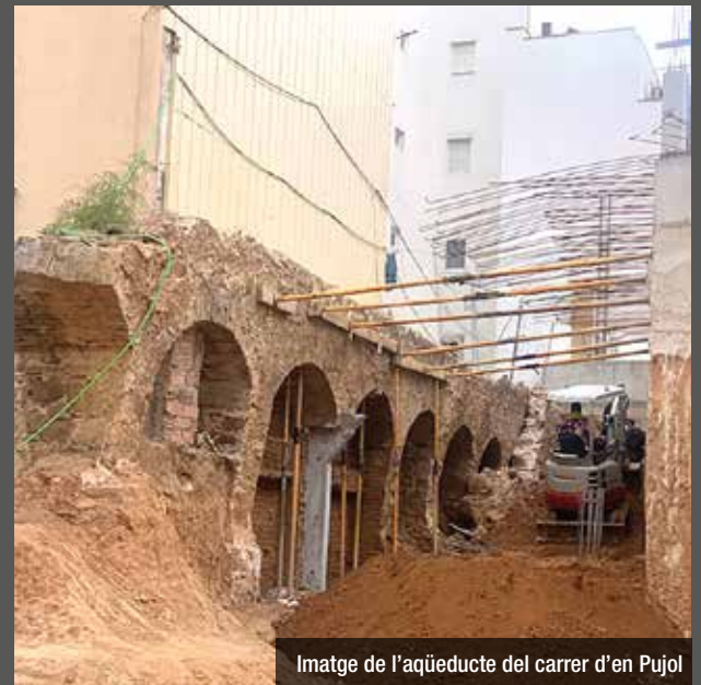
Imatge de l'aqüeducte del carrer d'en Pujol

era visible, però ara les obres han servit per descobrir més metres d'aquest antic aqüeducte que servia per transportar aigua, fins a la zona de la Torre Vella. La intenció és poder conservar part d'aquest aqüeducte.