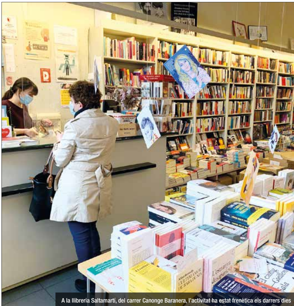
A la llibreria Saltamartí, del carrer Canonge Baranera, l'activitat ha estat frenètica els darrers dies