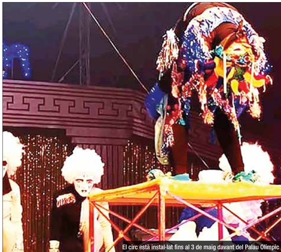
El circ està instal·lat fins al 3 de maig davant del Palau Olímpic

Des del passat divendres, 16 d'abril, està instal·lat un nou circ a la plaça Josep Tarradellas, al Gorg, acabat d'aterrar des de Madrid. Els carrers de la ciutat ja han vist, durant aquests darreres dies, una furgoneta verda, amb una mica de por i un personatge mort al sostre, anunciant aquest espectacle. Un lloc diferent en el qual passar 105 minuts sense interrupcions en una amalgama d'emocions diferents i tan xocants com el riure i la por. Un muntatge familiar en el qual els petits poden integrar-se en un xou, on el públic pot interactuar amb monstres artistes que fan familiaritzar-se amb una àmplia gamma de personatges de sempre del món del terror. El Circo del Terror Familiar estarà a Badalona fins al 3 de maig, només descansarà el 27 d'abril, i podreu veure un circ destinat a tota la família. Podeu consultar horaris i entrades al web https://www.circodelterrorfamiliar.es