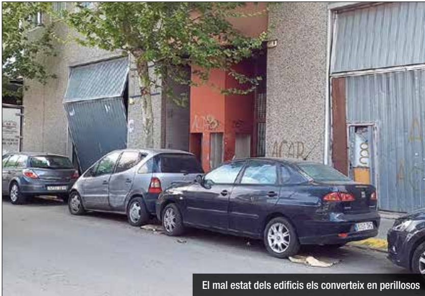
El mal estat dels edificis els converteix en perillosos

Els veïns denuncien brutícia, inseguretat, cotxes abandonats i edificis deteriorats