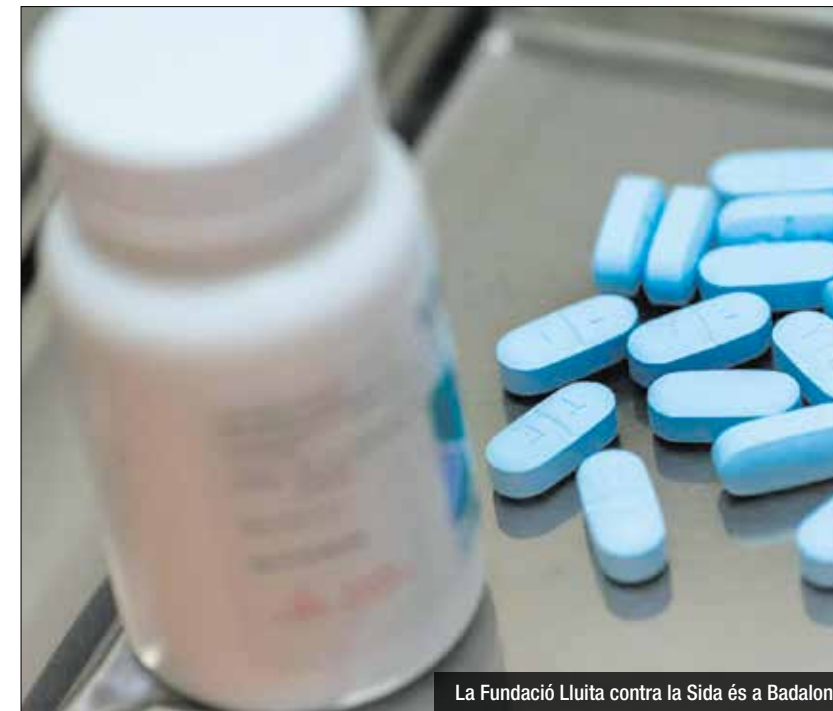
La Fundació Lluita contra la Sida és a Badalona