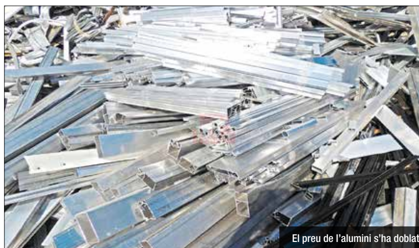
El preu de l'alumini s'ha doblat

des, es venen a les ferrovelleries. El robatori d'una porta de carrer suposa tres grans problemes: reparar la porta pot costar uns 3.000 euros, les assegurances no sempre ho cobreixen i l'edifici en qüestió pot estar mínim tres setmanes sense porta. L'abril del 2020, la tona d'alumini valia menys de 1.500 dòlars. Actualment supera els 3.300. La Xina, igual que amb els microxips, ha decidit fabricar-ne menys.