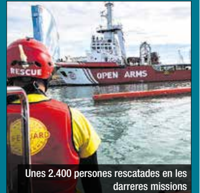
Unes 2.400 persones rescatades en les darreres missions

Open Arms: el canvi climàtic crearà 150 milions de refugiats