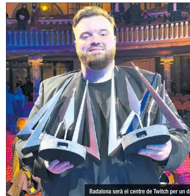
Badalona serà el centre de Twitch per un dia

Se celebrarà a l'Olimpíic el 25 de juny i amb públic