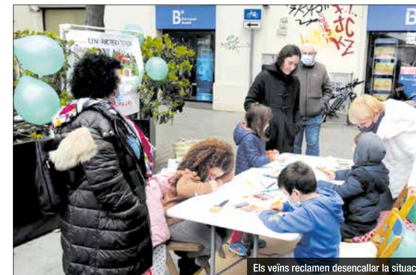
Els veïns reclamen desencallar la situació

interí forma part de la plantilla estructural dels centres i no és personal eventual", afirma el Catac en un comunicat. "En conseqüència, és evident que al personal interí per vacant no se li pot aplicar el règim de personal eventual, ni pot ser discriminat per un criteri que vol imposar les vacances i els dies de lleure", afegeix. "Al personal no se li pot dir amb 5 dies d'antelació que comencen les seves vacances, l'obligatorietat d'agafar 10 o 20 i posar un règim de lliurances de cap de setmana diferent de la resta", sentència l'escrit.