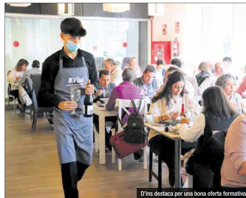
D'ins destaca per una bona oferta formativa

Durant els mesos de tancament de la restauració al llarg de la pandèmia, el projecte