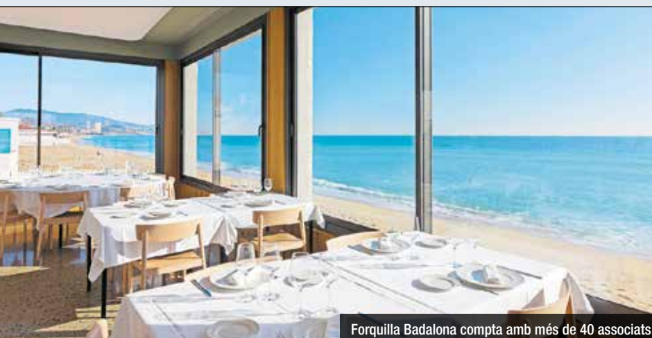
Forquilla Badalona compta amb més de 40 associats

relació dels diferents governs municipals dels darrers anys. El veto del govern anterior, amenaces rebudes per part de companys del sector pel simple fet de ser crítics i la decepció amb el nou govern formen part de la llista de raons per plegar. Des de Forquilla Badalona s'entén que fan nosa; i que no interessa que una organització crítica i reivindicativa segueixi activa. També s'apunta que no s'ha aconseguit ser del tot útils i es fa autocrítica en aquest sentit. La presentació del pla de govern va ser un dels punts culminants per prendre la decisió de dir "fins aquí", ja que Forquilla entén que la majoria de reunions prèvies per explicar la situació del sector no van servir de massa. L'associació celebra, però, haver aconseguit fites com els nous horaris de terrasses i les ajudes a locals sense terrassa, i també el fet de crear iniciatives com la del llibre de Sant Jordi, les campanyes de finançament d'investigació per Can Ruti o el projecte de recollida d'oli per cuinar implantat a Badalona i que opta a un premi europeu.