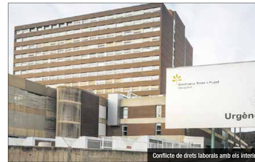
Conflicte de drets laborals amb els interins

ra, el Ple va aprovar tot i el vot contrari del PP l'elaboració d'unes noves bases pels Premis Literaris Ciutat de Badalona. Fa mig any, el PP i el PSC van aprovar crear una categoria en llengua castellana, proposta que ara queda anul·lada. El govern afirma ara que vol establir nous criteris i donar un nou impuls a uns premis que estaven "perdent qualitat"