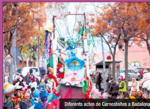
Diferents actes de Carnestoltes a Badalona

La XL Rua de Carnestoltes de Badalona tindrà lloc el dissabte 26 de febrer a Llefià, a partir de les 17h amb inici a Torre Mena (C/Reus/PI Amistat). Les inscripcions de les comparses es poden realitzar fins al divendres 25 fins a les 17h, a través del formulari que us