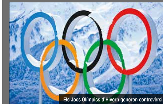
Els Jocs Olímpics d'Hivern generen controvèrsia

la neu només podrà existir al Pirineu de forma artificial i que les estacions d'esquí del territori no són rendibles econòmicament. De la mateixa manera, alerten que el consum d'aigua per a la producció de neu disminueix la disponibilitat per a altres usos i tindrà un fort impacte en els aqüífers, i que l'augment del turisme tindrà un impacte devastador sobre la biodiversitat de les zones de muntanya. Recordem que la Generalitat ha plantejat el Palau Olímpic de Badalona com a possible seu de les competicions de gel.