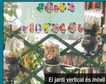
El jardí vertical és mòbil

A mitjans de gener, operaris de l'Ajuntament van retirar sense avisar el jardí vertical que els usuaris del Centre de Dia Janus havien creat des de feia 5 anys a la plaça Font i Cussó, a Dalt la Vila. El jardí s'havia instal·lat en diferents baranes i cartells. Després de prop d'un mes sense ni rastre de les plantes, des del Centre de Dia Janus han completat la construcció d'un nou jardí vertical, però en aquest cas mòbil. Tenir cura del jardí és una activitat que apassiona als usuaris del centre i la volen recuperar.