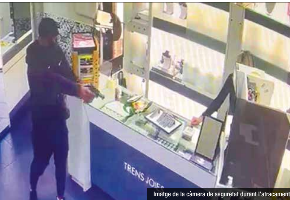
Imatge de la càmera de seguretat durant l'atracament