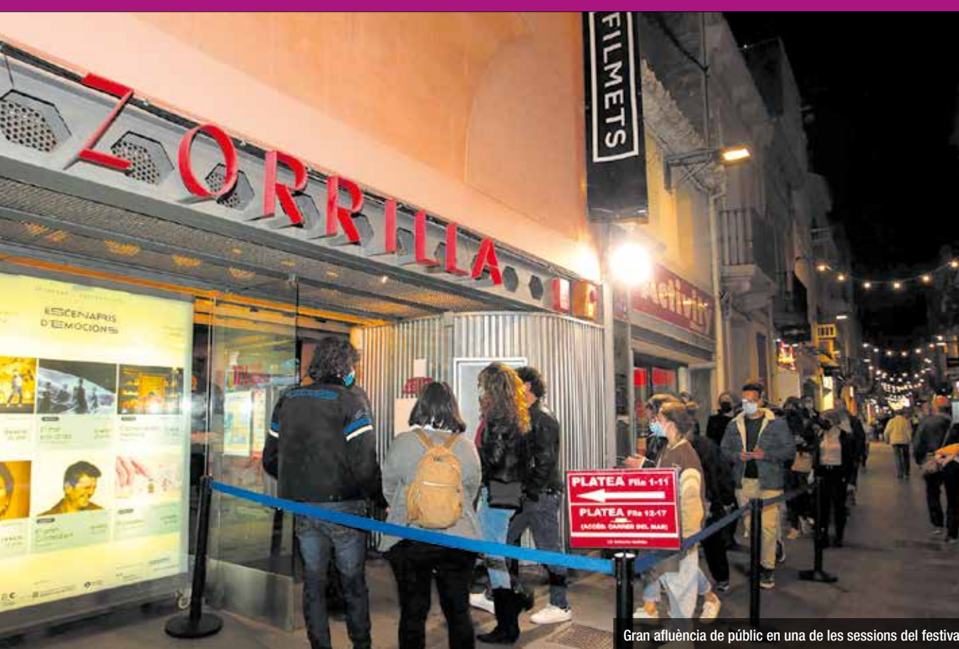
Gran afuïncia de públic en una de les sessions del festival

format competitiu: una forma de tenir a l'espectador atent en tot moment.