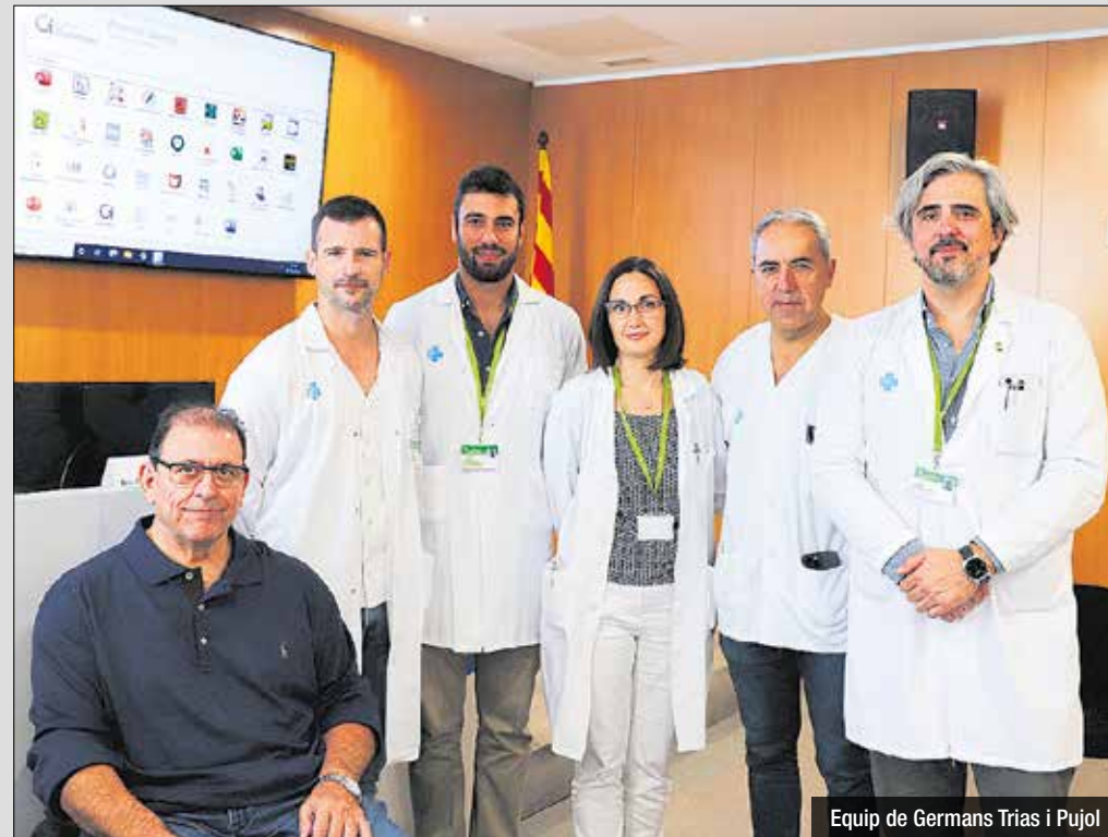
Equip de Germans Trias i Pujol

L'obesitat és molt freqüent després d'una lesió de medul·la espinal. Més del 60% de la població amb lesió medul·lar té sobrepès o obesitat. Les causes d'aquesta elevada freqüència són múltiples i complexos, ja que intervien factors físics, fisiològics, psicològics i socials que afecten la ingesta d'aliments, l'activitat física, el metabolisme i, per tant, el pes corporal.