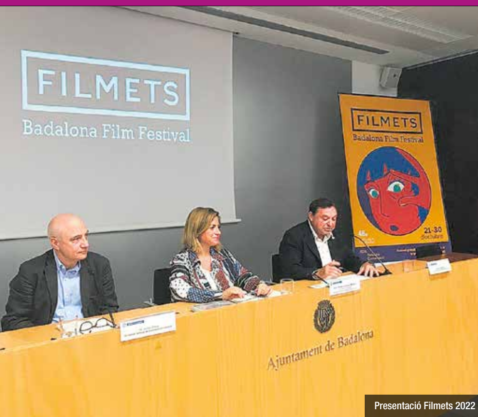
Presentació Filmets 2022