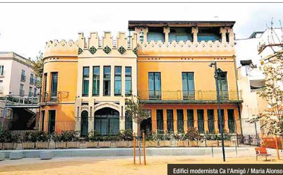
Edifici modernista Ca l'Amigó / Maria Alonso

El festival d'arquitectura arriba a Badalona aquest cap de setmana