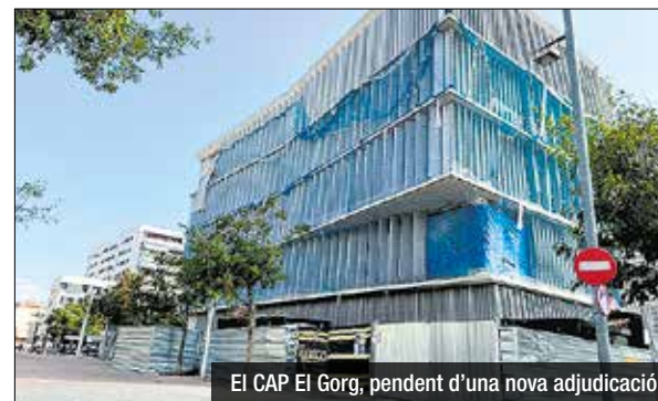
El CAP El Gorg, pendent d'una nova adjudicació

L'empresa adjudicatària del nou CAP El Gorg de Badalona, Construcciones Deco, S. A., ha fet fallida, això obliga a aturar les obres fins que no es resolgui l'adjudicació a una nova empresa. Infraestructures.cat, L'empresa pública encarregada de dur a terme el procés d'execució de les obres que li encomana la Generalitat, està treballant per resoldre una situació que provocarà un endarreriment forçós en el projecte. La previsió és poder fer una nova adjudicació en un termini de cinc mesos. Les obres del Centre d'Atenció Primària El Gorg van començar el gener del 2021 i la duració de les mateixes havia de ser d'uns dos anys.