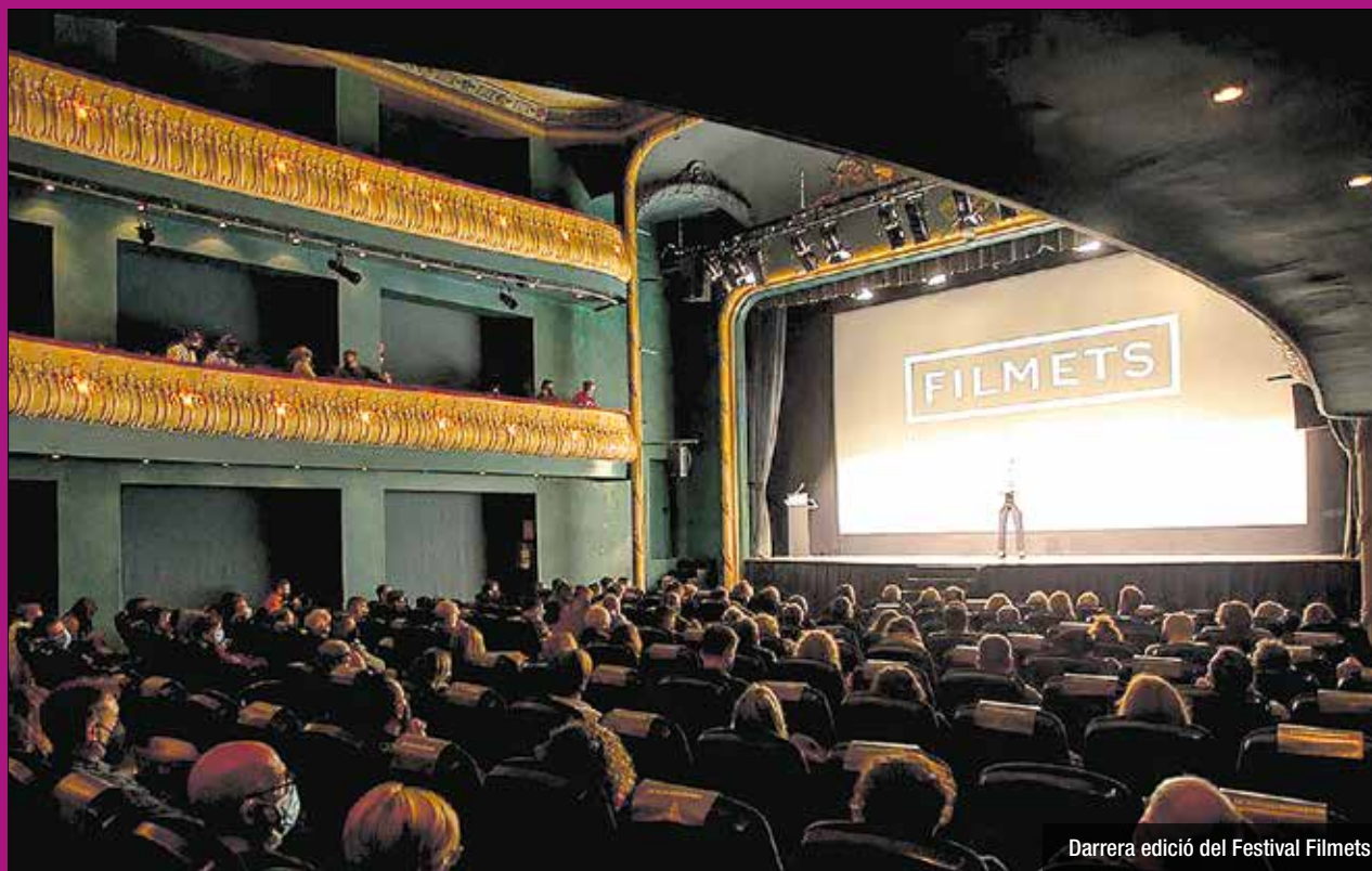
Darrera edició del Festival Filmets

El festival FILMETS arriba per reivindicar la sala de cinema, la presencialitat i el concepte de valorar els films en comunitat en una sala. A més, torna el