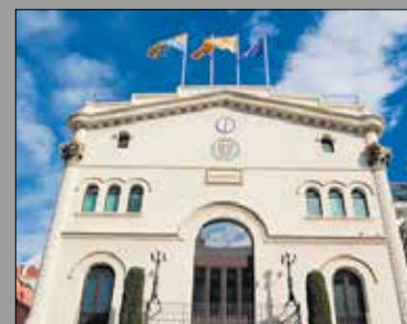
Imatge de la Casa de la Vila de Badalona

L'edifici de la Casa de la Vila de Badalona ha estat incommunicat, sense internet ni telèfon, des de fa una setmana. Dijous passat, mentre es feien uns treballs a la via pública, concretament al carrer Francesc Layret, es va tallar per error un cable de la fibra òptica de la Casa de la Vila de Badalona. Fonts municipals asseguren que ja han recuperat la connexió i tots els grups municipals ja poden seguir amb la seva activitat.