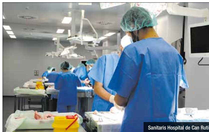
Sanitaris Hospital de Can Ruti

ran en activitats molt diverses (vela, kayak, handbike, tennis, entre d'altres). Tot, amb l'objectiu d'augmentar la seva confiança en ells mateixos i que augmentin el seu nivell de participació en la societat. És hospital universitari especialitzat en la rehabilitació intensiva per a pacients després d'un ictus, traumatisme cranioencefàlic, lesió medul·lar, pacients amb paràlisi cerebral infantil, ELA i altres malalties neurològiques. El centre atén tant adults com nens (des dels primers mesos).