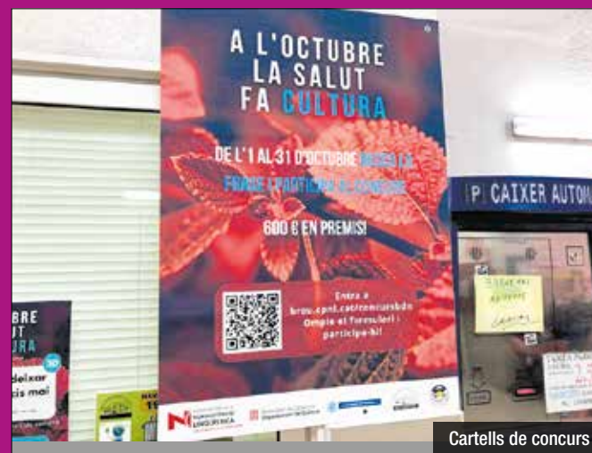
Cartells de concurs

en vals de descompte. El dia 2 de novembre es farà el sorteig i el dia 4 de novembre, a les 17.30 h, s'entregaran els premis a les persones guanyadores al passeig de la Salut, amb una xocolatada popular per a tothom.