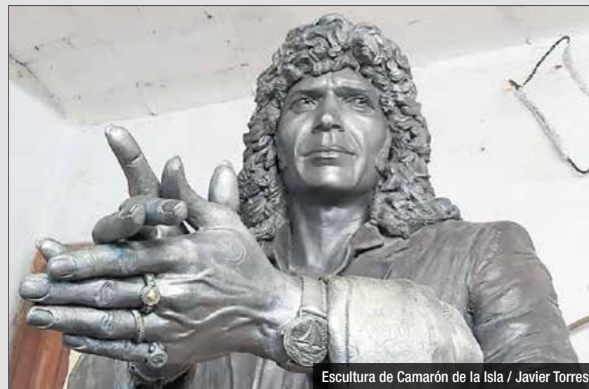
Escultura de Camarón de la Isla

contracte. El problema el van arrossegar tots els governs que han passat des del 2018 fins ara i s'ha acabat per perdre l'escultura. Durant el mandat de Manuela Carmena, va haver-hi un període de temps que l'Ajuntament de Madrid també es va interessar per aquesta peça d'art.