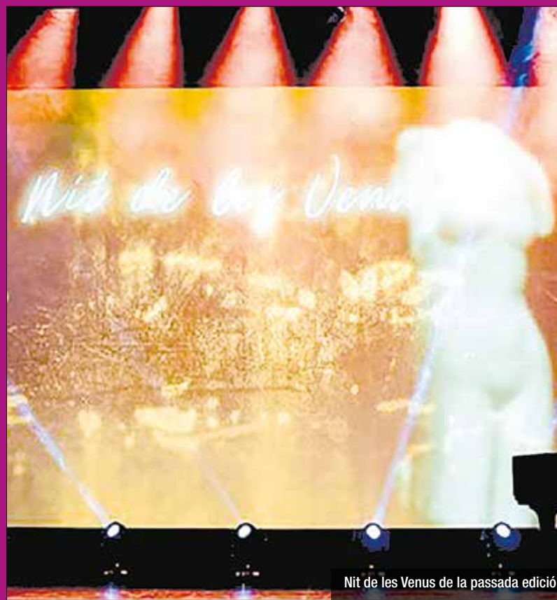
Nit de les Venus de la passada edició

2021, va ser nomenat 'festival col·laborador dels Premis Goya', que atorga l'Acadèmia de las Artes y las Ciencias Cinematogràfiques. Aquest 2022 serà el primer any en que la millor producció espanyola premiada a FILMETS entrarà directament a la 'short list' de finalistes dels premis Goya.