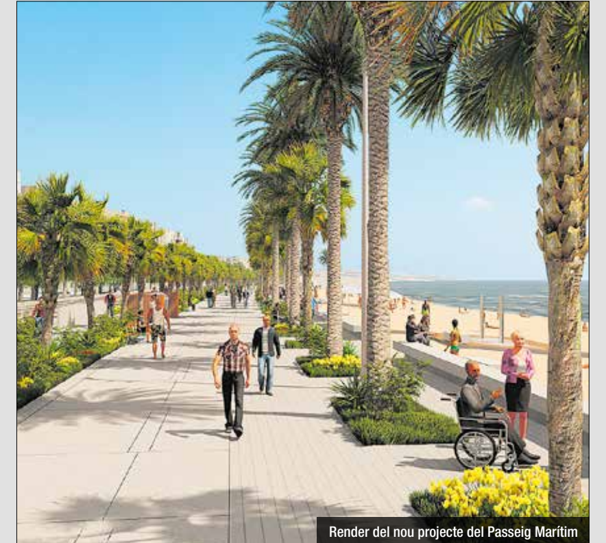
Render del nou projecte del Passeig Marítim

El proper mes de maig es podrà presentar el projecte executiu per remodelar el pont del Petroli, unes obres valorades en 3,2 milions d'euros. Recordem que el gener de l'any 2020, el pas del temporal Glòria va danyar greument el pont del Petroli. Encara que la primera estimació xifrava aquesta actuació en un import d'1,3 milions d'euros, la primera xifra s'ha anat encarint fins arribar als 3.214.000 €.