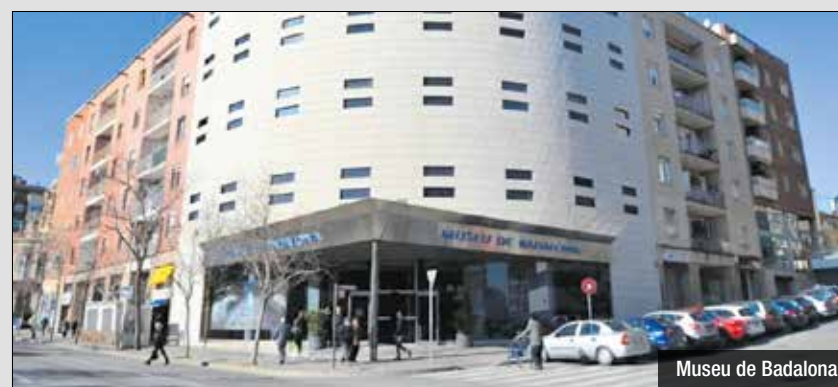
Museu de Badalona

interna i està en contacte amb l'empresa que gestiona el servei de visites guiades. El govern municipal va explicar que el monitor ha estat apartat del seu lloc de treball i, encara que no és directament personal municipal, han qualificat tot plegat de "repulsiu i condemnable".