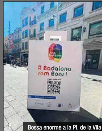
Bossa enorme a la Pl. de la Vila

La campanya pretén triplicar el nombre d'establiments adherits a la primera edició i superar els tres-cents. L'Ajuntament de Badalona i la Cambra territorial del Barcelonès Nord enceten una segona edició de la campanya "A Badalona som bons!" dotada amb més de 365.000 euros que contribuiran a generar un impacte de més de 900.000 euros entre el teixit comercial badaloní.