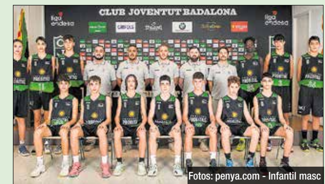
Infantil masc

El Júnior buscarà revalidar el títol de campió de Catalunya (Valls) contra Barça, Manresa i Hospitalet i, també defensar títol de campions d'Espanya a Huelva.