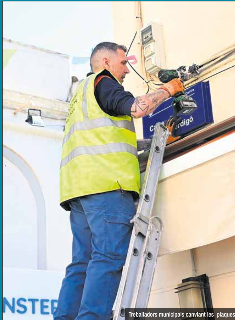
Treballadors municipals canviant les plaques

No és el primer cop que les plaques dels carrers i places de Badalona porten polèmica. L'any 2018, el barri del Centre es va aixecar