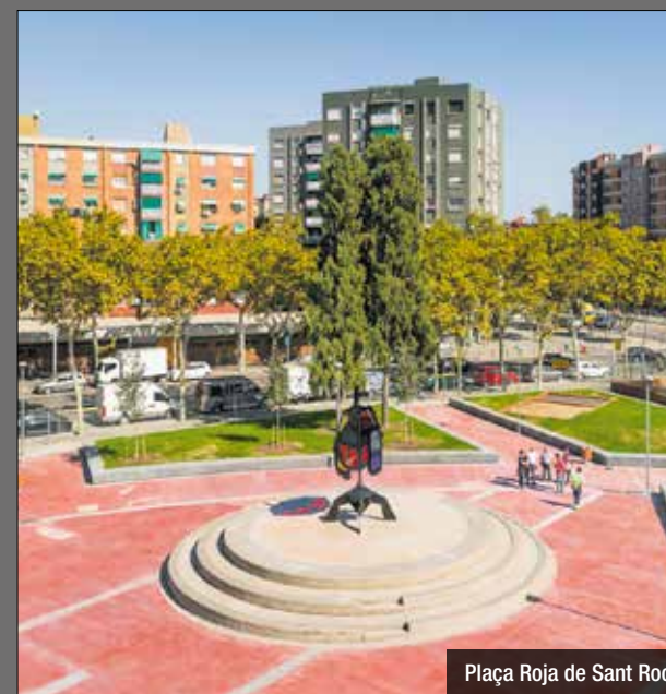
Plaça Roja de Sant Roc

El diumenge 2 d'abril hi va haver cinc ferits en una baralla entre clans al barri de Sant Roc. Els Mossos d'Esquadra van detenir a set persones pels fets que van tenir lloc entre carrer Jerez de la Frontera i la Plaça Roja. La baralla tenia relació la