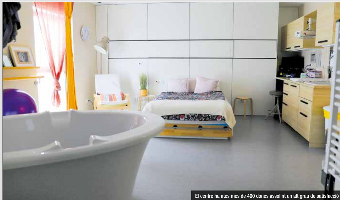
El centre ha atès més de 400 dones assolint un alt grau de satisfacció

La Casa Laietània és un espai confortable, íntim i acollidor el més similar possible a una llar. A les seves instal·lacions s'hi troben dues habitacions amb bany; una banyera de parts i dutxa àmplia; un llit doble per descansar o utilitzar durant el part o el postpart; nevera, microones i utensilis per preparar infusions o cafè; màrtegs, lianes i pilotes, i un espai amb barres de subjecció i mobles a diferents alçades per promoure la mobilitat. El dia del part la gestant pot estar acompanyada per la seva parella o acompanyant durant tot el procés i si té més fills també hi poden ser, en tant que compta amb un espai de jocs i mobles adaptats als infants. Pel que fa a les mesures d'analgesia del dolor no farmacològiques, es compta amb massatges, aromateràpia, tècniques de respiració i relaxació i òxid nítric, entre d'altres.