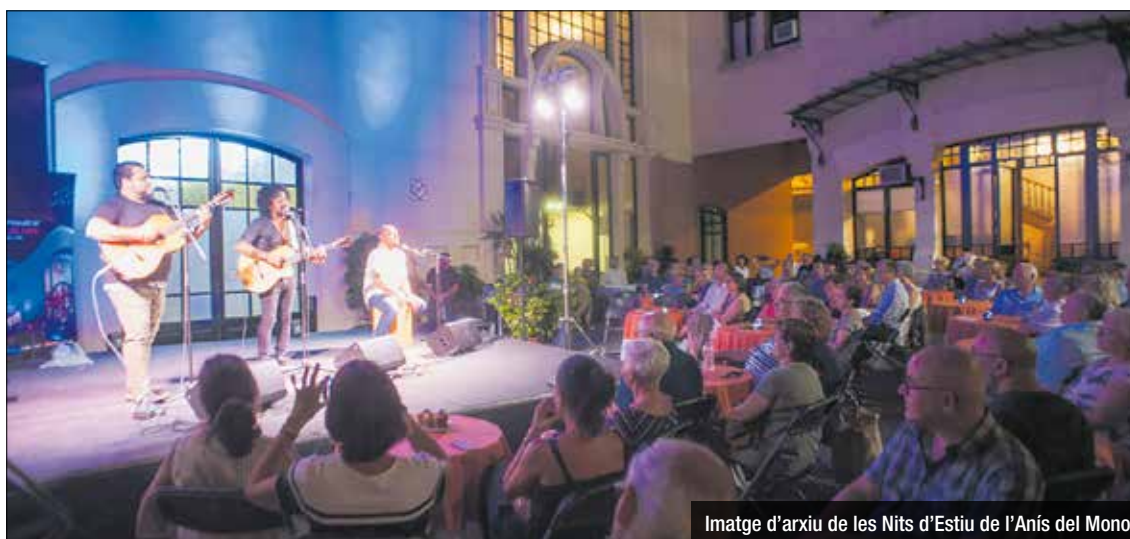
Imatge d'arxiu de les Nits d'Estiu de l'Anís del Mono