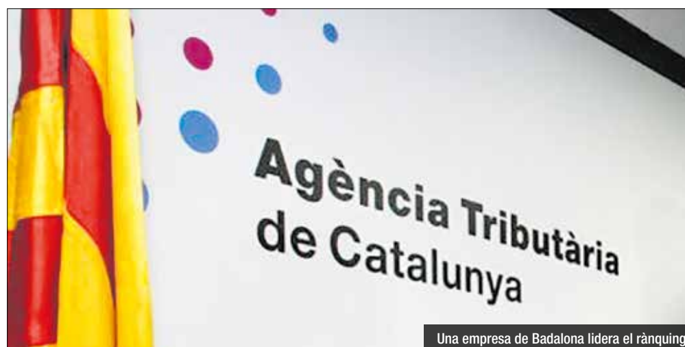
Una empresa de Badalona lidera el rànquing

panya d'Aigües SA, de Maçanet de la Selva, amb 7,5 milions d'euros. Entre les companyies amb més deute també hi ha Riera de Cabanyes Companyia d'aigües, amb 6,8 milions d'euros. Entre les persones físiques, destaca Montserrat Unanue Navarro, amb 3,1 milions d'euros; i Victor Juan Fontfreda, amb 2,3 milions d'euros.