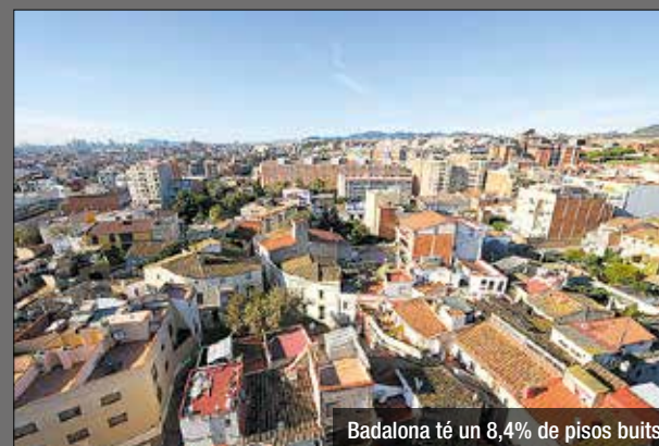
Badalona té un 8,4% de pisos buits

Badalona es troba entre les ciutats de l'Estat espanyol amb més pisos buits. Gairebé en 1 de cada 10 immobles, no hi viu cap persona i està buit. Així ho apunta el cens d'habitatge que ha publicat l'Institut d'Estadística espanyol, que per primer cop recull la xifra de pisos sense habitar. El càlcul es fa tenint en compte el consum elèctric mínim que tenen els immobles que estan