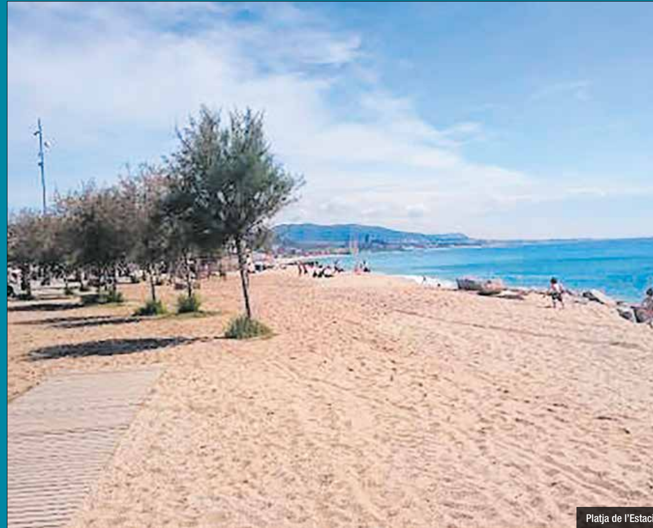
Platja de l'Estació

A més dels equips de música o els elements d'acampada, l'ordenança també sanciona l'ús d'instruments que puguin produir molèsties a la resta de banyistes, la instal·lació de para-sols amb laterals, de missatges publicitaris, i determinades accions, com ara dormir a la platja o fer-hi foc. També està prohibit fer servir xampú, sabons i altres productes d'higiene personal a les dutxes, tot i que en aquest últim cas no es preveuen multes econòmiques, ja que les dutxes estan tancades aquest estiu per la sequera. La normativa també sanciona la venda ambulants sense