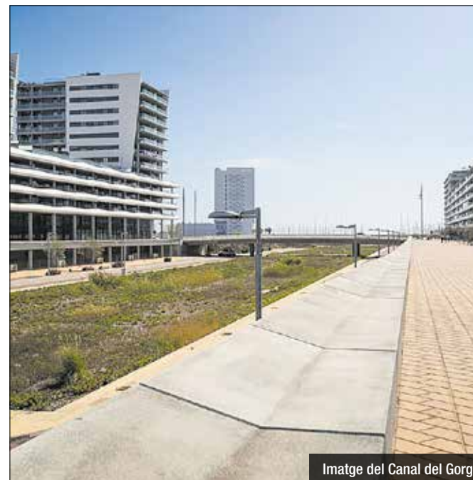
Imatge del Canal del Gorg

El govern català impulsarà una llei per regular els contractes de lloguer de temporada i evitar que els propietaris utilitzin aquesta modalitat per "esquivar la limitació de preus" que s'establirà a l'empара de la nova llei espanyola d'habitatge. El Departament de Territori ha fet públic el llistat de 140 municipis que compleixen els requisits que marca la llei i on viu el 80,6% de la població de Catalunya. Un cop finalitzada la informació pública, es respondran les al·legacions rebudes i la resolució final es notificarà al Ministeri de Transports, Mobilitat i Agenda Urbana (MITMA), que serà finalment qui l'aprovarà. La Generalitat ha recordat —segons la llei estatal— quan el pis sigui propietat d'un gran tenidor, el lloguer no podrà ser superior a l'índex de referència del preu de lloguer. La Generalitat