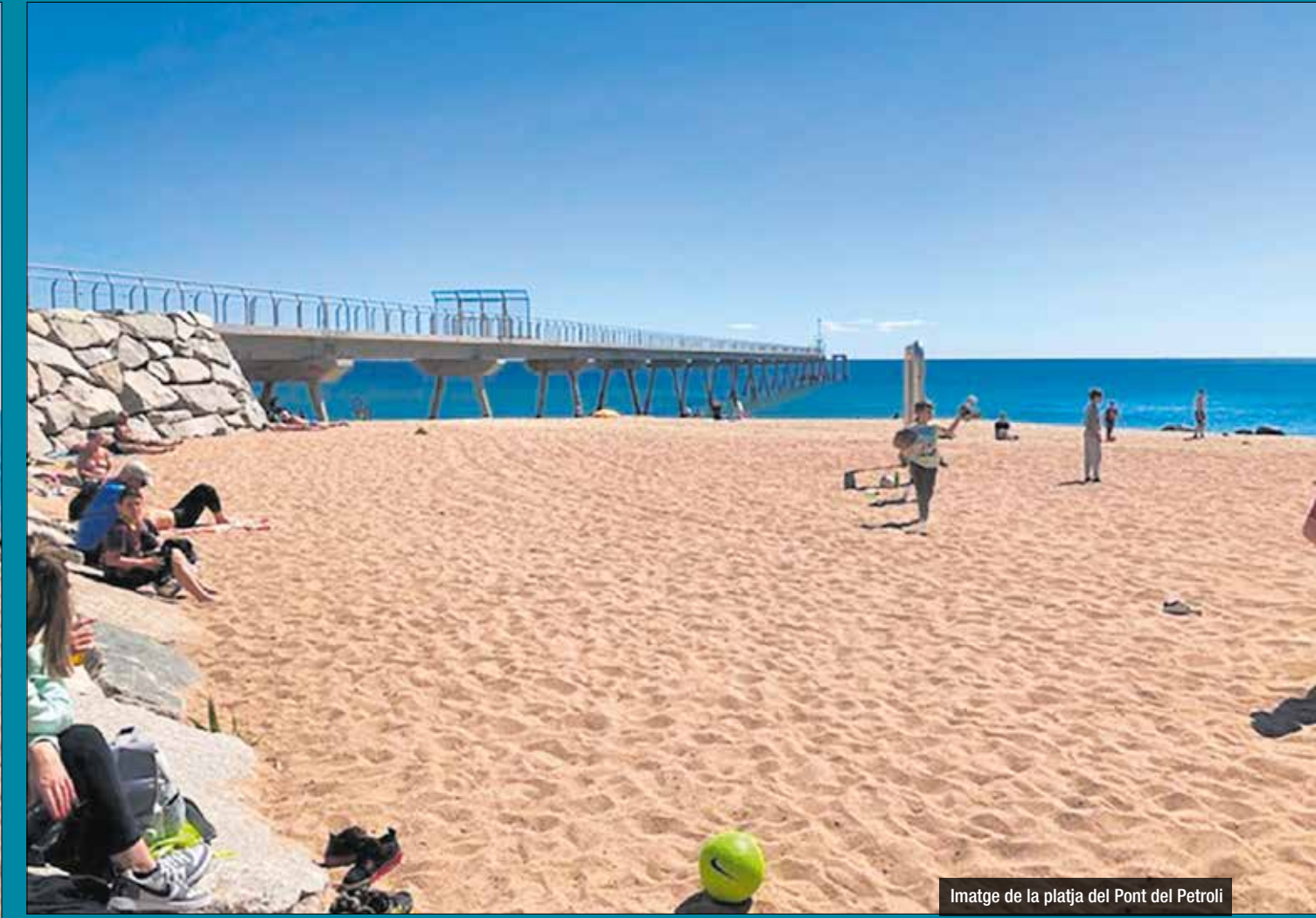
Imatge de la platja del Pont del Petrolí