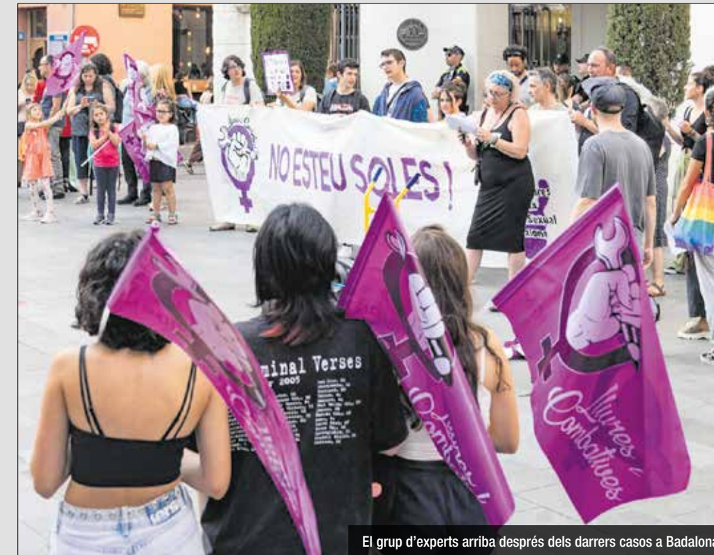
El grup d'experts arriba després dels darrers casos a Badalona

La mesura arriba després dels darrers casos a Badalona