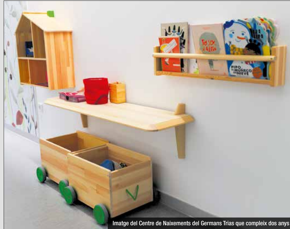
Imatge del Centre de Naixements del Germans Trias que compleix dos anys

Aquestes xifres també s'acompanyen d'un alt grau de satisfacció, com ho demostren algunes de les experiències i testimonis recollits i viscuts en aquest temps. De fet, la Casa Laietània i la tasca de les seves professionals suposen el servei