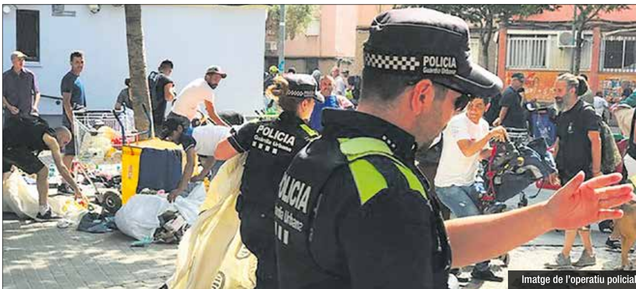
Imatge de l'operatiu policial

juny, es van instal·lar la meitat i encara quedaven 4 per muntar. Aquesta setmana ha seguit el muntatge d'altres establiments de platja, com el situat a la platja dels Pescadors.