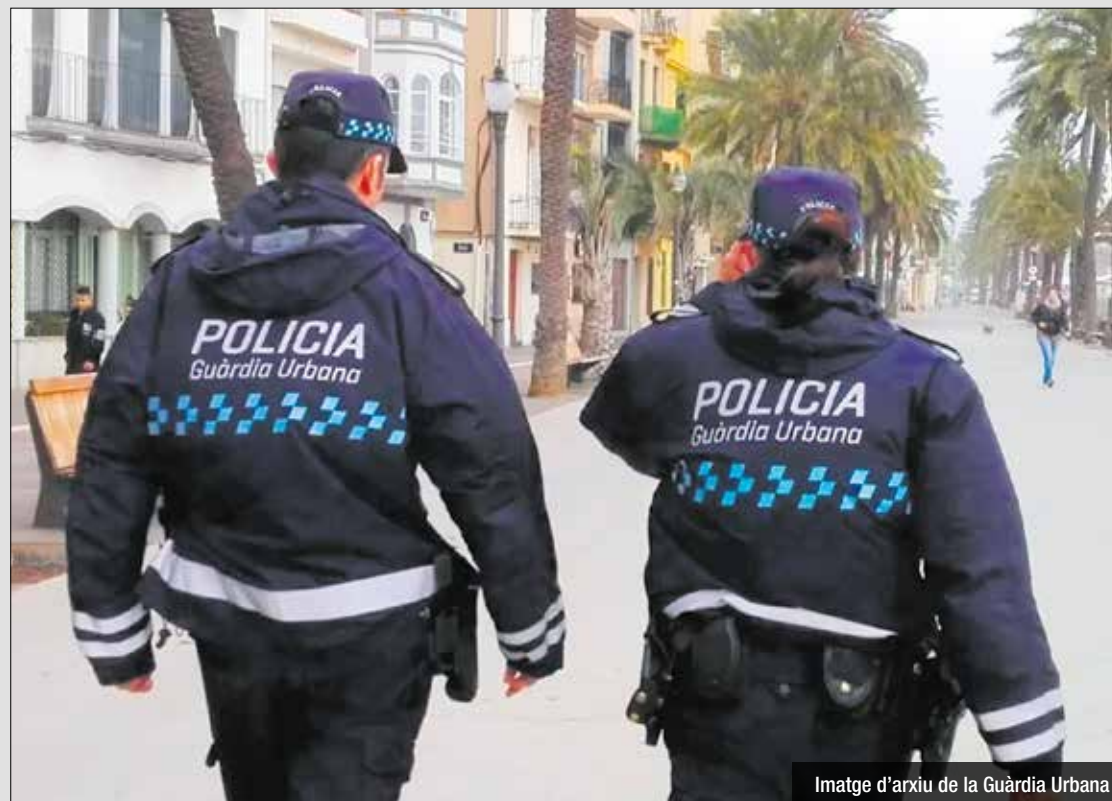
Imatge d'arxiu de la Guàrdia Urbana

Les vacances d'agents de la Guàrdia Urbana ha obligat a activar la mesura