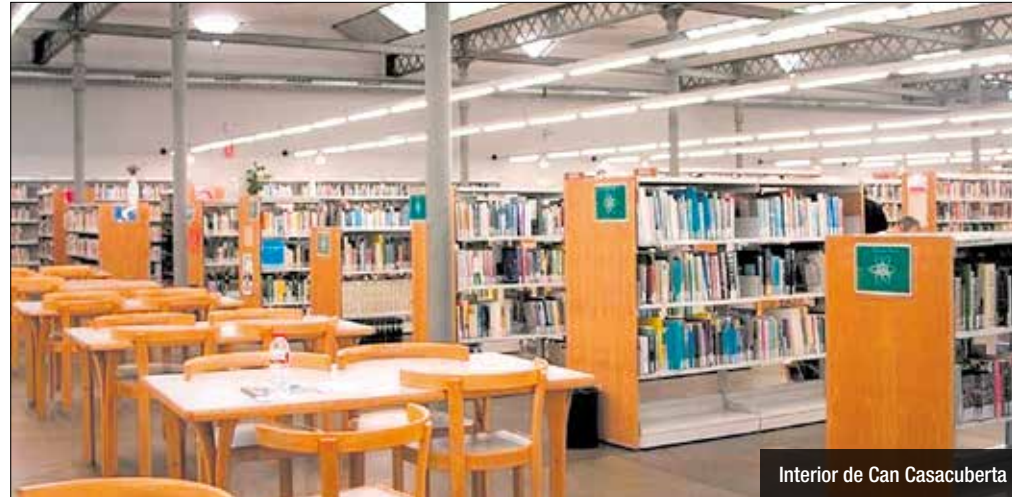
Interior de Can Casacuberta

Queixes a Can Casacuberta per altes temperatures