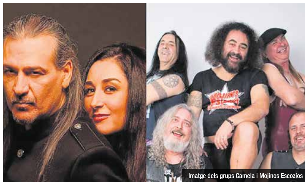
Imatge dels grups Camela i Mojinos Escozíos