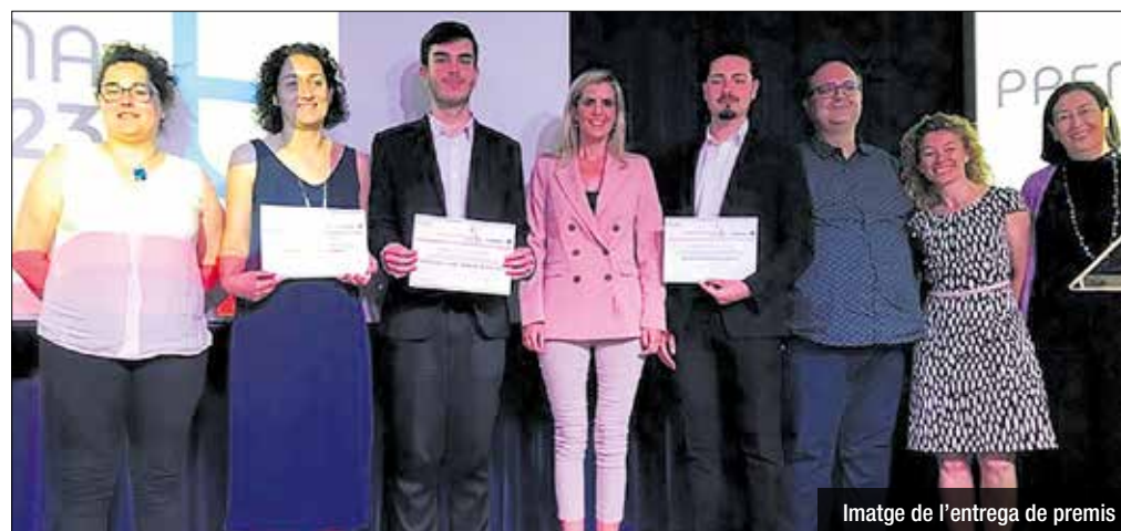
Imatge de l'entrega de premis

La Cambra de Comerç de Barcelona al Barcelonès Nord i l'Ajuntament de Badalona, a través de Reactivació Badalona, han reconegut el treball dedicat a la virtualització i digitalització de continguts educatius realitzat per alumnes de l'institut Pompeu Fabra com a millor projecte final de formació professional en el marc dels primers premis FP