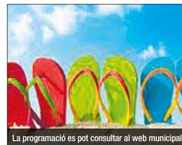
La programació es pot consultar al web municipal

El Departament de Joventut de l'Ajuntament de Badalona presenta el programa "Badalona i... acció!", una completa oferta d'activitats per a joves d'entre 13 i 18 anys a realitzar fins al 28 de juliol. Amb l'objectiu de promoure un lleure participatiu i profitós durant els mesos d'estiu, aquest projecte pretén posar a l'abast dels joves una oferta d'activitats atractiva i àmplia, a la vegada que incorpora un vessant formatiu destinat a facilitar la seva autonomia i a establir itineraris en tots els àmbits que configuren el seu projecte de vida. Totes les activitats són gratuïtes.