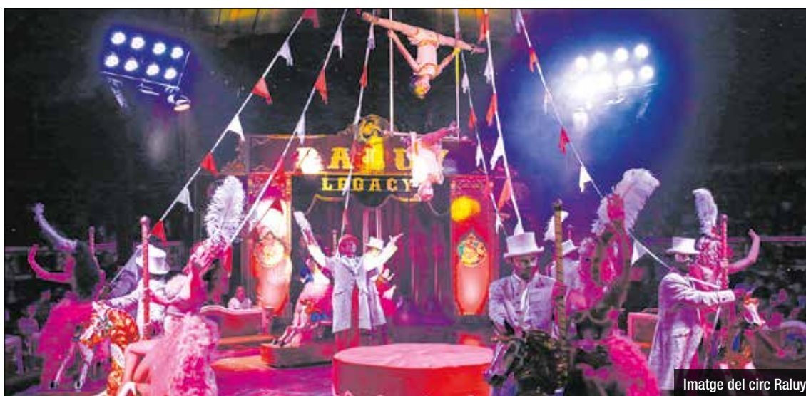
Imatge del circ Raluy

Un any més el Museu proposa una combinació de patrimoni i música. El marc és millorable i irrepetible: la fàbrica de l'Anís del Mono. Un espai carregat d'història, art i anècdotes que us captivaran i us transportaran a l'època de la industrialització, un període de creixement econòmic que donaria origen al moviment modernista, un dels més significatius de la història de Catalunya, i que transformà la manera d'entendre el món. La primera sessió de les Nits d'Estiu tindran lloc aquest mateix divendres, 7 de juliol, amb Anthus Quintet. Love! Homenatge a Nat King Cole, a les 21h.