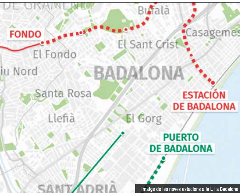
Imatge de les noves estacions a la L1 a Badalona

El Departament de Territori ha licitat el projecte constructiu de l'extensió de l'L1 de metro de Santa Coloma de Gramenet fins a Badalona per 2,8 milions d'euros, segons s'ha publicat en el portal per la transparència. Concretament, el valor estimat del contracte per al projecte constructiu del tram Fondo - Lloreda Sant Crist és de 2,3 milions d'euros més l'IVA del 21% i el termini d'execució és de 12 mesos. La Generalitat va publicar la licitació dilluns passat i estableix un termini de presentació de les candidatures fins al 7 d'agost. Un cop finalitzats aquests treballs, es convocarà un altre concurs per adjudicar les obres, que encara tardarien uns tres anys. L'actuació consistirà en dues fases. El primer tram de perllongament d'uns 1,8 quilòmetres en els barris de Badalona Nord, on hi haurà les estacions de Fondo i Lloreda-Sant Crist; i un segon de 2,5 quilòmetres amb tres estacions: Bufalà, Badalona Pompeu