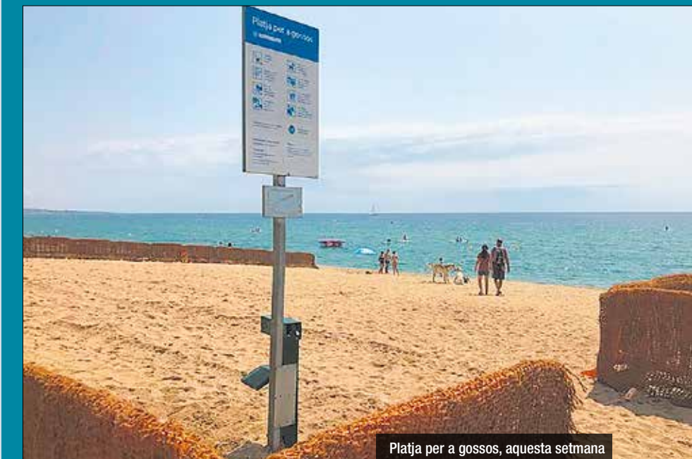
Platja per a gossos, aquesta setmana

Badalona torna a reservar un tram de platja de 900 metres quadrats per a poder-hi dur gossos