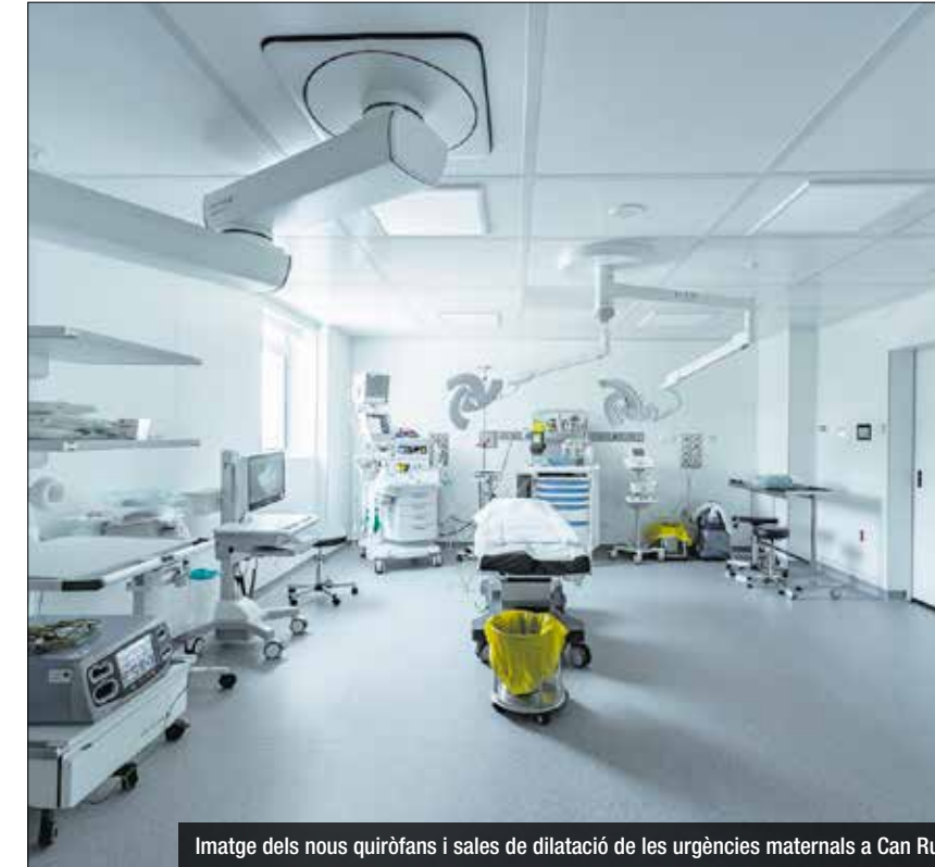
Imatge dels nous quiròfans i sales de dilatació de les urgències maternals a Can Ruti

Les obres han tardat cinc anys i s'han fet en cinc fases