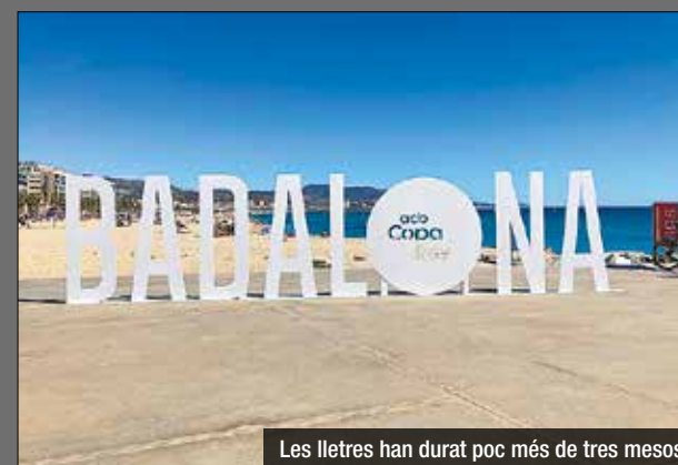
Les lletres han durat poc més de tres mesos

El nou govern del PP ha anunciat, aquesta setmana, que el Ministeri per a la Transició Ecològica ha multat el consistori amb 18.000 euros per no haver demanat permís per instal·lar al passeig Marítim les lletres gegants amb el nom del municipi. Segons el consistori, la zona és de domini públic marítim-terrestre, de manera que és el Ministeri qui ha d'autorit-