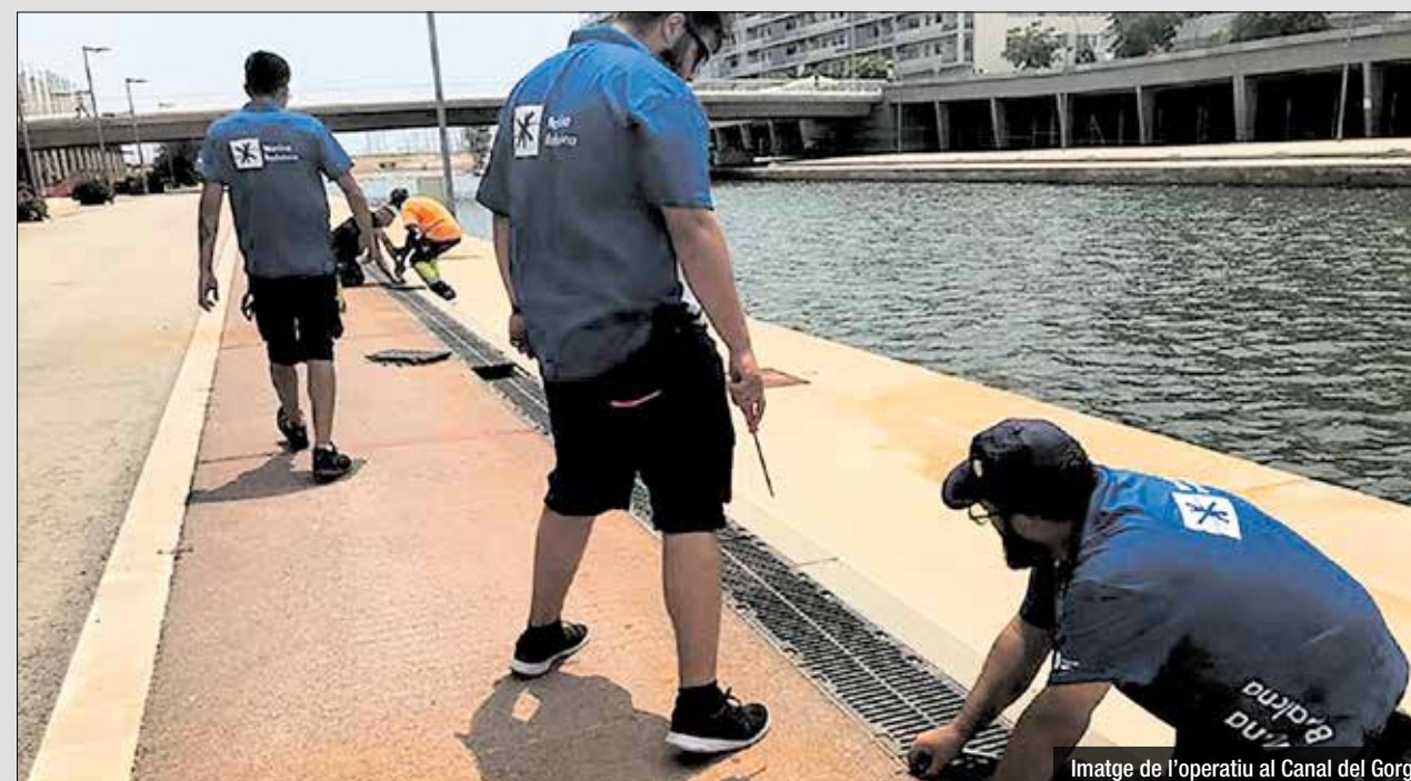
Imatge de l'operatiu al Canal del Gorg

d'aquesta espècie pot provocar incomoditat i molèsties als veïns i comerços de la zona, motiu pel qual l'equip tècnic ha acordat en una reunió mantinguda amb els veïns fer diverses accions per reduir aquests insectes.