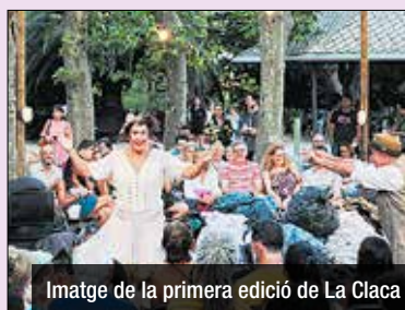
Imatge de la primera edició de La Claca

Nou episodi de cancel·lació d'esdeveniments organitzats per l'ajuntament per problemes amb la tramitació de licitacions. L'Ajuntament de Badalona ha comunicat a les entitats participants del Festival La Claca que "no s'ha pogut arribar a temps" a la tramitació de la licitació que inclou tota la producció tècnica del festival teatral. La Claca, el festival d'arts de carrer de Badalona, s'havia de celebrar aquest mes de juliol a diversos punts de la ciutat, com el Passeig Marítim o el Parc de Can Solei i Ca l'Arnús. L'any passat, primera edició, hi van participar entitats com La Dramàtica del Círcol, La Industrial Teatrera o La Melancòmica.