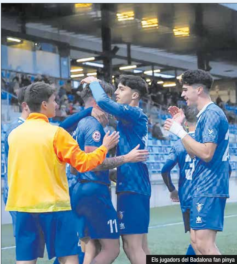
Els jugadors del Badalona fan pinya

El darrer play-off de 3a a 2a (B o RFEF) va significar l'ascens