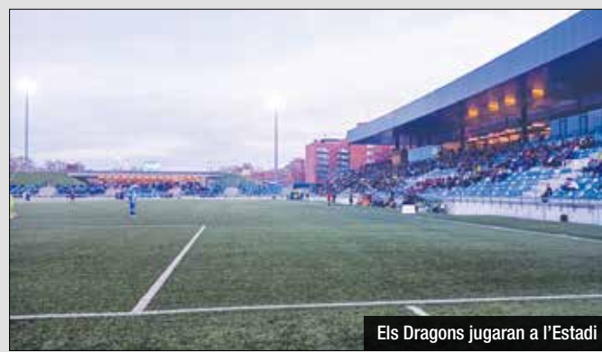
Els Dragons jugaran a l'Estadi

Segons els experts, no sembla que els Dragons puguin optar a arribar molt lluny en aquesta competició. La franquícia ha patit una important reestructuració, amb canvi de propietaris, direcció tècnica i entrenador. A més, el debut a la competició de Madrid Bravos, amb una millor estructura, comporta que els millors jugadors nacionals decideixin marxar a la capital.