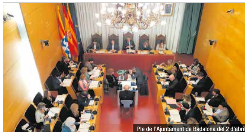
Ple de l'Ajuntament de Badalona del 2 d'abril

li corresponen. També mostra evidència que els presumptes representants que esmenten l'oposició, no han sigut anomenats per veïns. Presenta escrits signats. Albiol