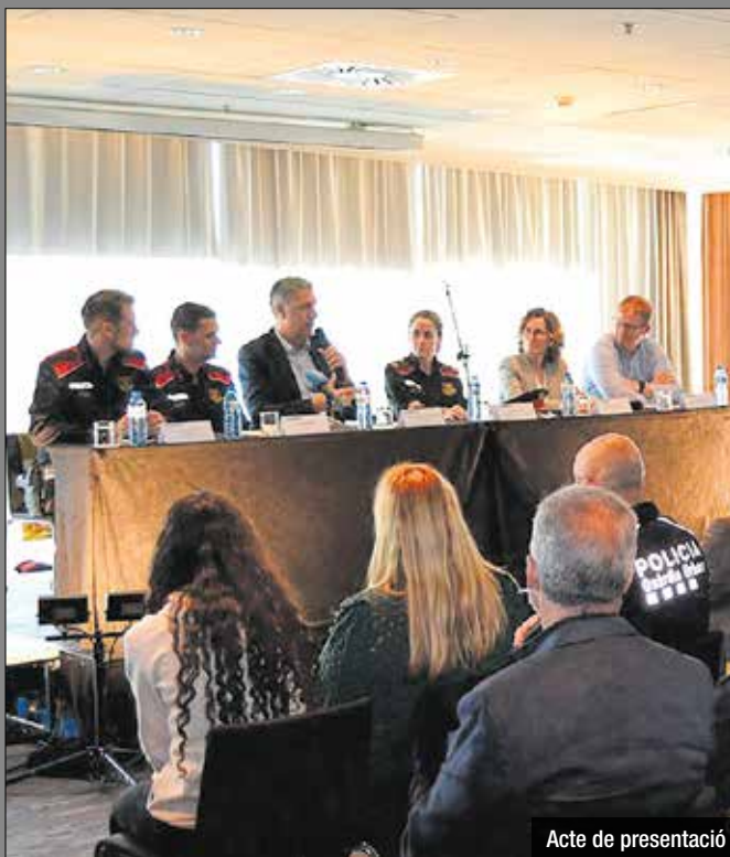
Acte de presentació

Diumenge 14 d'abril Badalona acollirà la III Cursa Solidària dels Mossos d'Esquadra. Aquesta cur-