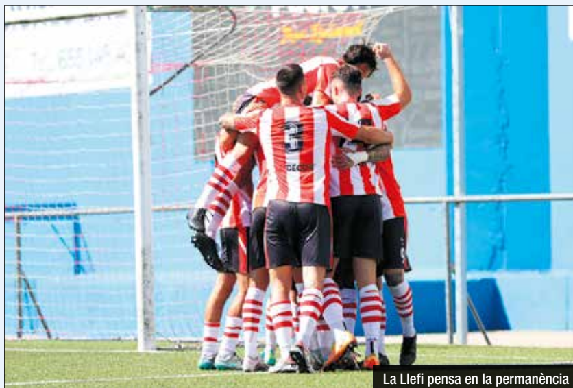
La Llefí pensa en la permanència