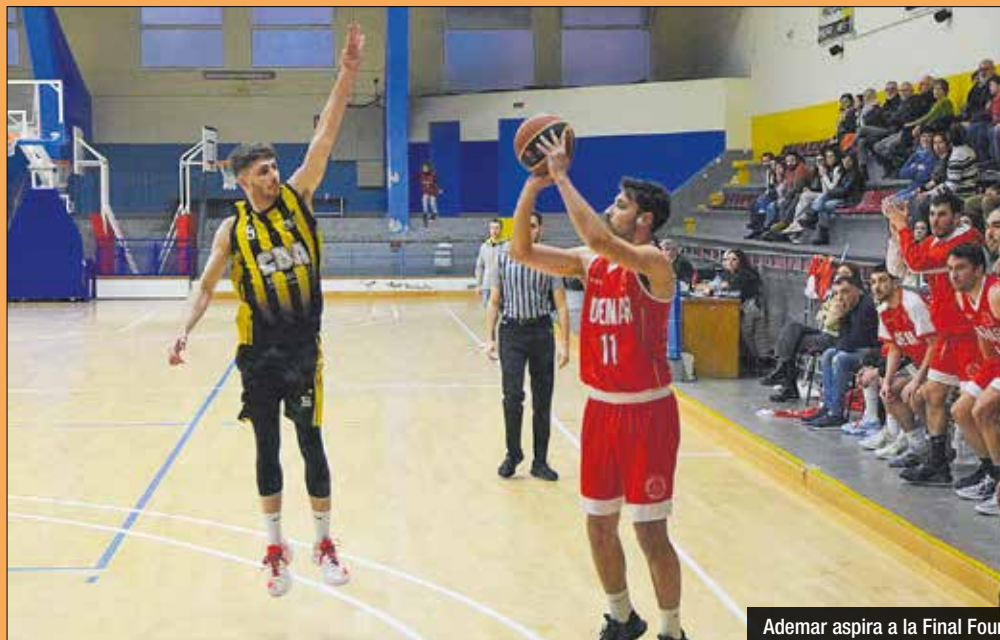
Ademar aspira a la Final Four