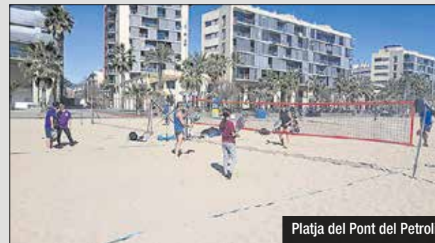
Platja del Pont del Petroli

Aquest cap de setmana la platja del Pont del Petroli viurà el Torneig Shark Beach Tennis, organitzat pel Beach Tennis Badalona. Aquest torneig forma part del circuit federat de tennis platja català, i és també puntuable per al rànquing nacional. Dissabte tindrà lloc la competició masculina i la femenina, mentre que diumenge es disputarà la competició en categoria mixta. S'habilitaran un total de 16 pistes de tennis platja, i s'espera aproximadament la participació d'uns 200